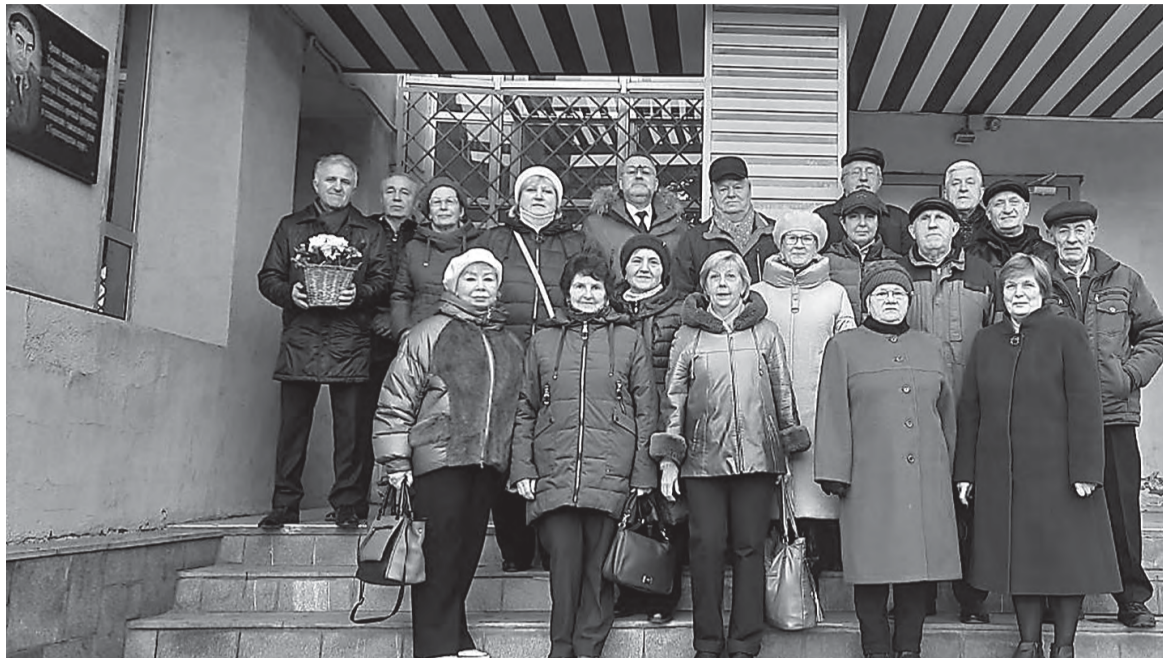
Ветераны таможенной службы.