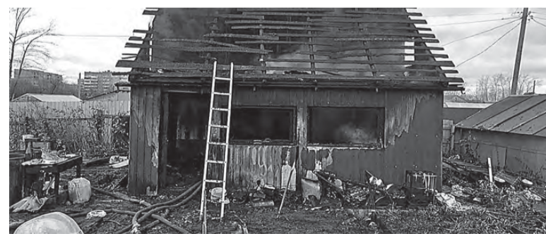
Страницу подготовила Диана СТРУКОВА.

ментально охватил весь дом. Владелец участка получил ожоги ног и надыхался угарным газом, он госпитализирован. А вот тело женщины нашли спустя пару часов при разборе сгоревших конструкций, ее личность устанавливается.