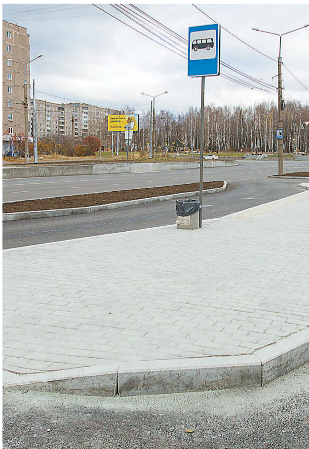
Оборудована новая посадочная площадка на конечной остановке автобуса №55.

- Без сложностей не обошлось, потому что все здесь построено 50-70 лет назад. Во время вскрытия старого полотна стало понятно, что где-то нужно менять и укреплять основание дороги, где-то находили