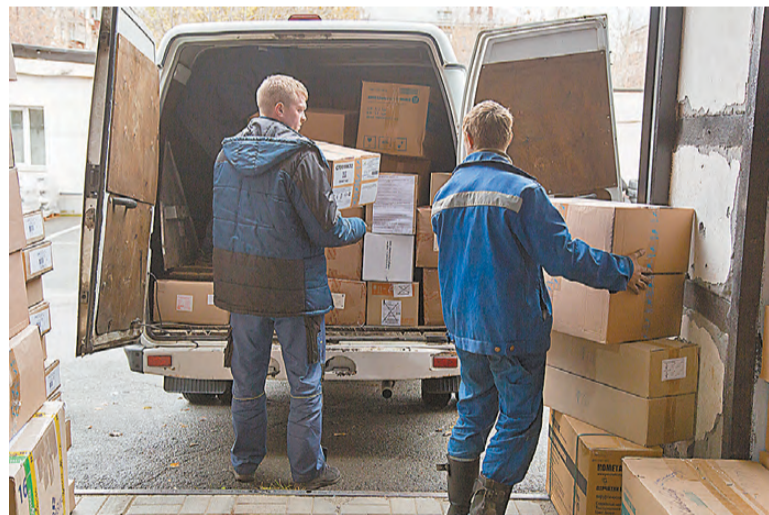
В коробках – рециркуляторы, перевязочные материалы, медикаменты.

Работа по сбору и отправке гуманитарных грузов для жителей Донбасса ведется уже