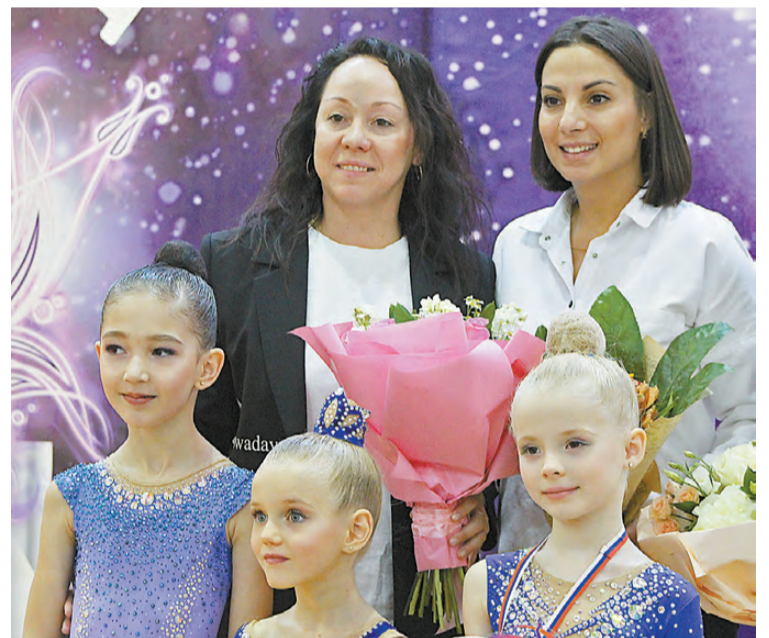
Тренеры СШОР №3 с воспитанницами.