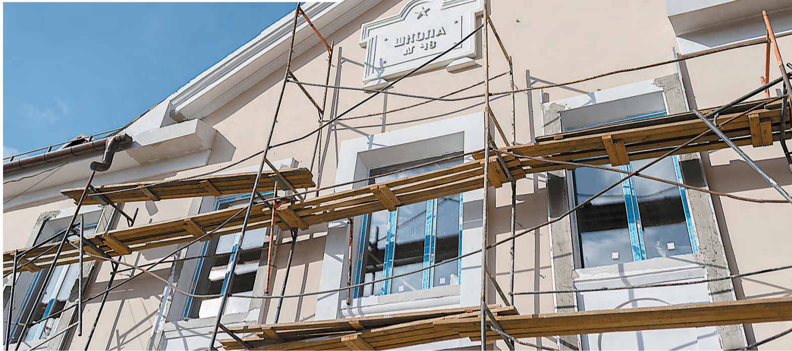
Школа № 48. Пока в «лесках».

– Родители и ученики – активные участники всех обсуждений о том, какой быть школе. Они уже знают, что мы стали участ-