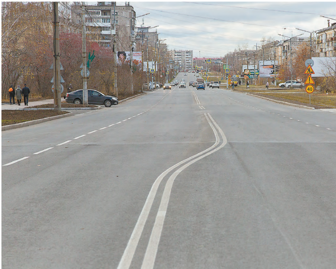
Ленинградский проспект после ремонта.

Татьяна ШАРЫГИНА.