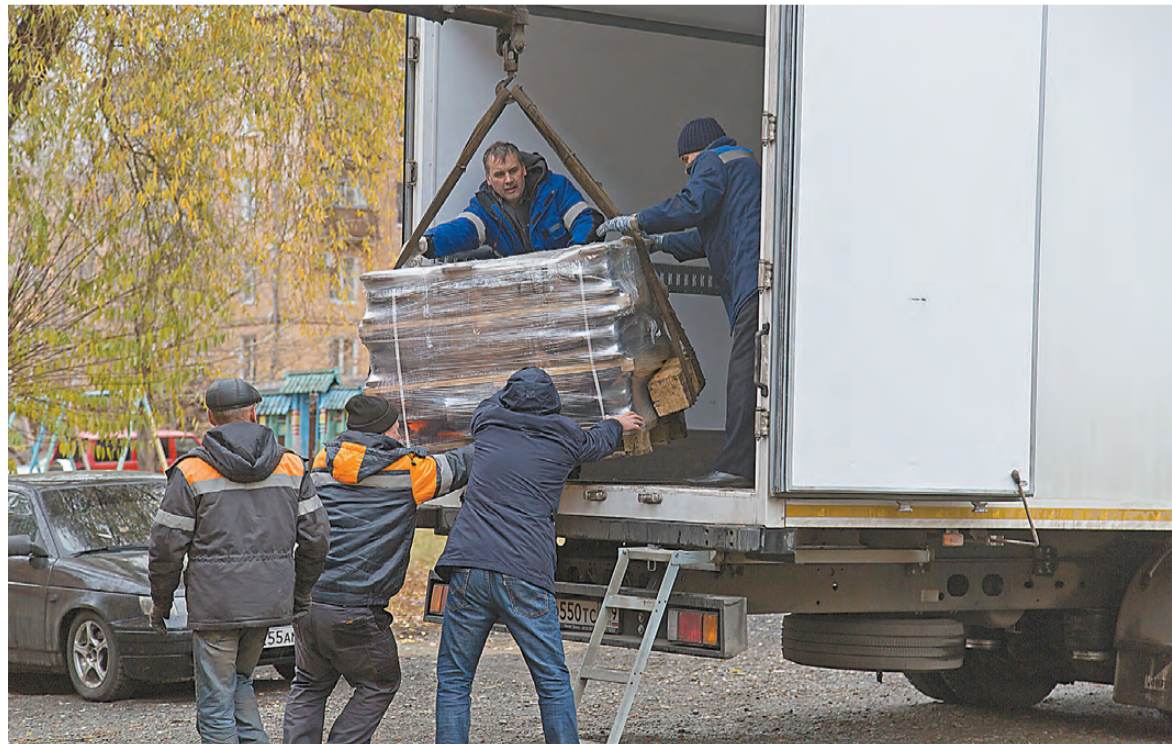
Момент погрузки сантехнического оборудования – движжек.

не первый год, а с первых дней специальной военной операции ее объем увеличился в разы. В этом принимают активное участие практически все жители города – учителя, школьники и их родители, главы районов, ветераны, пенсионеры, предприниматели, бюджетники и другие. Все понимают, что сейчас, как никогда, важно сплотиться, чтобы помочь людям, попавшим в беду.