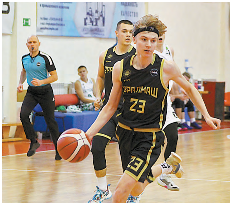
«Уралмаш» в атаке.

В зале «Старый соболь» прошли игры первого раунда первенства России по баскетболу среди юниоров до 19 лет. 42 команды разбиты на семь групп. В Нижнем Тагиле соревновались «Уралмаш-ДЮБЛ» (Екатеринбург), «Иркут» (Иркутск), «Локомотив-Кубань» (Краснодар), «Союз» (Заречный, Пензенская область), «Купол-Родники» (Ижевск) и сборная Белгородской области.