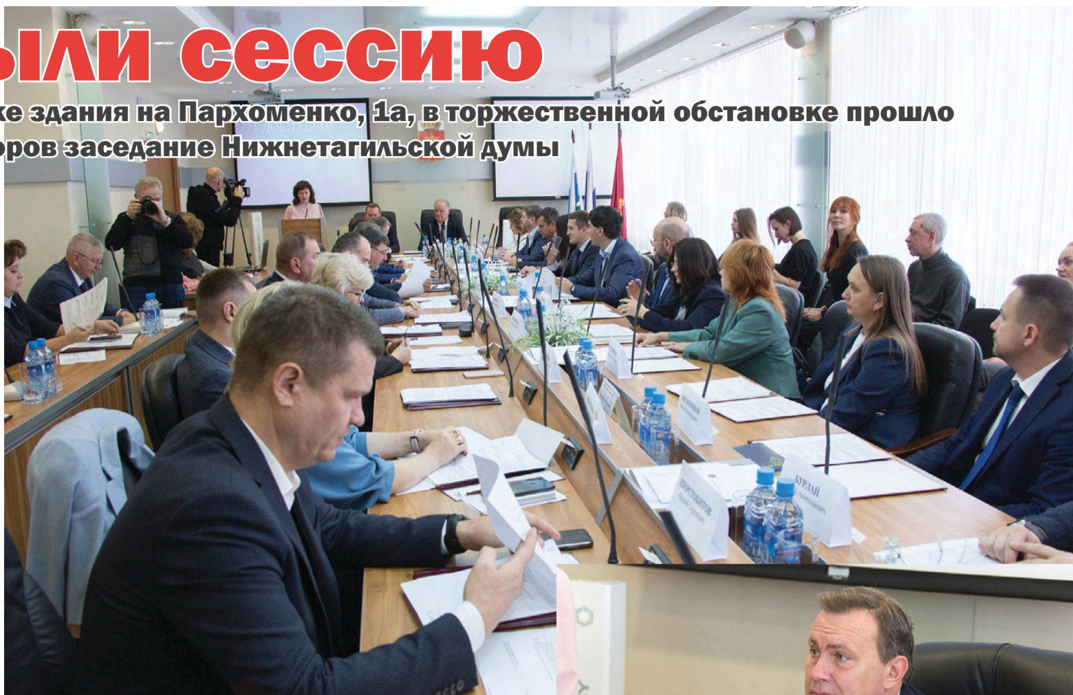
Восьмой созыв начал работу.