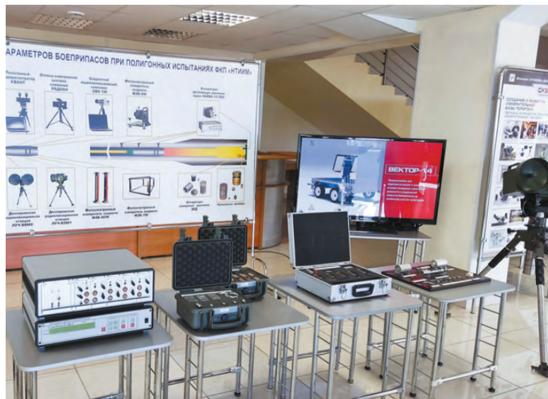
Образцы техники НТИИМ.