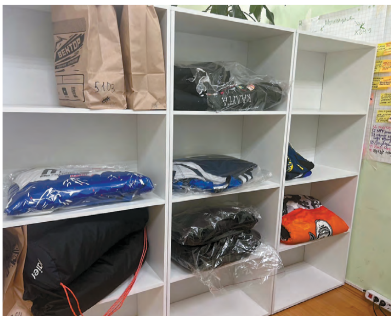
Это только малая часть заказов.