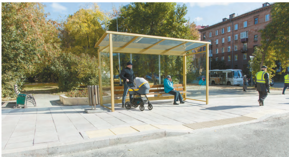
Новый остановочный комплекс.

Татьяна ШАРЫГИНА.