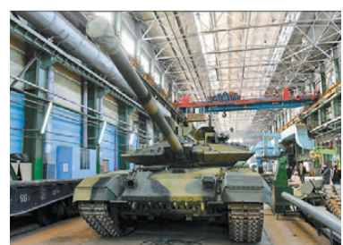
Подготовила А. ЕВГЕНЬЕВА.

По боевой эффективности танк Т-90М значительно превосходит своего предшественника Т-90, но при этом сохраняет его преимущества, такие, как исключительную надежность и минимальный объем технического обслуживания при эксплуатации.