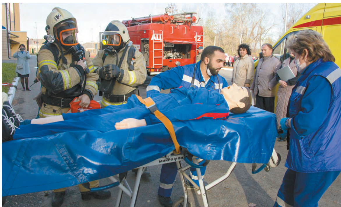
В учениях задействованы все экстренные службы.

Также был развернут пункт выдачи средств индивидуальной защиты ЕВРАЗ НТМК и приведено в готовность защитное сооружение на станции Нижний Тагил.