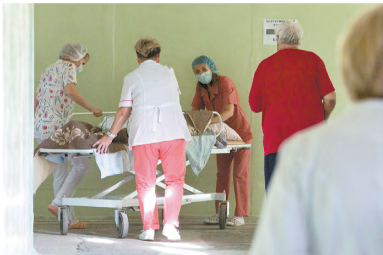
Эвакуация пациентов пульмонологического отделения.