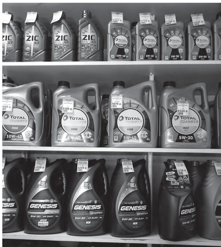
Выбор большой, но цены...