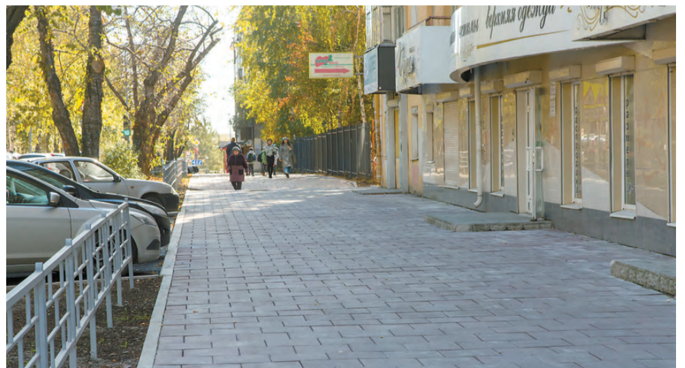
Тротуары выложены плиткой.