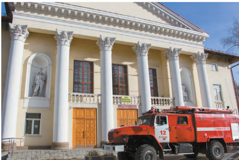
Дворец на случай ЧС может принять 300 человек.