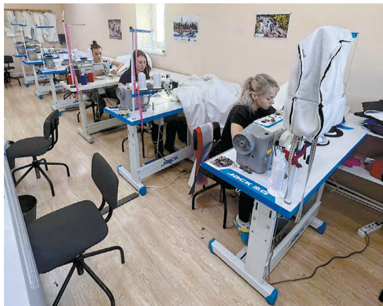
Все сотрудники работают на высокотехнологичном оборудовании.