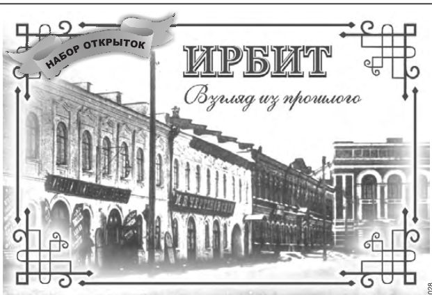
г. ИРБИТ, ул. ГОРЬКОГО, 2-Г, магазин "ИРБИТСКИЕ СУВЕНИРЫ"