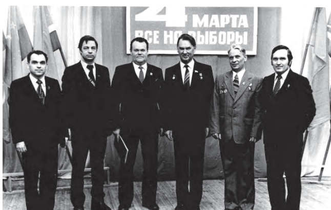
Участники областной партийной конференции