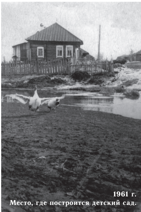
1961 г. Место, где построятся детский сад.