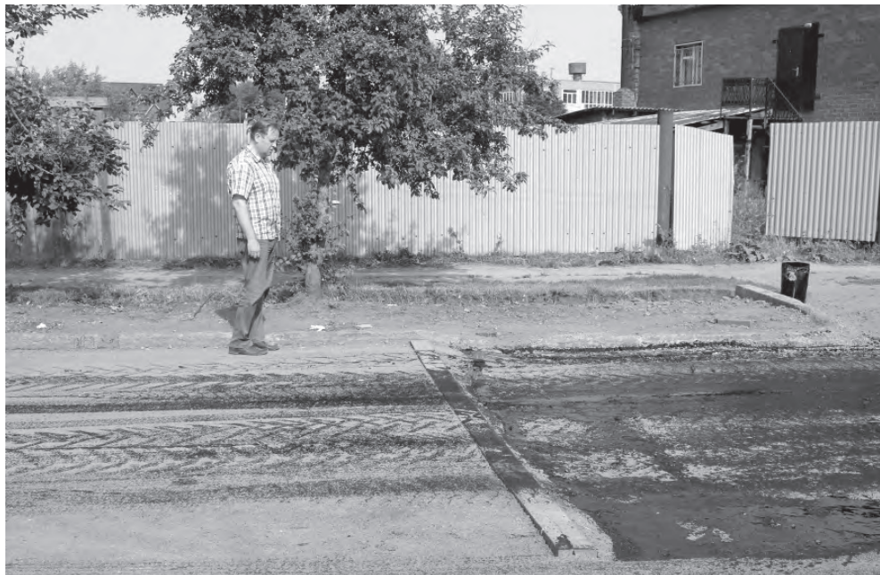
Проверка ремонта дорог.