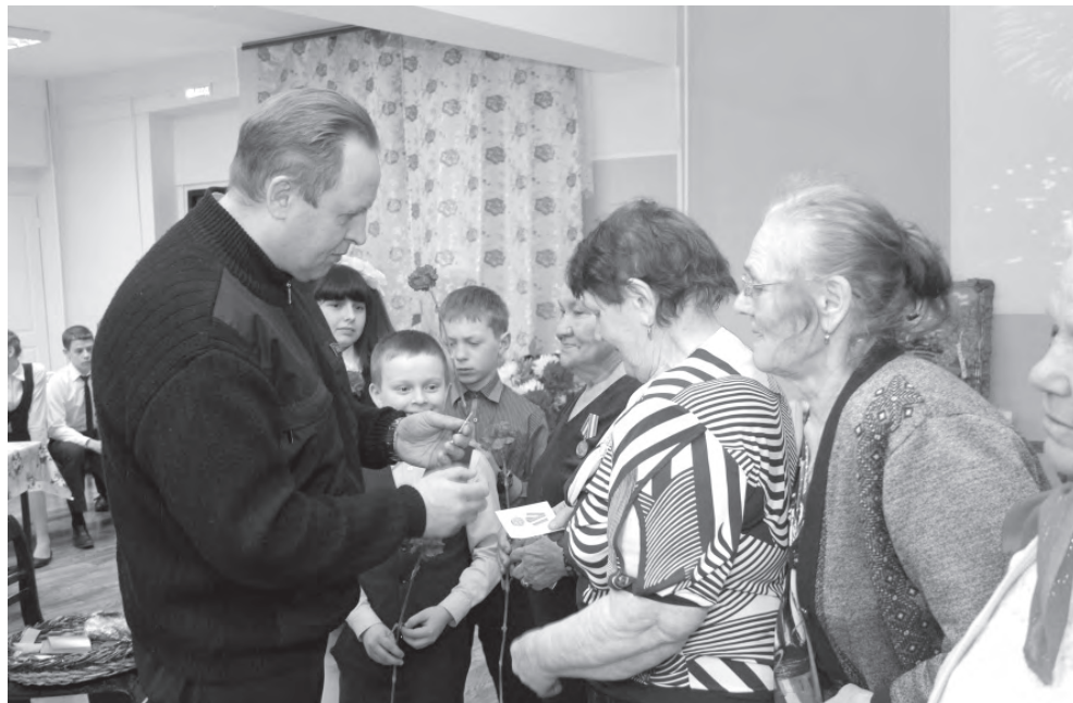
Награждение детей войны села Знаменского.