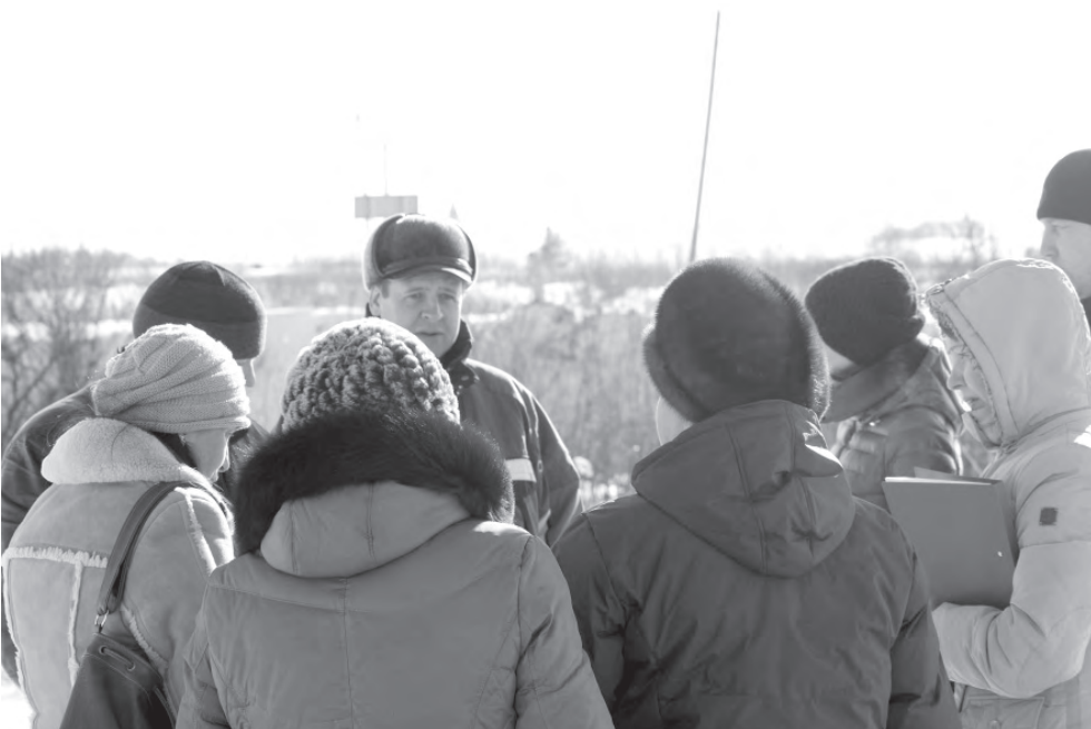
Общение с жителями д. Кекур.