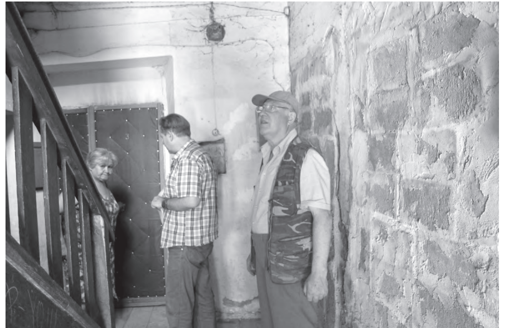
Проверка капитального ремонта.