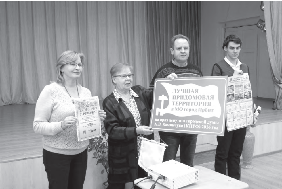
Награждение по итогам конкурса «Лучшая придомовая территория».