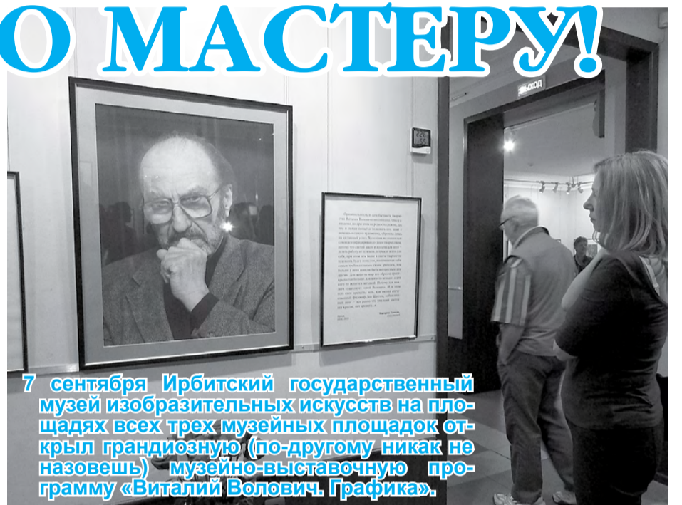
7 сентября Ирбитский государственный музей изобразительных искусств на площадях всех трех музейных площадок открыл грандиозную (по-другому никак не назовешь) музейно-выставочную программу «Виталий Волович. Графика».

У открывшейся выставки особый характер – это единственная такая выставка. Больше в таком количестве никто и никогда работ Воловича не увидит. Просто потому, что больше нигде нет таких экспозиционных возможностей и нет возможности разместить поистине огромный труд всей долгой жизни выдающегося ураль-