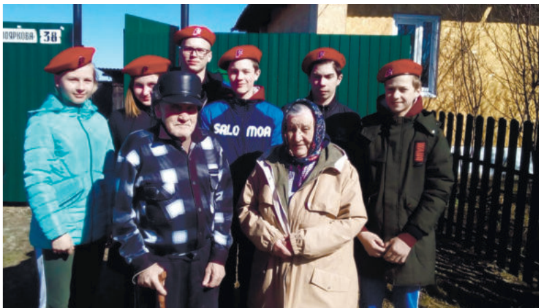
«Киргинские соколы» каждую весну помогают пожилым людям навести порядок на придомовой территории.

Пройти мимо юнармейца, не заметив его, невозможно. Яркая единая форма с символикой: красные берет и футболка-поло, бежевые берцы, брюки, толстов-