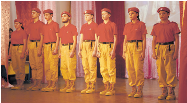
13 декабря три девчонки и три мальчишки присягнули на верность юнармейскому братству.

ки и куртки - притягивают взгляды даже самых равнодушных. Есть у юнармейцев и свое знамя: красное полотнище с символикой юнармии. Всю атрибутику и дорогостоящую парадную форму закупил физкультурно-молодежный центр. Учреждение приобрело для клуба макет автомата, магазины для патронов, стенд для стрельбы, общевойсковой защитный комплект, пневматические винтовки и другое.