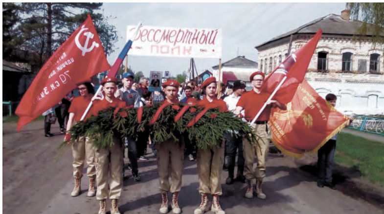
Юнармейцы участвуют во всех мероприятиях, посвященных памятным датам и государственным праздникам.

Впервые клятву юнармейцев киргинские ребята произнесли в феврале 2019 года. Тогда « быть верным своему Отечеству и юнармейскому братству » поклялись девять мальчишек и девчонок - учеников 5-10 классов. Сегодня состав отряда обновился почти на треть: часть ребят окончили школу и выпустились из клуба, поэтому в ряды юнармейцев влились новобранцы.