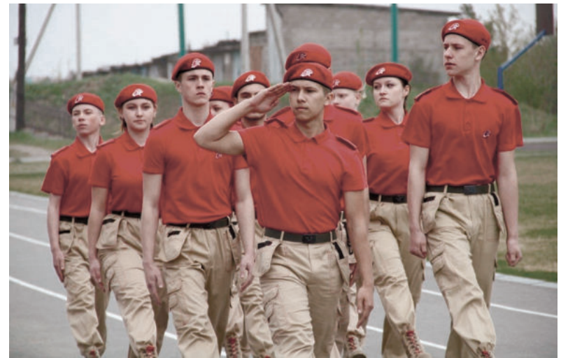
На районном смотре-конкурсе строя и песни.

Очередное посвящение «киргинских соколов» в ряды юнармейцев состоялось 13 декабря. Мероприятие прошло в местном доме культуры. Поздравили ше-