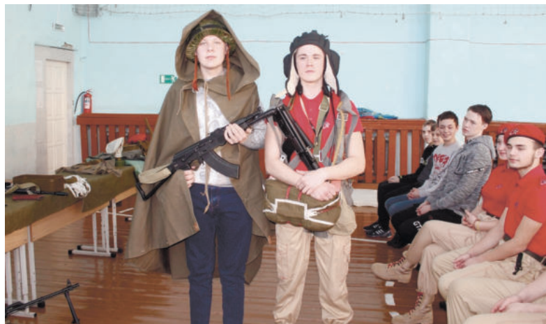
Юнармейцы частенько делятся своим опытом с одноклассниками и младшими школьниками.

Юнармейцы бойко стреляют из пневматических винтовок. Девчонки порой в цели попадают точнее. Еще киргинские соколы ловко собирают и разбирают макеты ав-