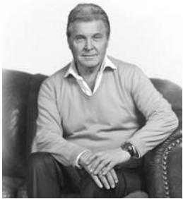
«КАРМАННЫЙ ДОКТОР» помог и мне!

Счастье – это быть здоровым. Вы согласны? Ибо без здоровья нет сил радоваться жизни. И даже для счастья в личной и семейной жизни и успеха в работе нам непременно нужно здоровье. Как обрести его, знают те, у кого есть «КАРМАННЫЙ ДОКТОР», теоретич. настольное волшебство!