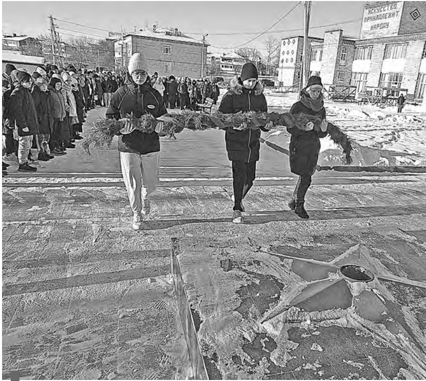
Возложение гирлянды из сосновых веток к обелиску в селе Куры

В День Героев Отечества курьинские школьники торжественно возложили цветы к мемориальным доскам на территории учебного заведения.