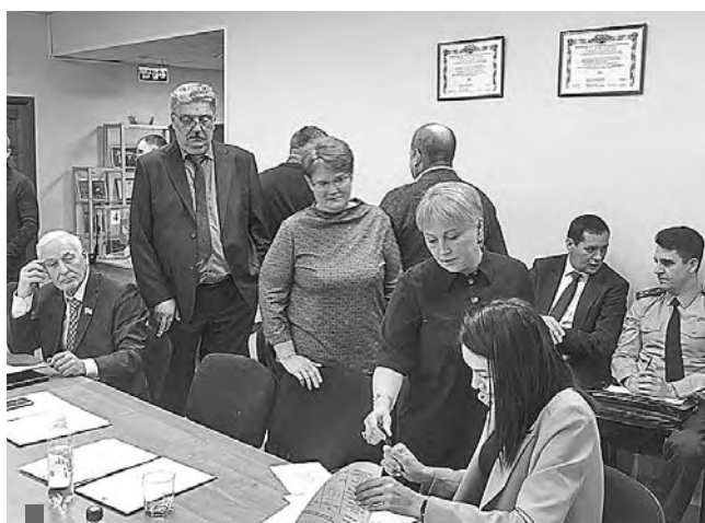
Депутаты получали бюллетени под подпись

Были и другие перспективные кандидаты, но им не хватает компетенции с точки зрения знаний работы муниципалитета. Мы должны были представить таких кандидатов, которые с первого дня своей работы могут решать даже самые сложные задачи.