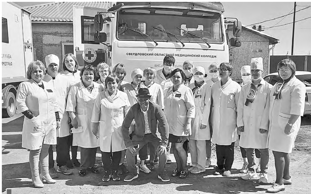
Волонтеры-медики во время акции «#ДоброВСело» в одном из населенных пунктов области

Вместе с преподавателями и фельдшерами студенты-волон-