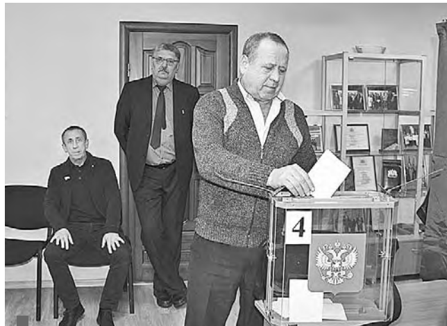
Голосовали тайно в кабинке для голосования

Первый тур голосования результатов не принес: