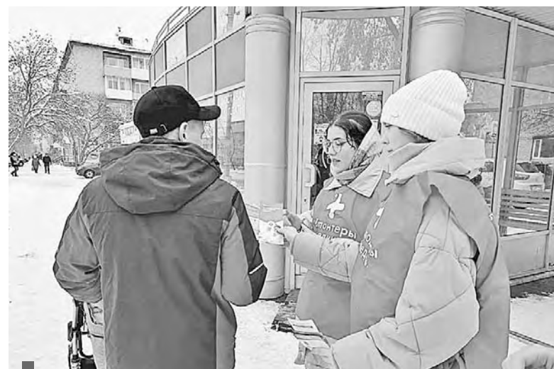
Студенты медколледжа раздают сухоложцам памятки по ЗОЖ

По инициативе Администрации ГО Сухой Лог второй год на сельских территориях проходит социально-творческая акция «Здоровое село». В ее рамках проводится первый этап диспансеризации с обследов-