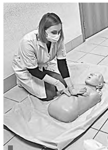
Умение сделать искусственный массаж сердца может пригодиться любому

Совместно с медработниками учащиеся медколледжа присоединились к нескольким акциям: всероссийской «Оберегая сердца» (к Всемирному дню сердца) и «Узнай свой ВИЧ-статус». Подготовили мероприятия и к Всемирному дню борьбы с раком груди.