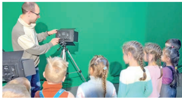
По материалам БелКТВ

Редакция газеты поздравляет коллег-журналистов муниципального телеканала «БелКТВ» с грядущим профессиональным праздником и желает творческих успехов и процветания!