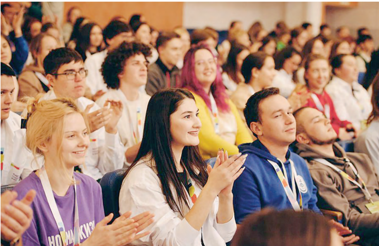
На площадке собралось много активных и талантливых участников