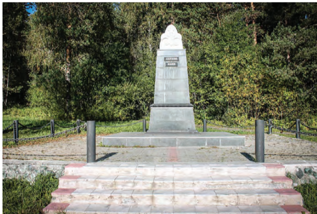
Он же, но уже на новом месте, куда переехал в 2000-е