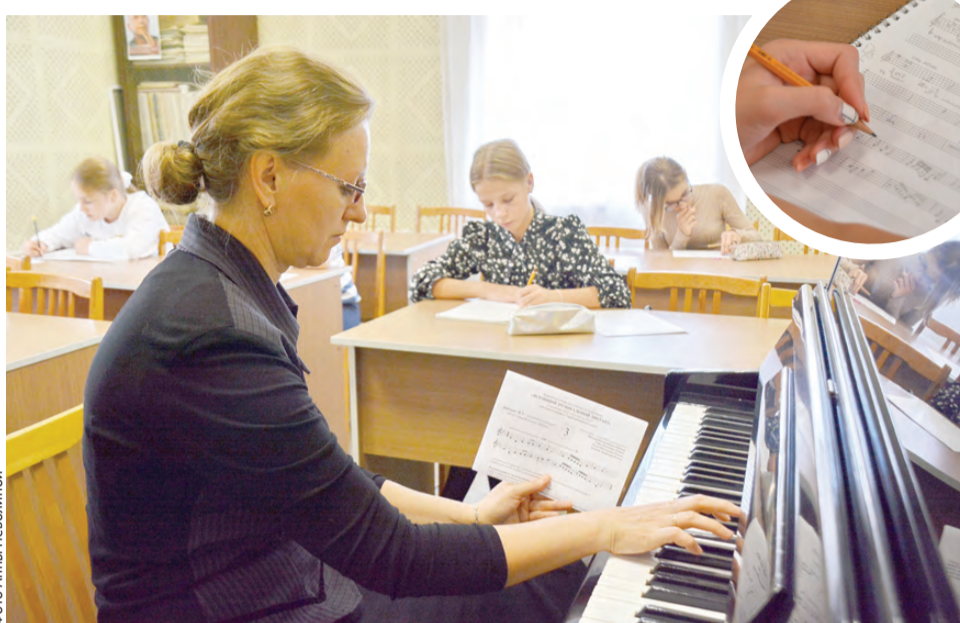
«Играю еще раз». В музыкальном диктанте важно не только слушать, но и услышать

Каждый получил фирменный бланк. Итак, карандаш в руки, стирательная резинка наготове – и слушаем. Кстати, о бланках. На листе с заданием стояло предупреждение авторов: «Абсолютно се-