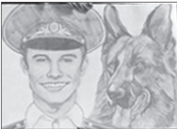
Мы охраняем порядок