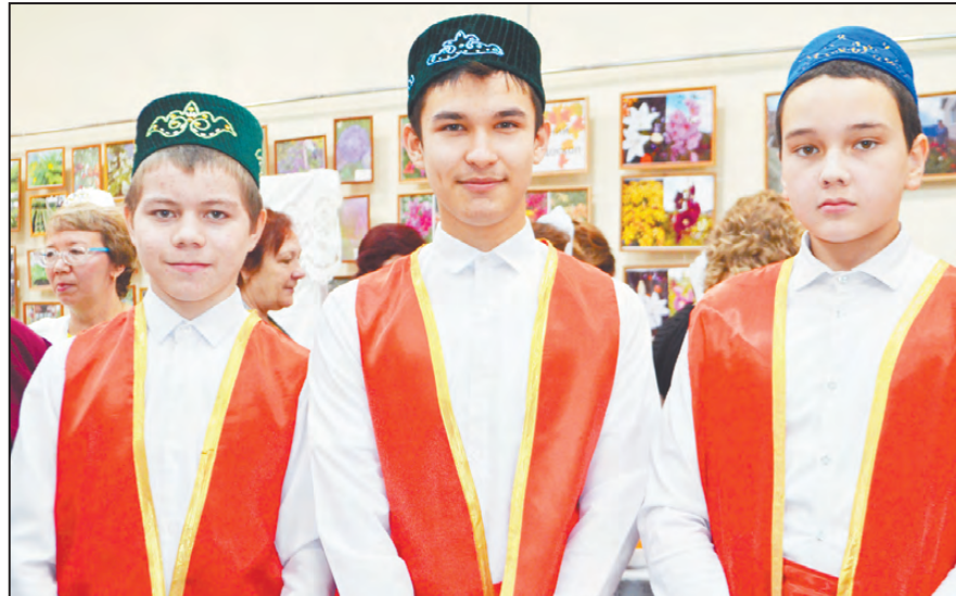
Юные артисты из Азигулово

Муниципальный фестиваль-конкурс национальных культур «Созвездие Урала-2022» был приурочен ко Дню народного единства и прошел в праздничные дни в районном Доме культуры.