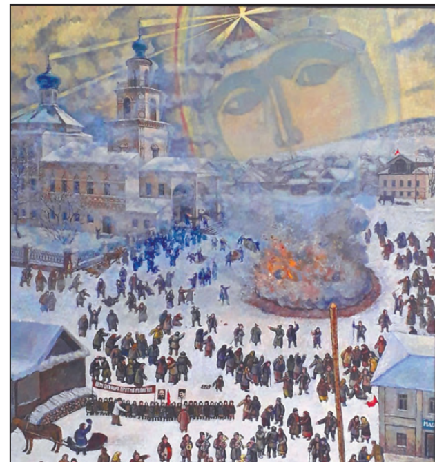
Картина «Развал храма»