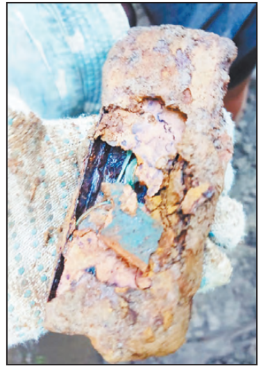
Металлический футляр с очками