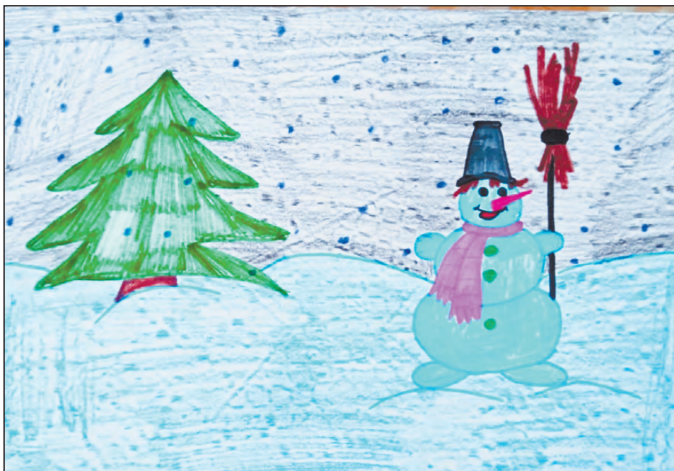
Тимур Ахметшин, 4 года