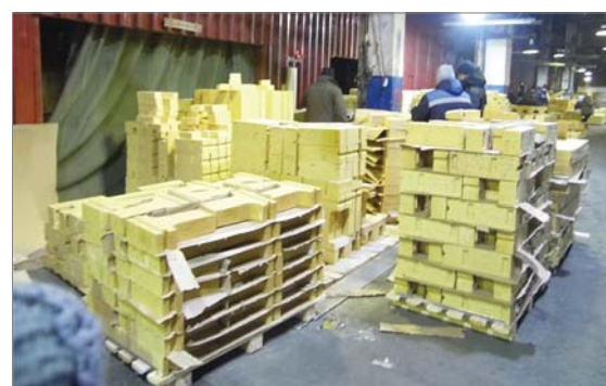
На сортировке цеха №2 – большие объёмы. На помощь пришла вся смена с участка КГИ.