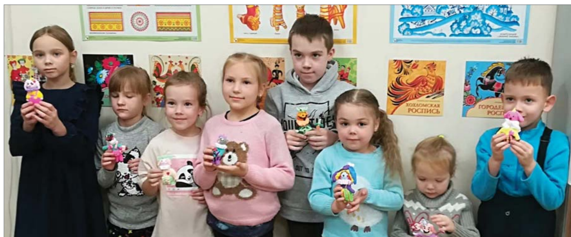
Маленькие участники мастер-класса.