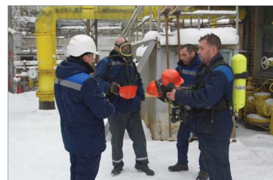
В условиях учебной тревоги газовщики энергоцеха проявили профессионализм.