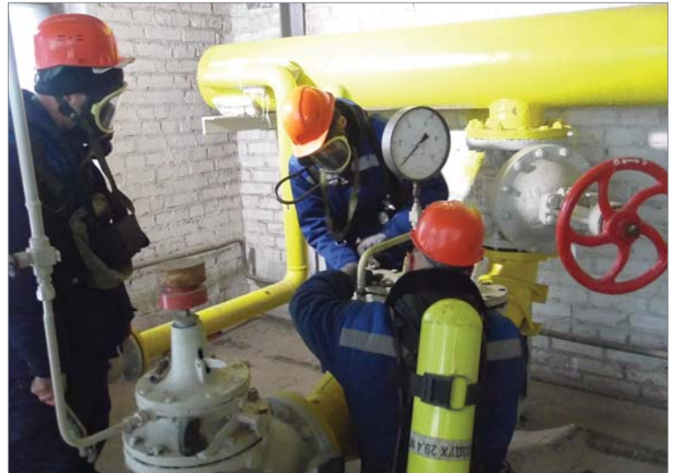
Причина аварии определена, задача – быстро устранить.

устранения утечки газа. Все трое тут же приступили к ремонту.