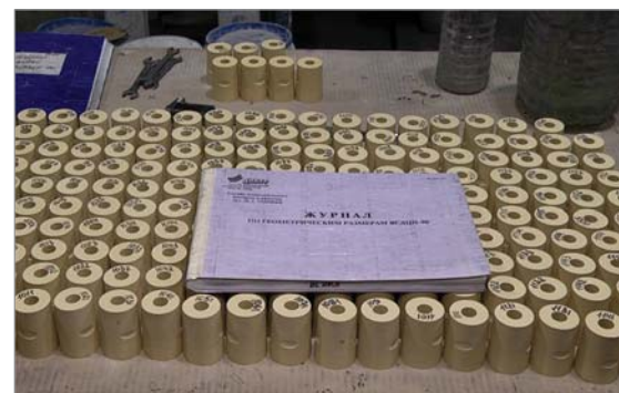
Декабрь станет рекордным по выпуску стаканов CNC на участке БМО цеха №1.