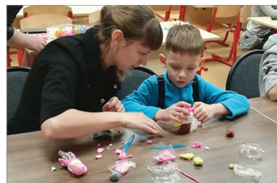
Два мастер-класса для заводчан и их детей впервые прошли в художественной школе.