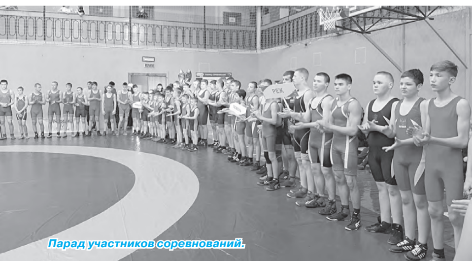
Парад участников соревнований.