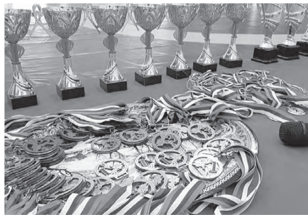
В каждой весовой категории были определены победители. Режевляне достойно выступили на своих коврах.