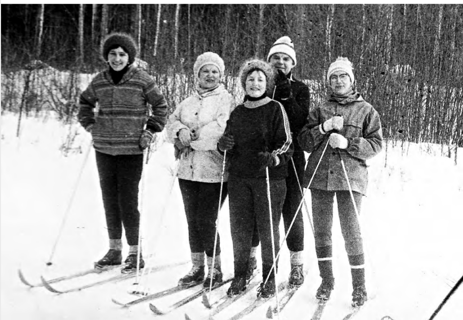
Выходные подруги вместе с родными проводили на лыжне.

«Нет больше радости, чем видеть друзей, нет горше горя, чем разлука с друзьями», - сказал восточный поэт Рудаки.