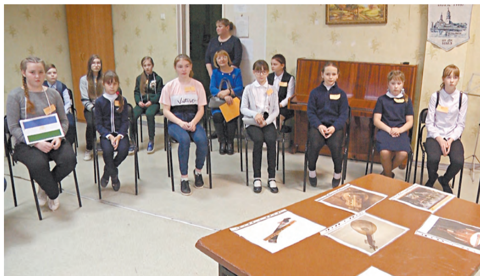
Надо угадать, какой народный инструмент прозвучал.