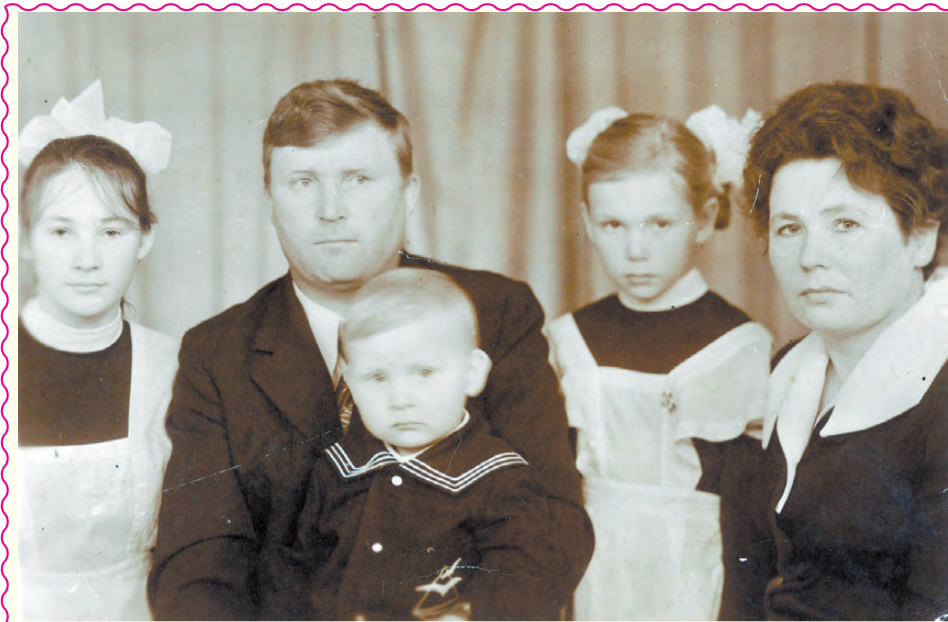
А книги семейной жизни открыли 60-ю страницу.

Ах, как быстро наши годы мчатся: Только что с уроков убежали, Только что влюблялись первый раз, Только что детишек вы качали, Их вы провожали в первый класс... Ничего почти не изменилось, Только ночи стали чуть длинней, Только сердце чуть угомонилось, Только жизнь узнали до корней. Мы здоровья крепкого желаем, Новых замыслов и планов через край! Вы сидеть без дел не будете, мы знаем, Но, пожалуйста, почаще отдыхайте.