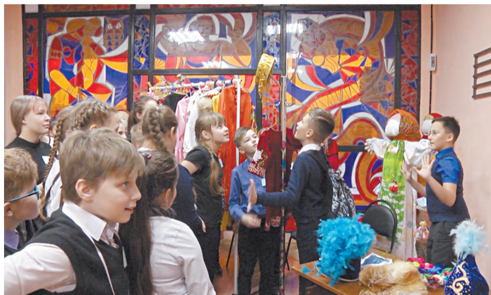
На станции «Костюмерная» – изобилие нарядных национальных костюмов и головных уборов.