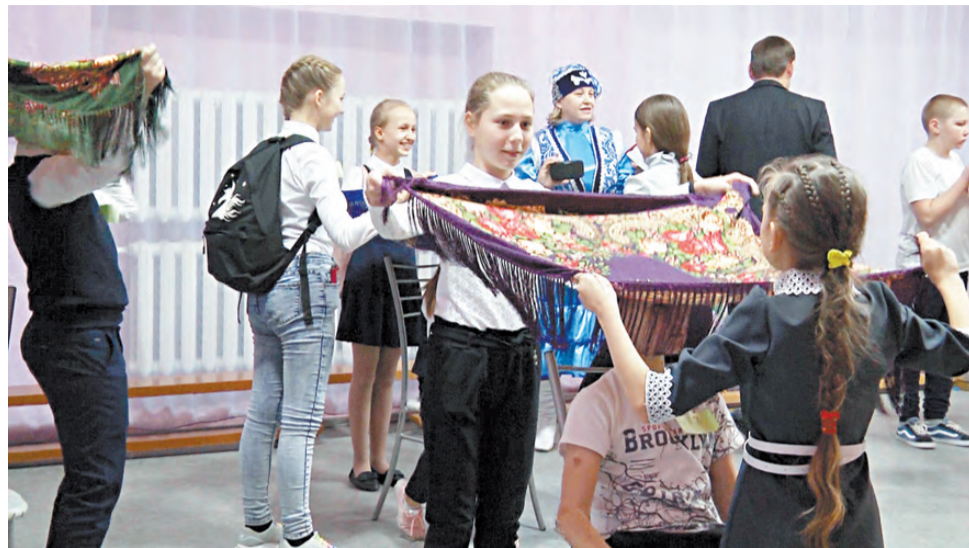
Башкирская игра «Юрта».