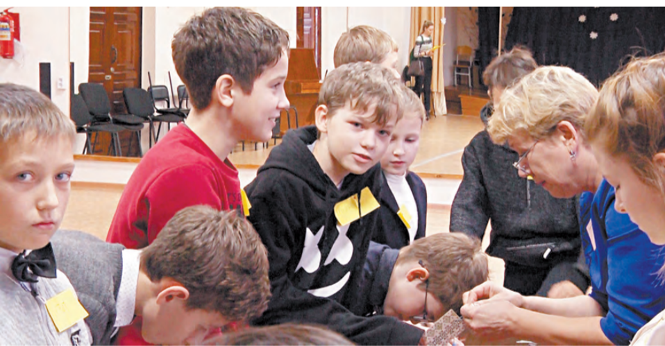
Ребята своими руками изготавливали национальные орнаменты.