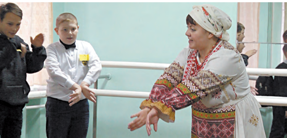
Разучивают характерные па татарского танца.