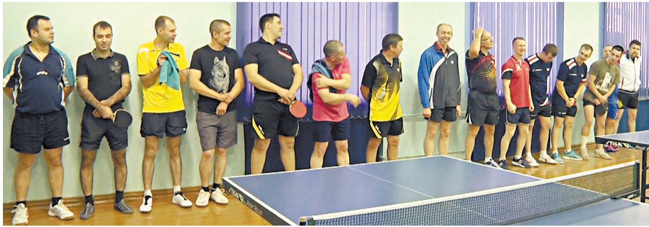
Команды двух городов.