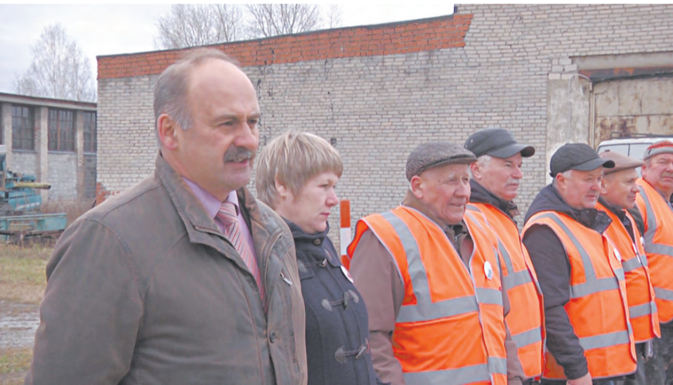
Судейскую коллегию возглавил П. М. Саввулиди.

Вадим МЕЛЬНИКОВ.