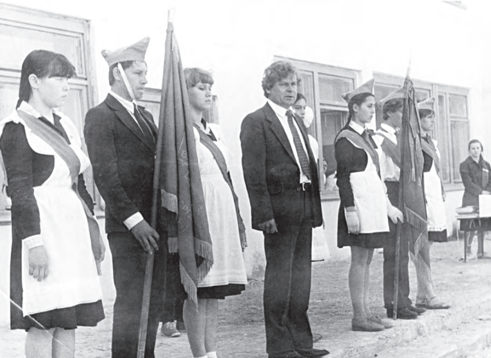
На торжественном мероприятии.