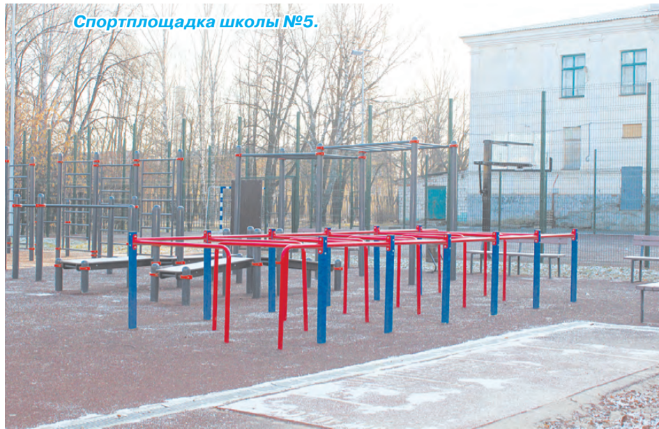
Спортплощадка школы №5.

в эксплуатацию в 2018 году) не соответствуют СанПиНу и требуют реконструкции. К сожалению, запланированные мероприятия по строительству спортивной площадки в школе №44 в 2019 году не удалось реализовать, несмотря на то, что наш объект был включен в программу министерства спорта Свердловской области. В 2020 году планируем продолжить работу, но уже в рамках программы министерства образования и молодежной политики Свердловской области.