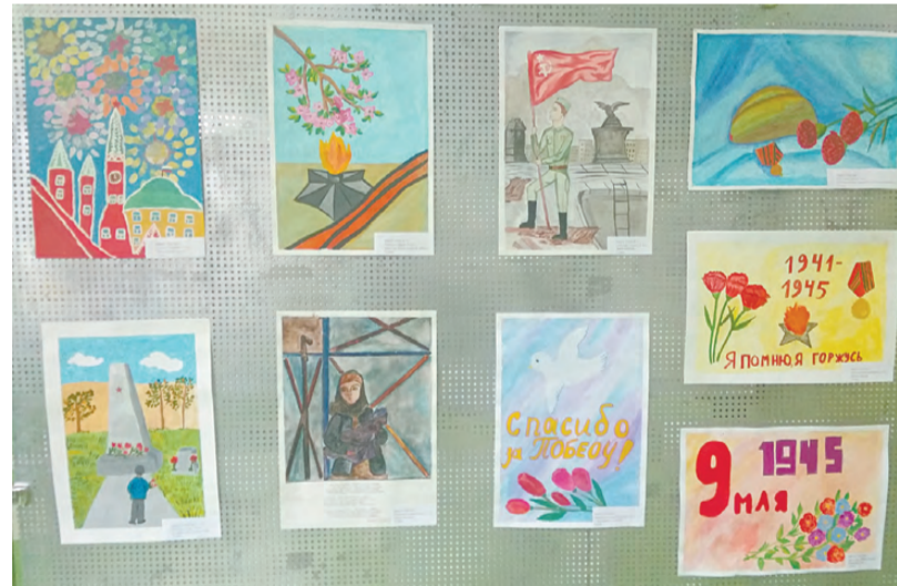
Районная выставка рисунков «Великая Победа» в школе №2.