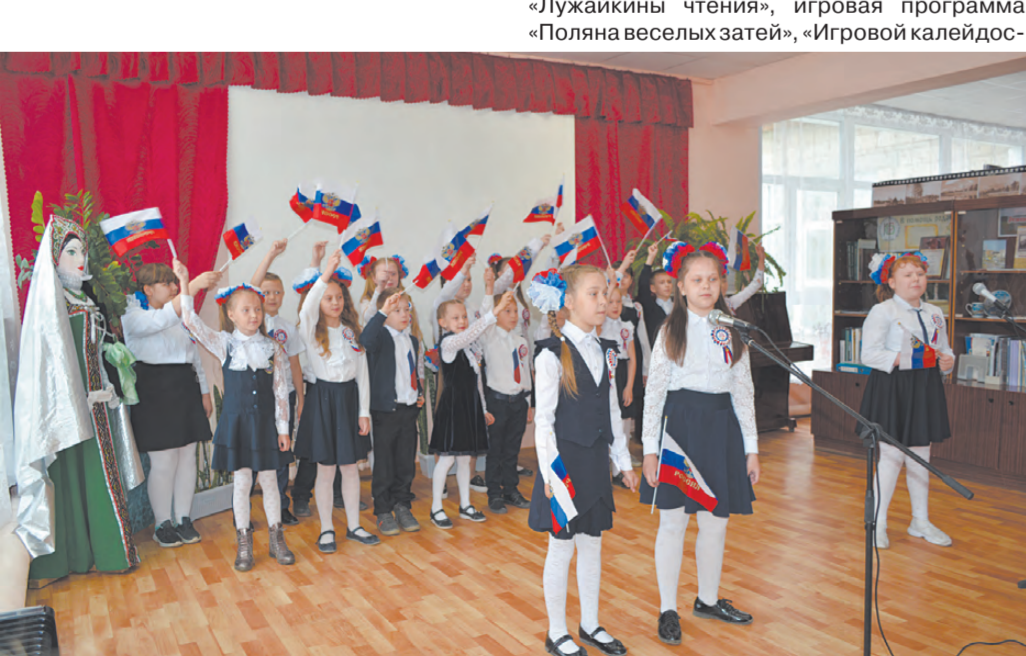
Здесь проходит множество интересных мероприятий.