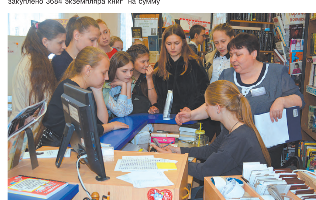
Библиотекари могут порекомендовать самые интересные книги.