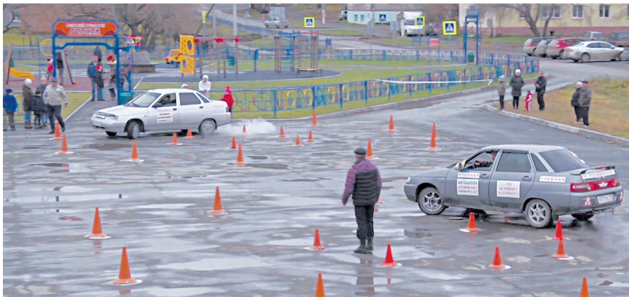
Водители выполняют задание «круг».

Вадим МЕЛЬНИКОВ.