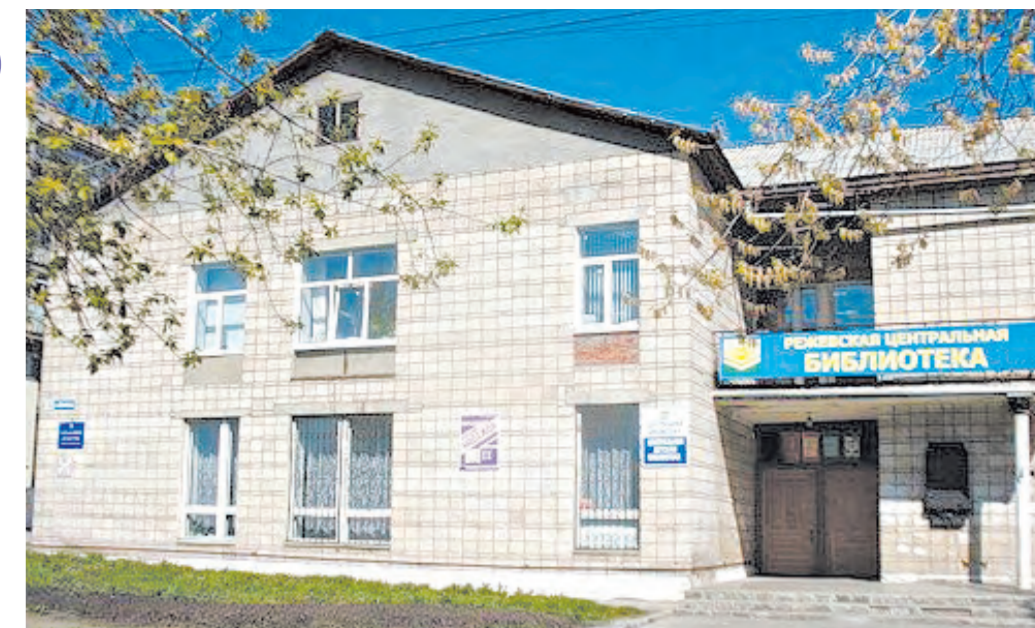
Библиотека - центр притяжения любителей чтения.

- Организация и проведение школьного и районного этапов всероссийского конкурса