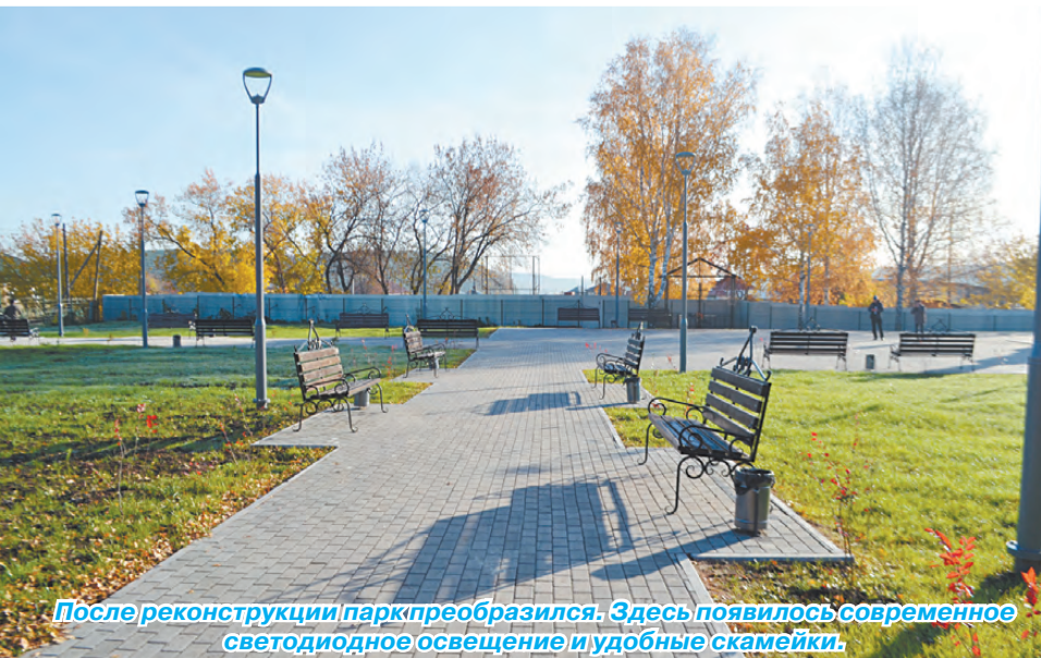
После реконструкции парк преобразился. Здесь появилось современное светодиодное освещение и удобные скамейки.