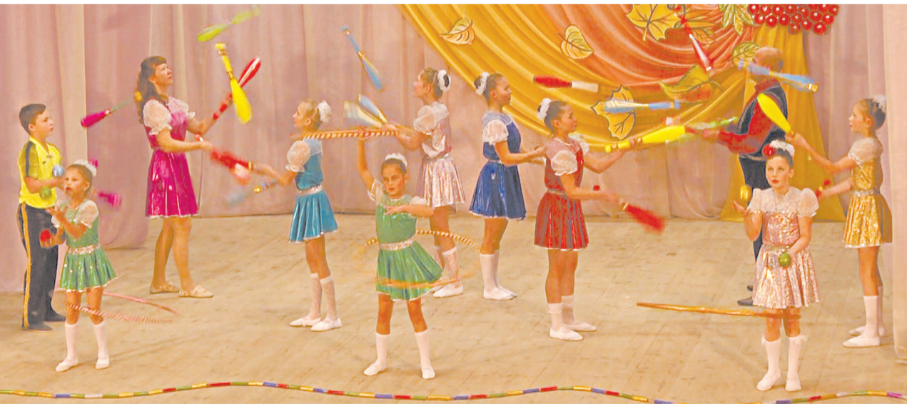
Артисты цирковой студии Глинского ДК продемонстрировали удивительное мастерство.