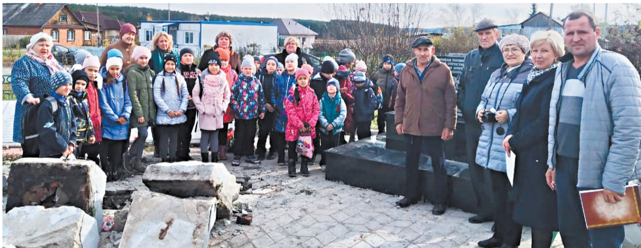
Останинцы отправили послание потомкам.