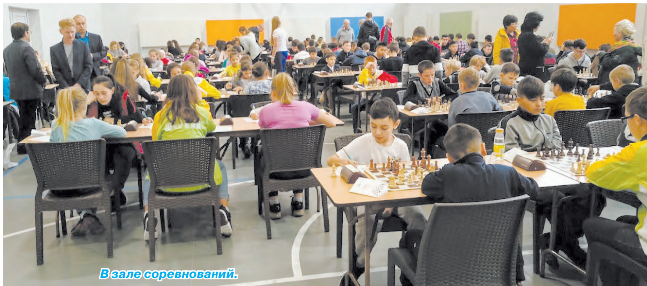
В зале соревнований.