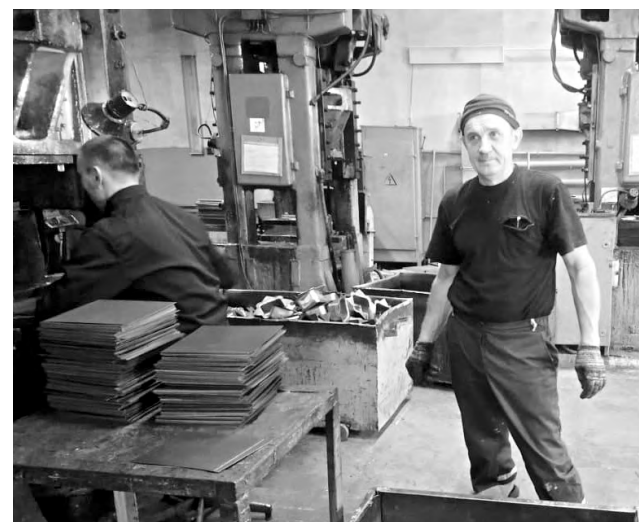
А. Г. Королёв.