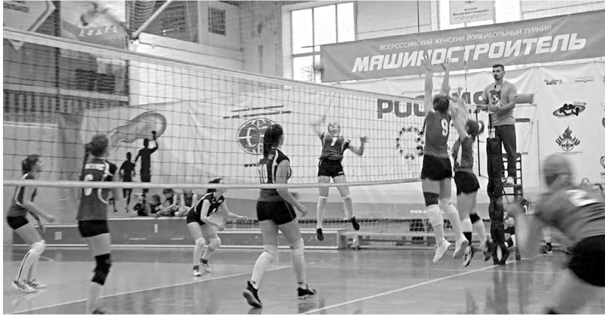
В борьбе за победу.