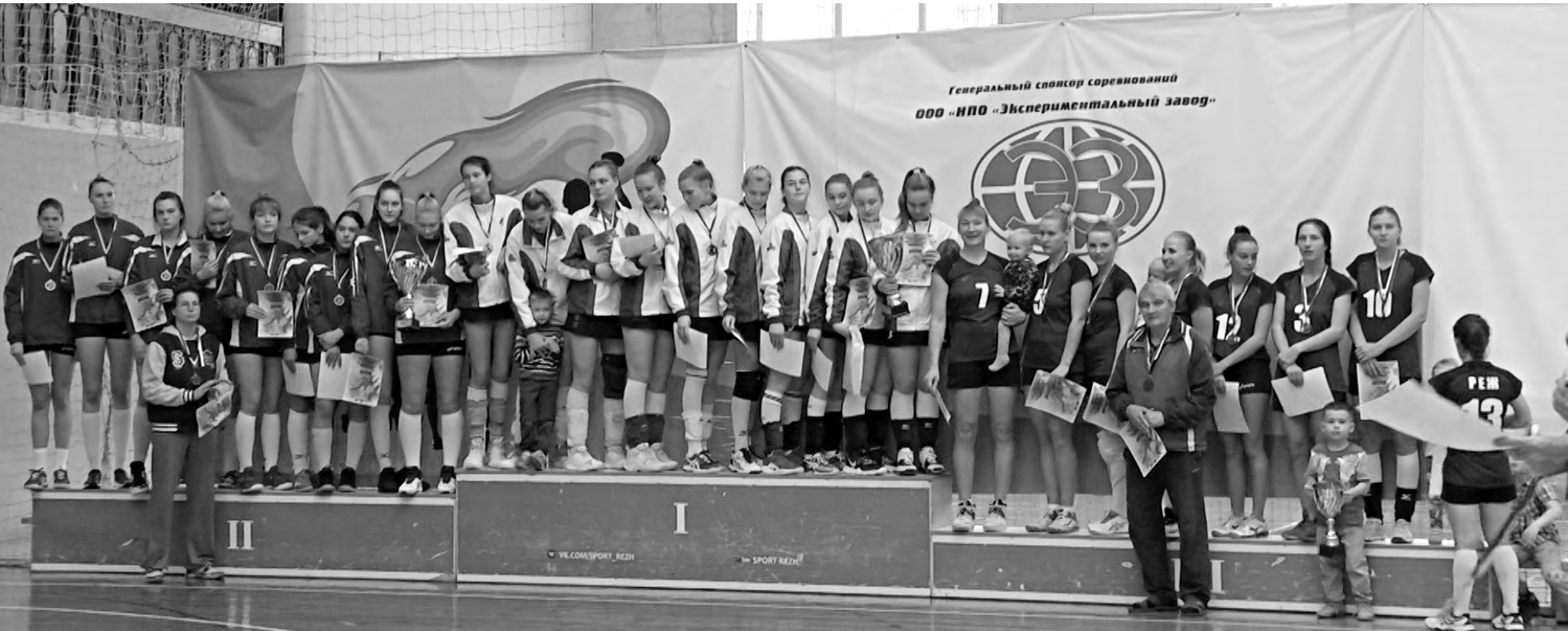
Пьедестал почёта заняли сильнейшие волейбольные команды.