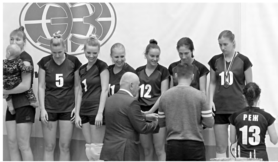
Режевская команда «Россиянка» заняла в областном турнире по волейболу III место.