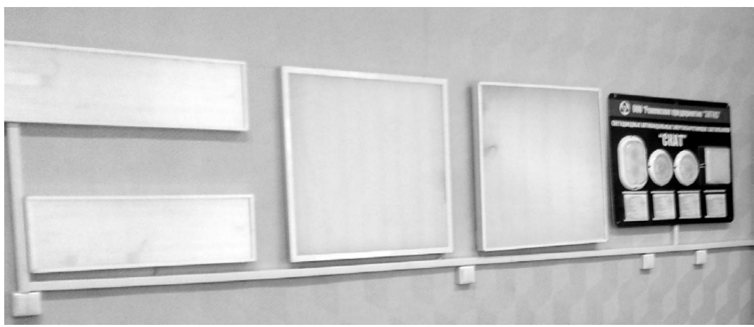
Образцы продукции предприятия «ЭЛТИЗ».

Людмила НИКОНОВА.