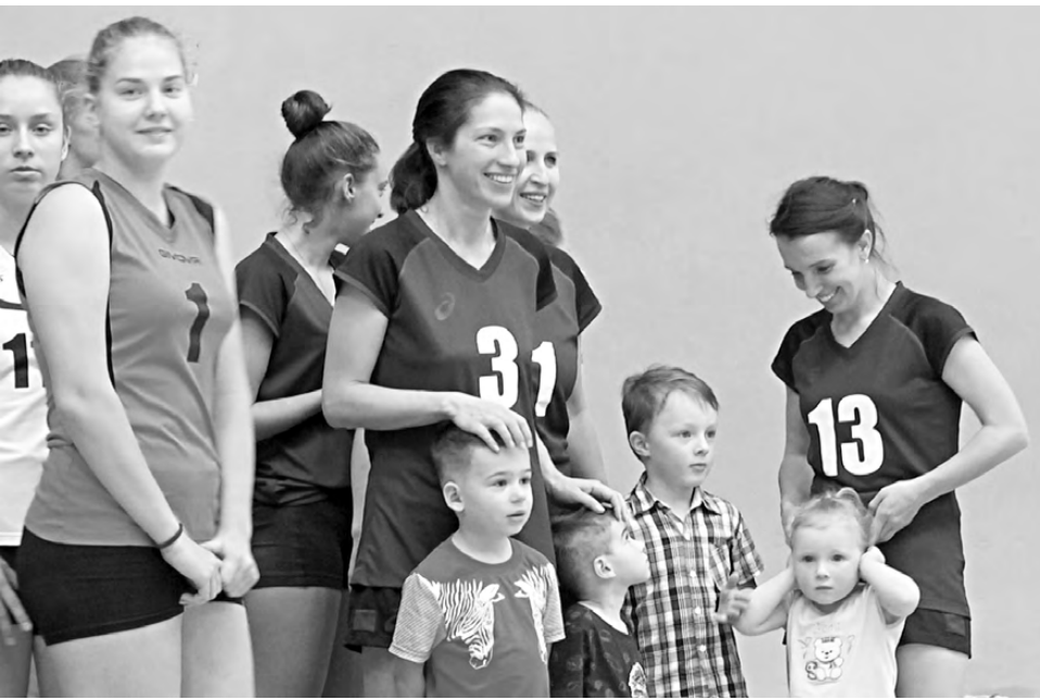
«Россиянка» перед началом соревнований.

22 сентября в ДЮСШ «Россия» завершился 25-й юбилейный турнир по волейболу среди женских команд, посвящённый Дню машиностроителя.