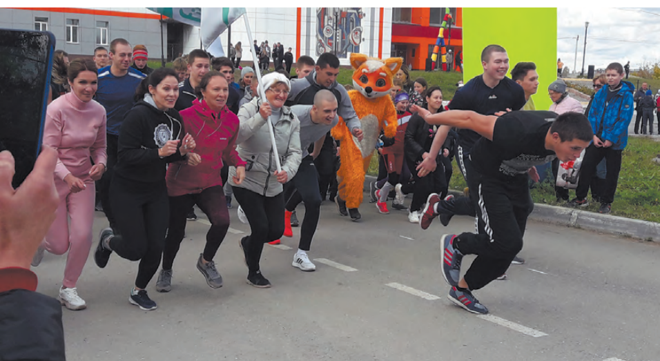
Забег на 2019 метров.