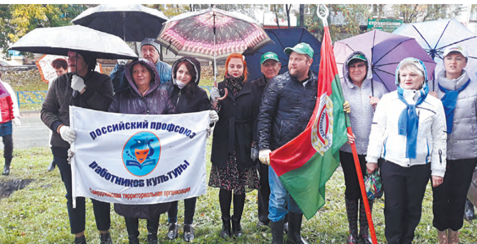
Профсоюзные активисты Режевского городского округа провели экологическую акцию с целью озеленения родного города.