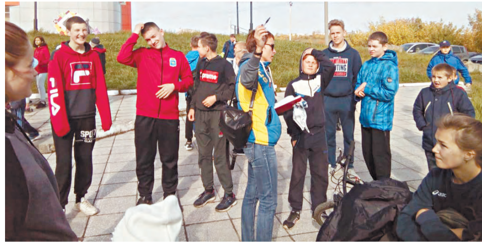
Инструктаж перед стартом.