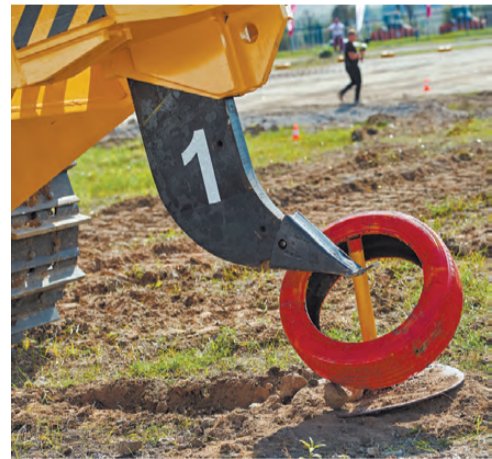
Это задание – поднять с земли зубом рыхлителя кольцо и надеть его на стержень – не всем удавалось с первого раза.