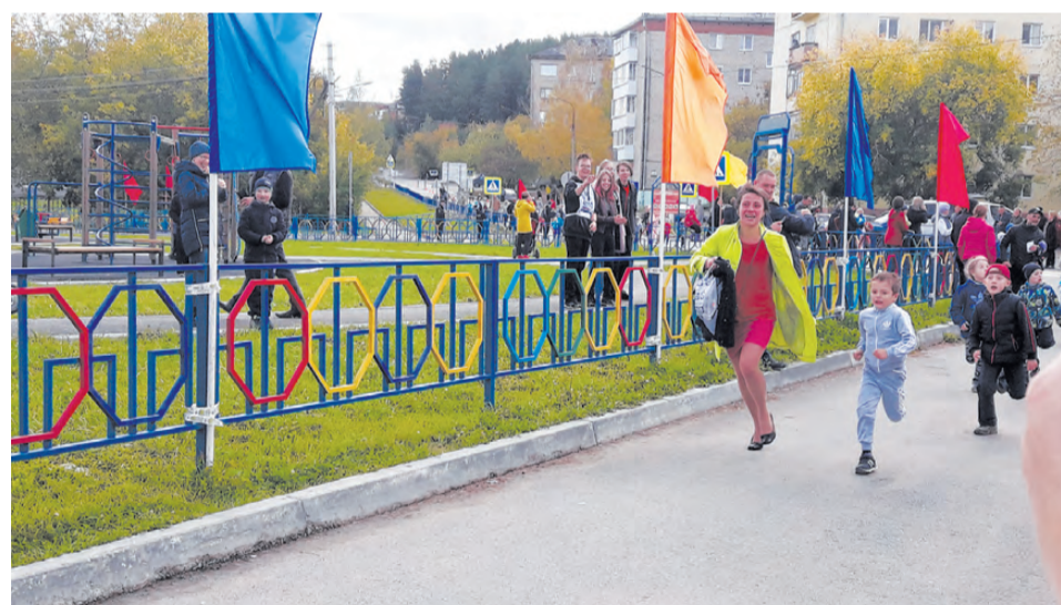
Родители поддерживали юных спортсменов на протяжении всей дистанции.