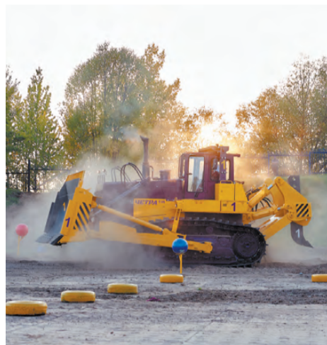
Ножом бульдозера надо было снять мяч, не сбив стойку.