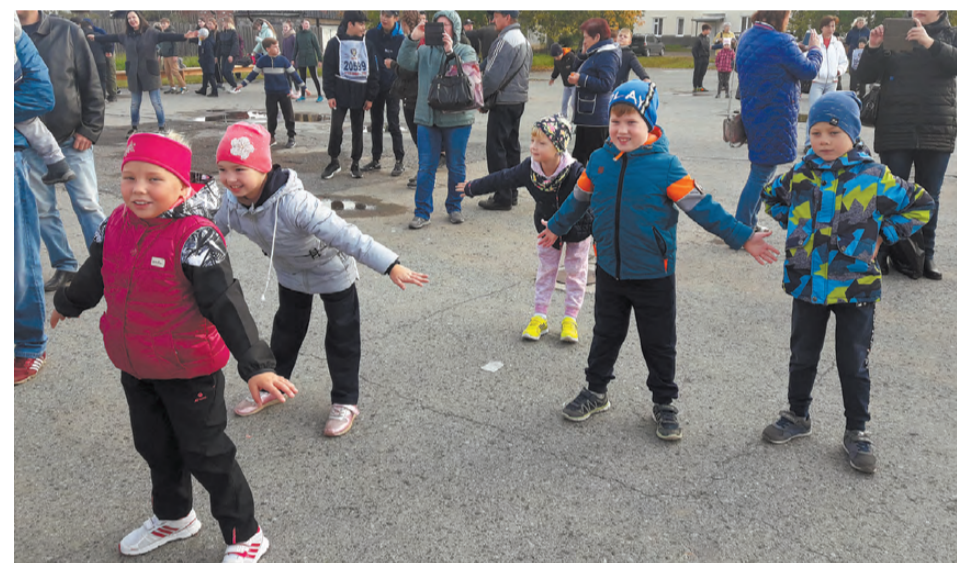
Зарядка – разминка перед забегом.