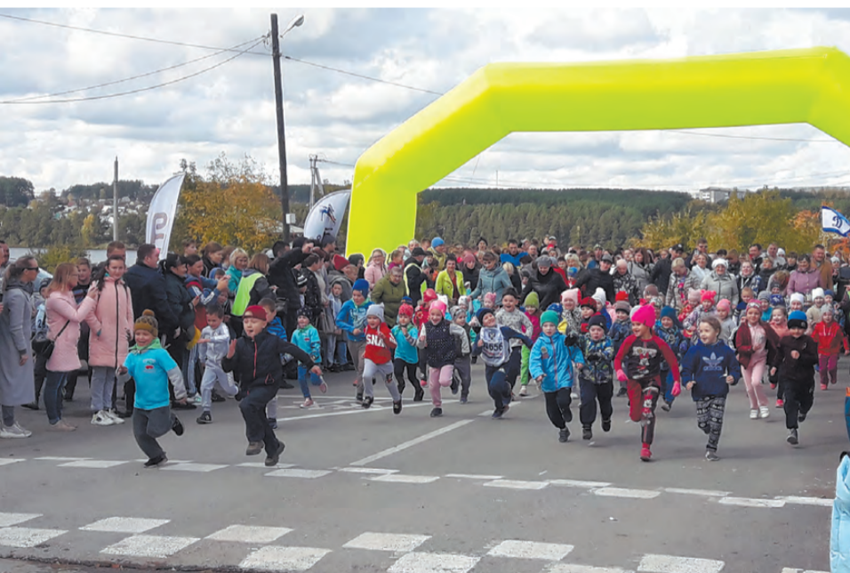
На старте – самые юные участники «Кросса нации – 2019».