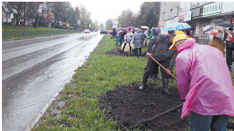
Кипит работа: на улице Ленина обустривают «Аллею труда».