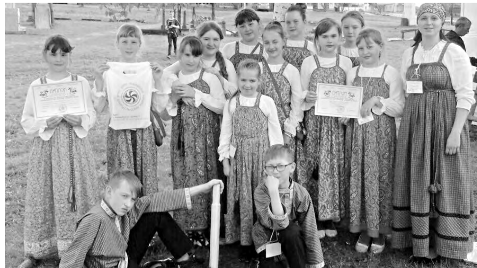
Фольклорный ансамбль «Каравай» - лауреат многих вокальных конкурсов и фестивалей.