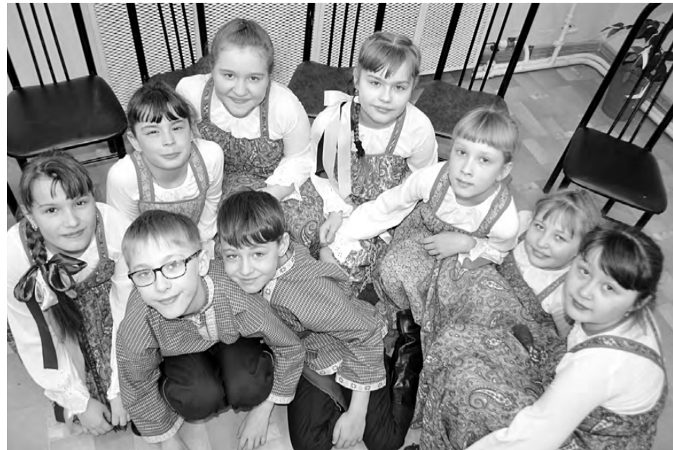
Дети с удовольствием приобщаются к русской народно-традиционной культуре.