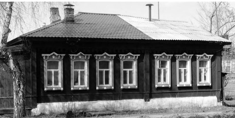
Дом А. А. Пузанова в наши дни.

Н. МЕДВЕДЕВА, Режевское историко-родословное общество.