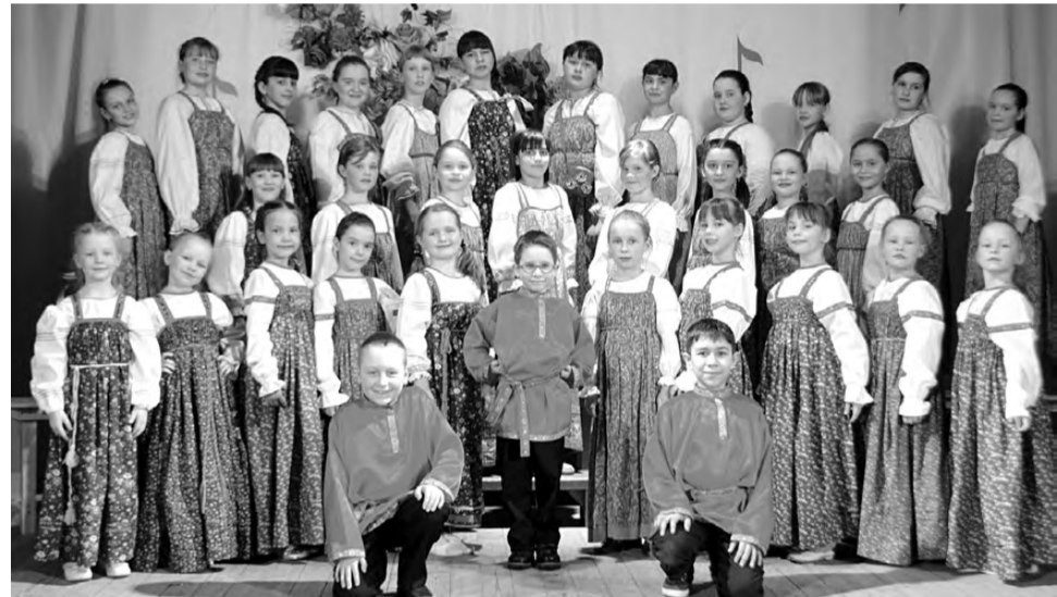
Выступает фольклорный ансамбль «Каравай».