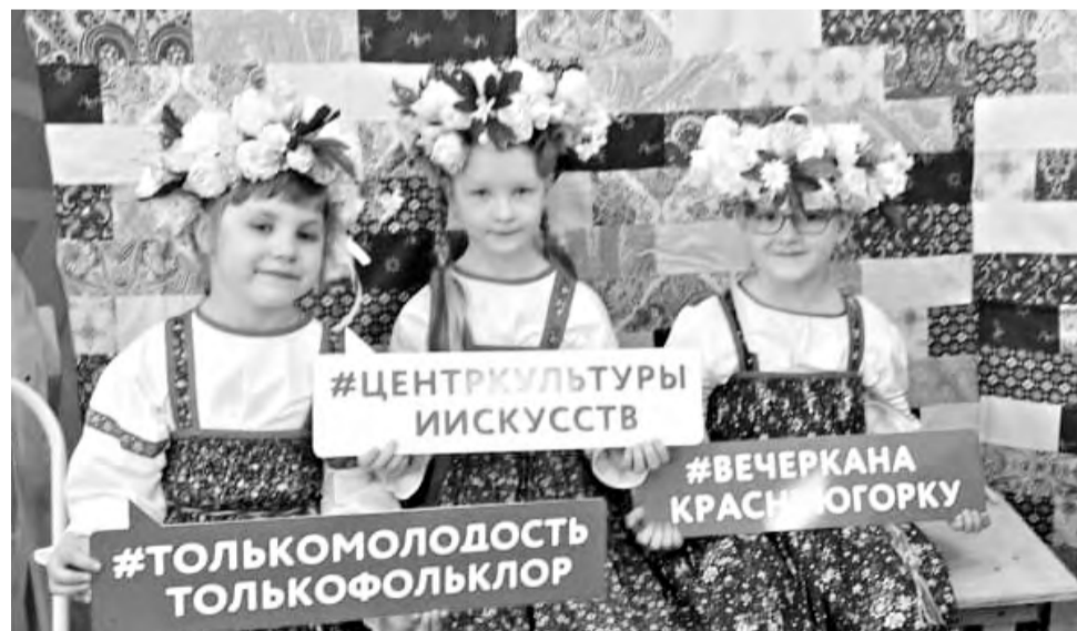
Вечёрка на Красную горку.