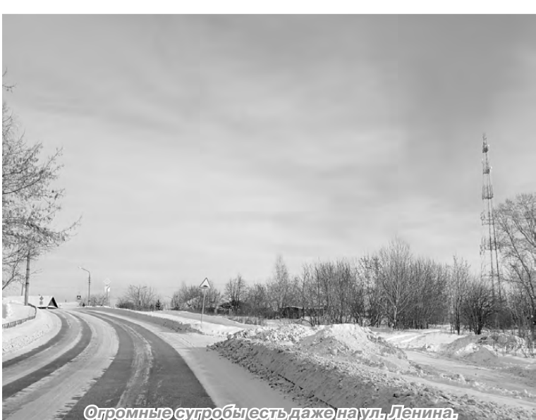
Огромные сугробы есть даже на ул. Ленина.