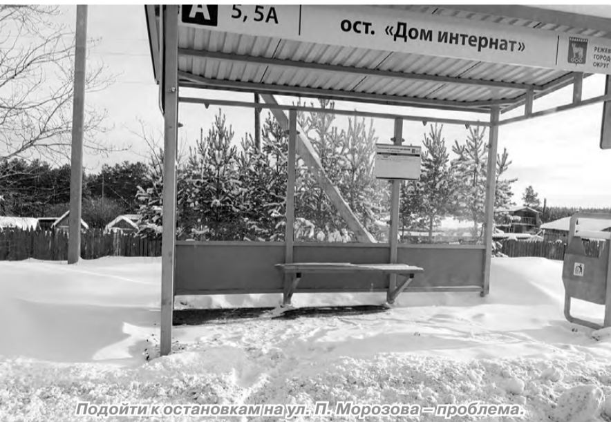
Подойти к остановкам на ул. П. Морозова — проблема.