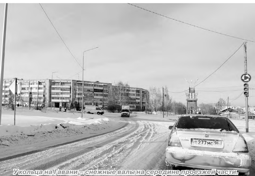
Уколыца на Гавани — снежные валы на середине проезжей части.