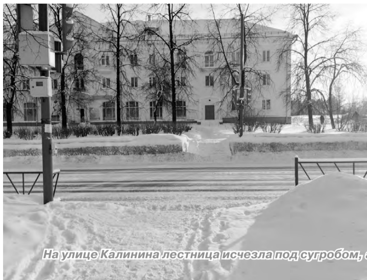
На улице Калинина лестница исчезла под сугробом, а тротуары в пер. Школьном превратились в тропы.

Что такое ровная дорога на ул. Краснофлотцев, наверное, уже не вспомнить, да и весь микрорайон Привокзальный заметён снегом. Пешеходная дорожка, ведущая через железнодорожные пути от посёлка Завокзальный, превратилась в узкую тропу, которая упирается в нерасчищенный пешеходный переход. Он ведёт через дорогу, на