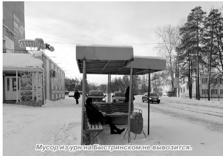
Мусор из урн на Быстринском не вывозится.