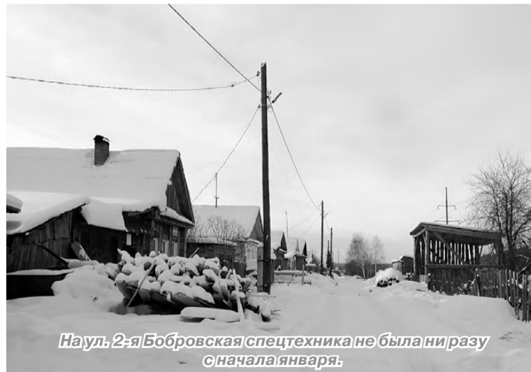
На ул. 2-я Бобровская спецтехника не была ни разу с начала января.