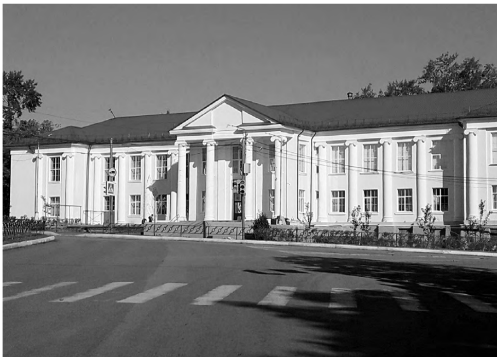
Центр культуры и искусств – знаковый объект, фасад которого реконструируется в этом году за счёт средств АО «Сафьяновская медь».

- В АО «Сафьяновская медь» действует коллективный трудовой договор, где