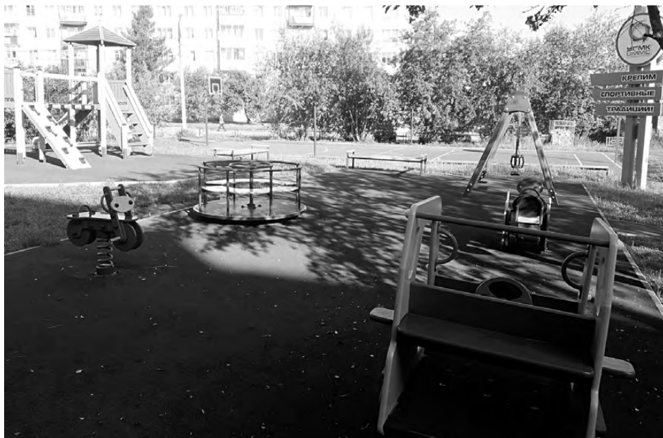
Детский городок во дворе дома по ул. Заводская, 3.