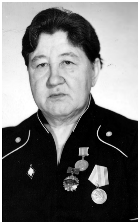
она проработала инспектором в горно, а с 1960 года в течение 23 лет работала