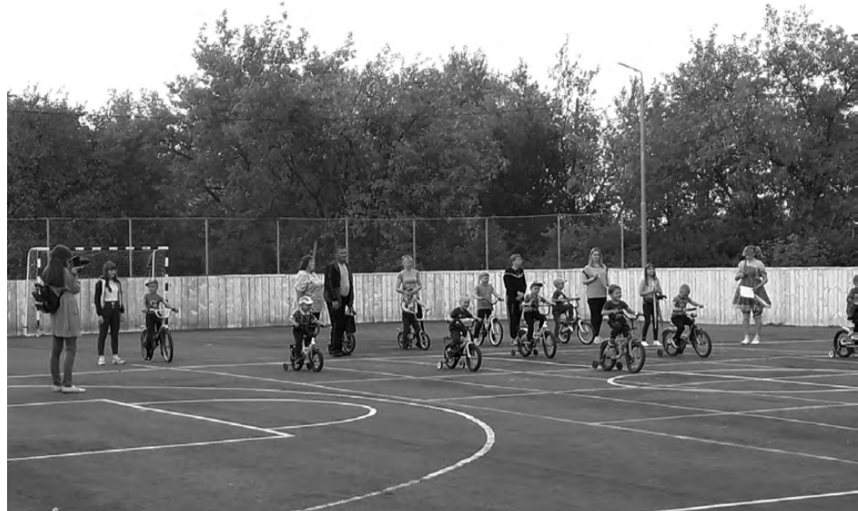
Юные велосипедисты Липовского посостязались между собой в мастерстве управления «железным конём».