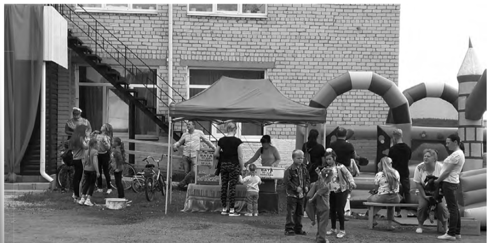
День села – радостное событие для всех липовчан.

Основное занятие сельчан в XIX - начале XX века было хлебопашество и отхожие заработки.