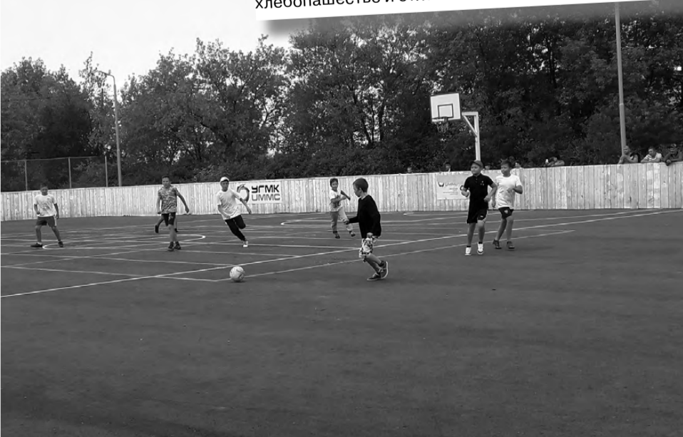
В рамках празднования Дня села прошли соревнования по мини-футболу.