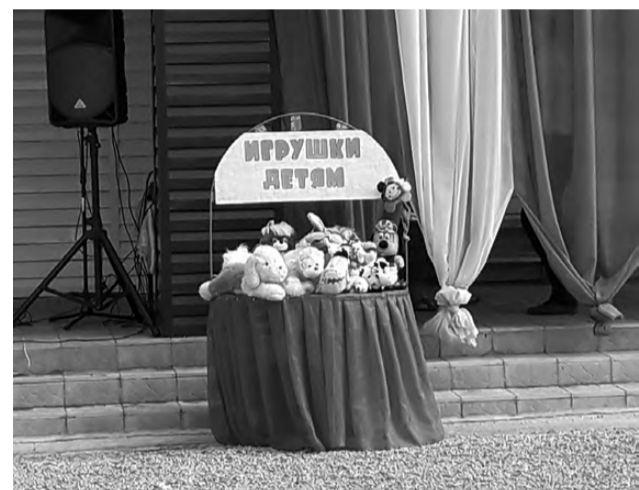
На празднике дети могли выбрать понравившиеся игрушки и унести их домой.