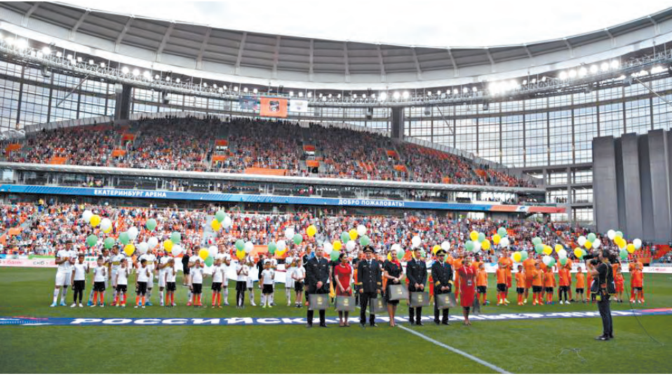
Экипажу лайнера «Уральских авиалиний» вся «Екатеринбург Арена» аплодировала стоя.