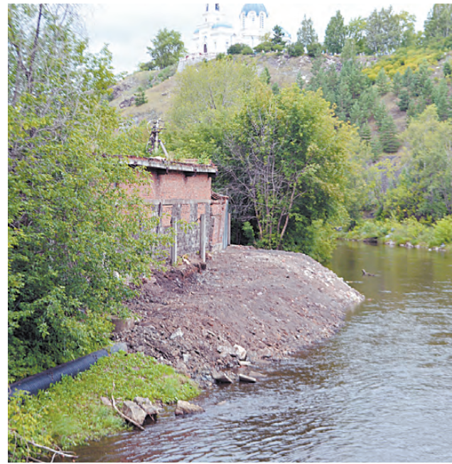
Отремонтированный коллектор не допустит утечки нечистот.

ная стена и лестница рядом с домом по ул. Фрунзе, 19, а вскоре начнутся работы на улице Спортивной, 2. Здесь приведут в порядок стену муниципального гаража, состояние которой давно оставляет желать лучшего.