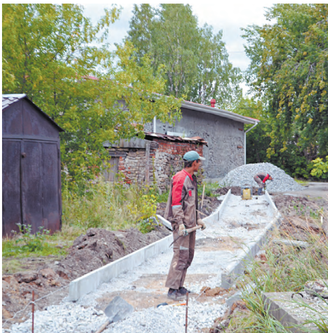
К детскому саду «Искорка» приведёт долгожданный тротуар.