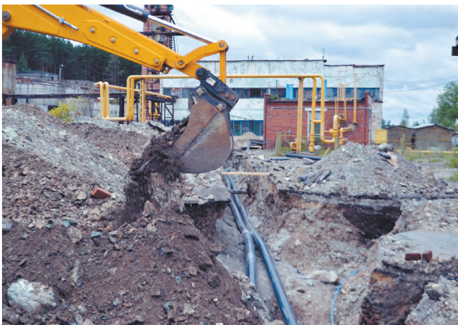
Участок водопровода вынесли с частной территории.