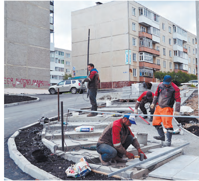
Жители уже успели оценить качество ремонта дворового проезда.

Компания ООО «МАЛИНА» выполнит на Семи ветрах ремонт ещё двух объектов. Уже восстановлены опор-