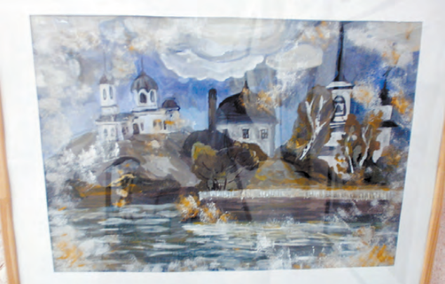
«Город Реж в прошлом». Часть триптиха. Никита Саубанов, 14 лет.