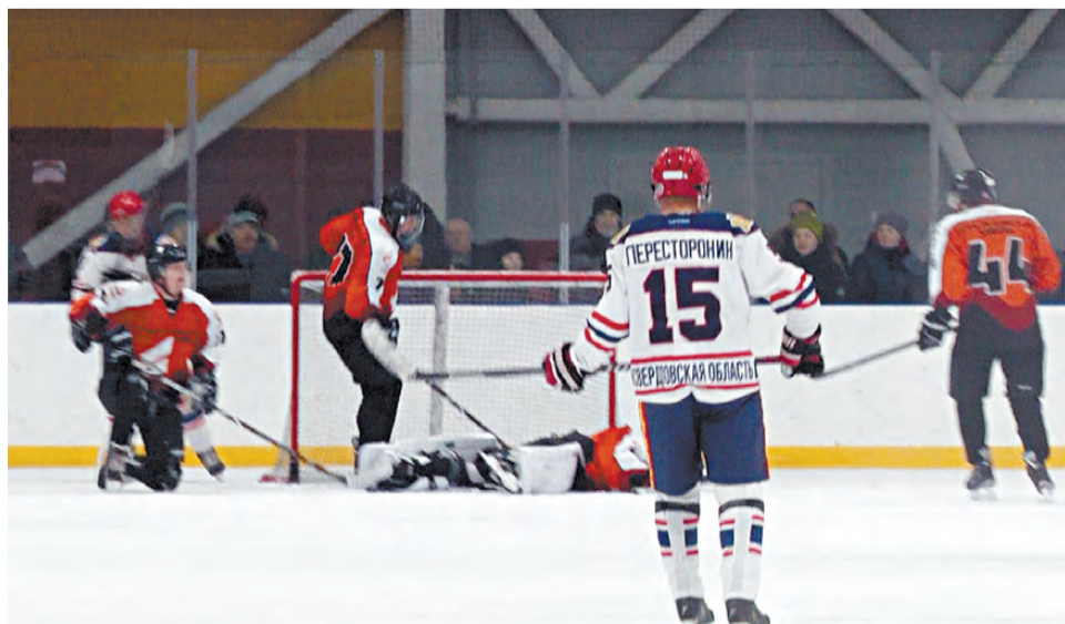
Режевляне активно боролись за победу, но соперник оказался сильнее.