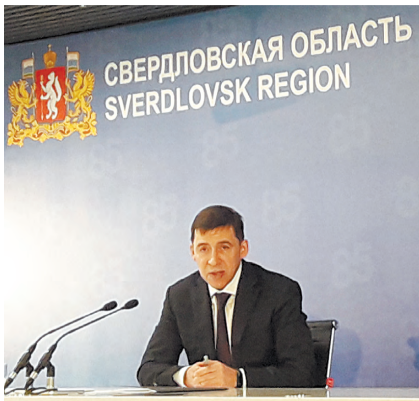
Губернатор Свердловской области Е. В. Куйвашев во время традиционной ежегодной пресс-конференции ответил на вопросы журналистов.

- Вы знаете, тема известная. В ходе своих поездок по региону, встречаясь с людьми, обсуждая вопросы здравоохранения, вопрос нехватки врачей, безусловно, люди ставят. Но вместе с тем мы в нашей программе «Пятилетка развития», в наших государственных программах предусмотрели серьёзные средства для закрепления специалистов в малых городах и сёлах нашего региона. Мы сегодня выделяем жилищные сертификаты. Причём, заметьте, выделяем сертификаты не только врачам, но и среднему медицинскому персоналу, фельдшерам, медсёстрам для закрепления их на той или иной территории. Мы сегодня увеличили дополнительный набор в медицинский вуз для целевиков. Кол-