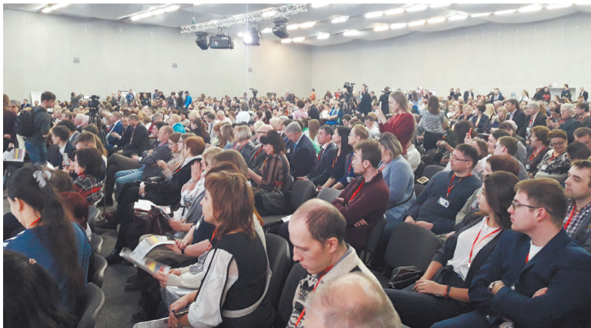
1082 участника зарегистрировались на Гражданский форум, который прошёл на площадке «Екатеринбург-ЭКСПО».