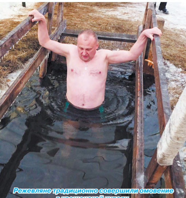
Режевляне традиционно совершили омовение в крещенской купели.

В ночь с 18 на 19 января в Режевском районе работали две крещенские купели – на территории зоны отдыха «Нептун», а также в посёлке Липовка. Перед мероприятиями купели должным образом были проверены.