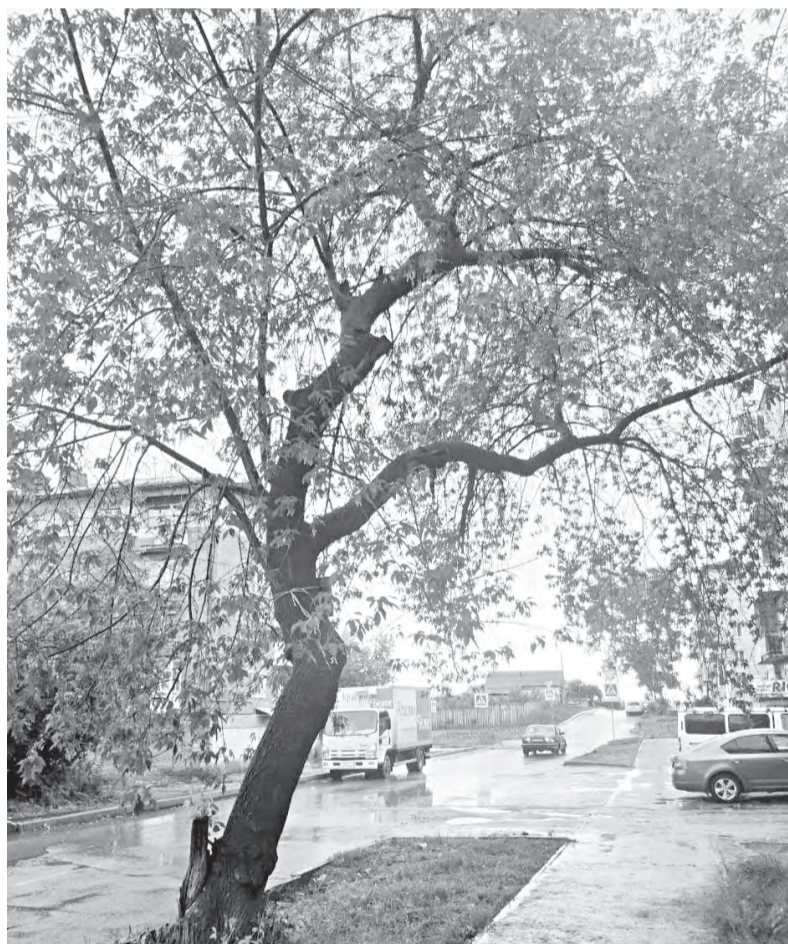
На снимке видны повреждения клёна и места сломов сухих веток.