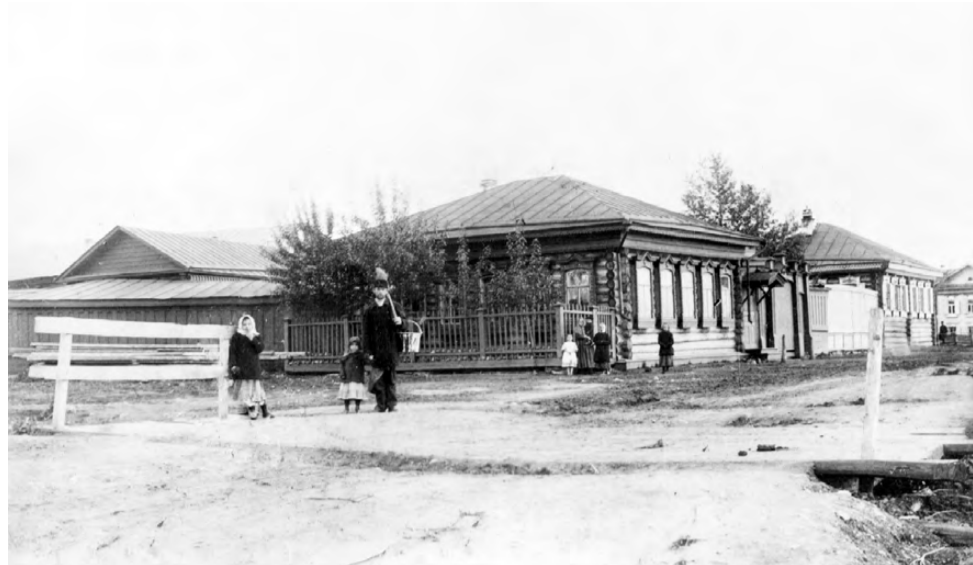
Мост через ручей Красный в районе ул. Набережной (ныне Костоусова). На заднем плане – дома Ушаковых и Сергеевых. Ныне снесены. 1910-е гг.

Неузнаваемо изменился и сам водоем. Конечно, много лет он сильно подвергался хозяйственной деятельности человека, поскольку оказался в гуще застройки. Давно уже нет вокруг него леса – одного из важнейших факторов, определяющих уровень воды. Выпас скота, складирование мусора, обустройство территории ар-