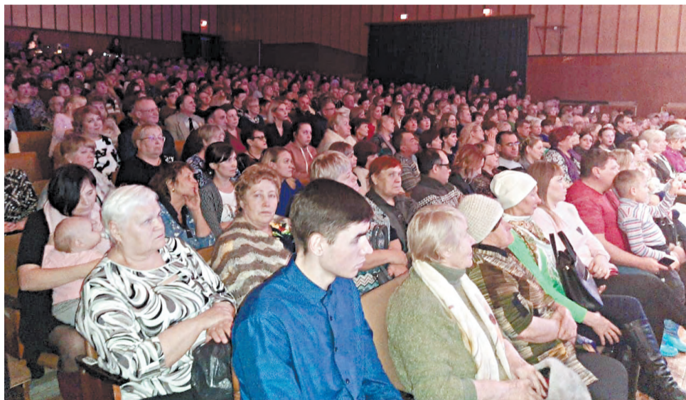
В зале – аншлаги.