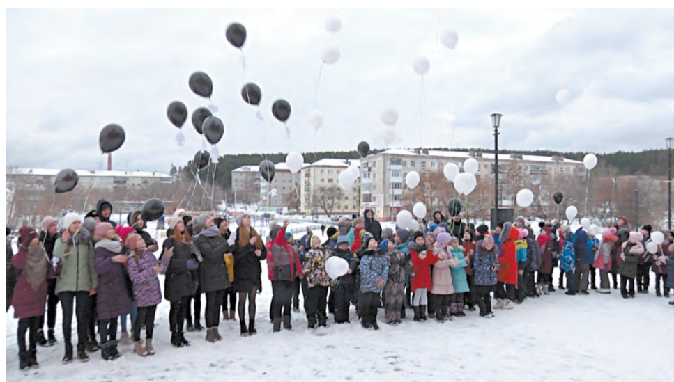
В память о жертвах ДТП школьники отпустили в небо шары с фигурками ангелов.