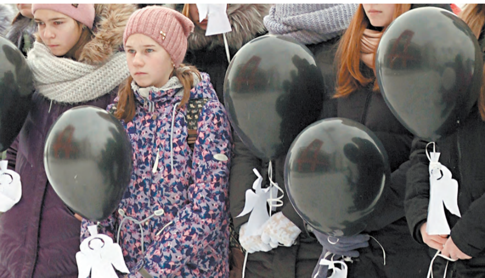
Цифры статистики заставляют серьезно задуматься о том, как важно заботиться о безопасности на дорогах.

В ноябре отмечается Всемирный день памяти жертв дорожно-транспортных происшествий. В Реже мероприятие для школьников, посвященное этому дню, прошло у Дворца культуры «Металлург».