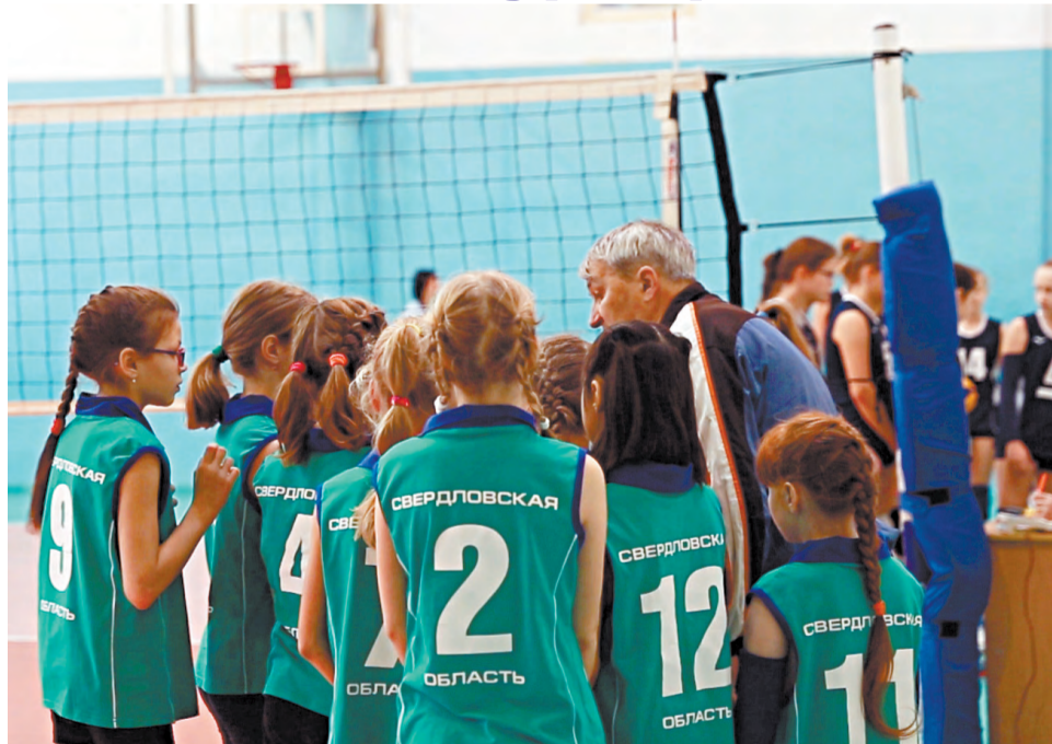
Напутствие перед игрой.