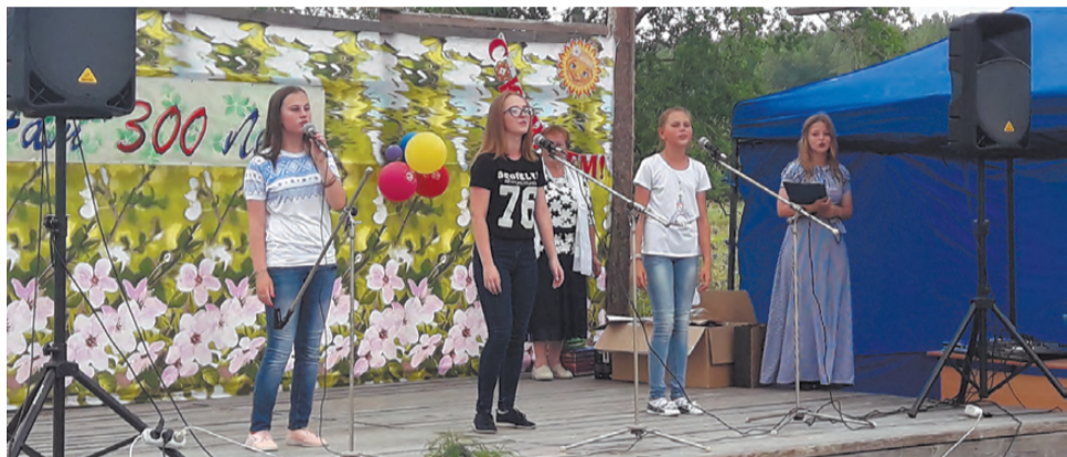
На сцене - юные таланты.

Накануне значимого события - 300-летия Фирсово - в сельской библиотеке появилась новая дверь. Теперь читателям посещать культурное учреждение проще и удобнее.