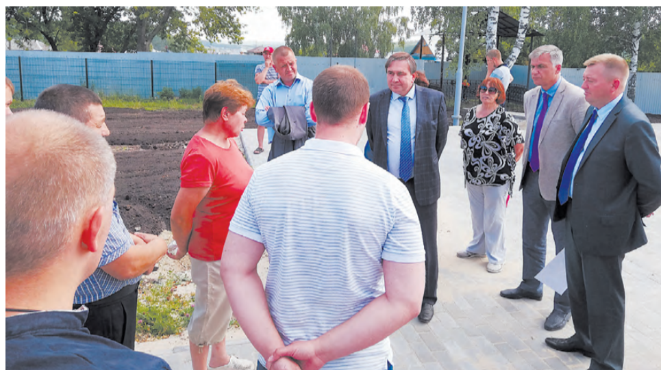
Жители с. Глинское не согласны отказаться от памятника солдату в обновлённом парке Победы.

Министр совместно с руководством администрации на месте разбирался в причинах простоя и искал пути выхода из ситуации.