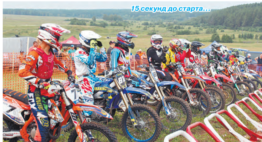
15 секунд до старта...