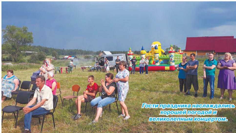
Гости праздника наслаждались хорошей погодой и великолепным концертом.

Праздничная программа показала, насколько богато талантами село. И 300-летний юбилей, который отметило Фирсово, далеко не предел для развития села: здесь немало молодёжи, которая в