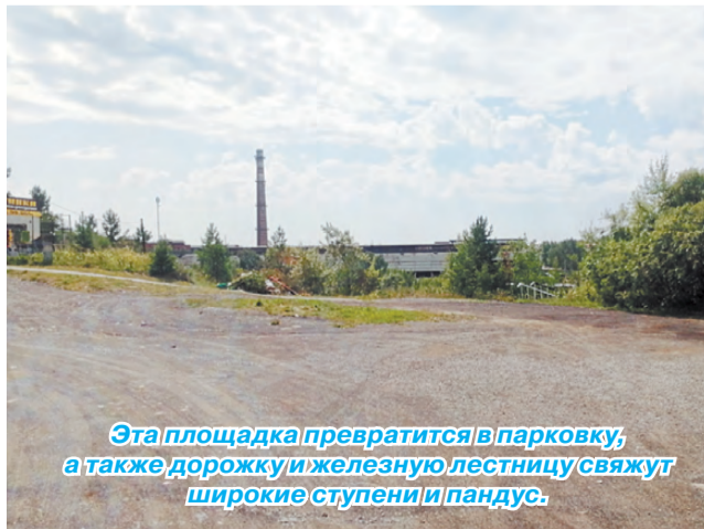
Эта площадка превратится в парковку, а также дорожку и железную лестницу свяжут широкие ступени и пандус.

В Реже продолжается комплексное благоустройство городских общественных пространств с учётом мнения режевлян. На протяжении последних двух лет Общественная палата Режевского городского округа активно привлекает внимание к проблемам благоустройства кладбища, расположенного на Орловой горе. Здесь уже на протяжении десятилетий не вывозится мусор с внутреннего периметра, он уже образовал огромные спрессованные кучи, которые буквально второй раз похоронили под собой людей, на чьих могилах сейчас настоящие свалки. Кроме того, сегодня храм Иоанна Предтечи и смотровая площадка, расположенная рядом с ним на вершине горы, являются одной из основных точек туристического маршрута по нашему городу, а подъехать к ним на автобусе, а также развернуться крупному транспорту