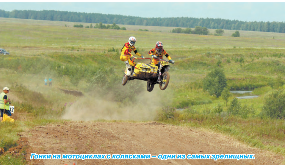
Гонки на мотоциклах с колясками – одни из самых зрелищных.