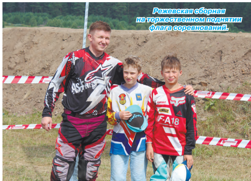
Режевская сборная на торжественном поднятии флага соревнований.