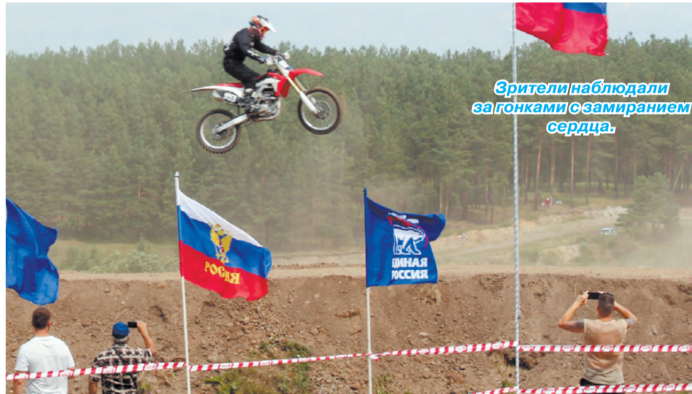
Зрители наблюдали за гонками с замиранием сердца.