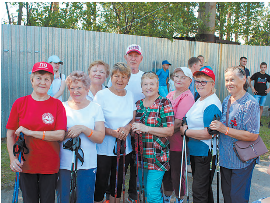
Группа здоровья стадиона «Сатурн» в День города.

подготовке праздника следует учесть некоторые моменты. Так, «Сафьяновская медь» подготовила и провела семейную эстафету, в которой участвовали шесть семейных пар. Это было интересное, захватывающее зрелище, но оно проходило при пустых трибунах. И ещё. Заключительным этапом праздничного торжества в честь Дня города является салют, который проходит на Гавани. Любимым местом для наблюдения этого зрелища для жителей Семи ветров стал левый берег пруда. Жители микрорайона кто пешком, кто на машинах заранее выдвигаются сюда в поисках места, откуда можно полюбоваться красочным салютом, отражающимся в воде. Но весь берег зарос кустарником, микрорайон Гавань отсюда уже не виден, не говоря уже о глади пруда. Руководству города необходимо обратить внимание на заросшую территорию левого берега пруда. Раньше здесь проводились соревнования по лёгкой атлетике, жители микрорайона отдыхали на берегу семьями. Надо вновь создать условия для спорта и отдыха, тем более что, кроме стадиона «Сатурн», других открытых площадок здесь нет.