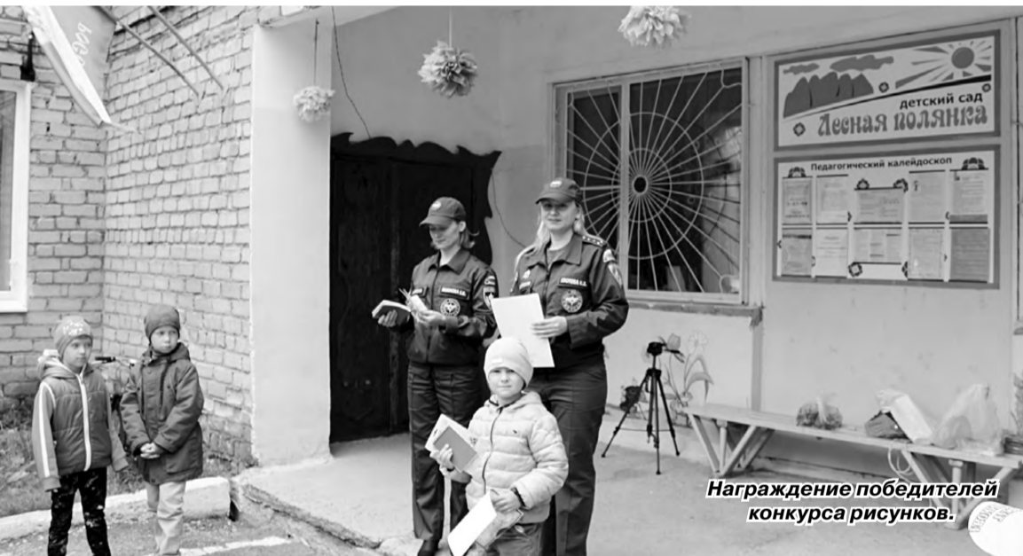
Награждение победителей конкурса рисунков.

Материал и фото предоставлены ОНД и ПР Режевского ГО, 223 ПСЧ.