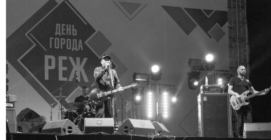
Лидер группы «Смысловые галлюцинации» Сергей Бобунец исполнил песни, которые публика знала наизусть.