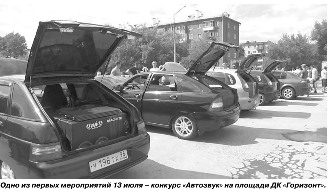
Одно из первых мероприятий 13 июля – конкурс «Автовзвук» на площади ДК «Горизонт».