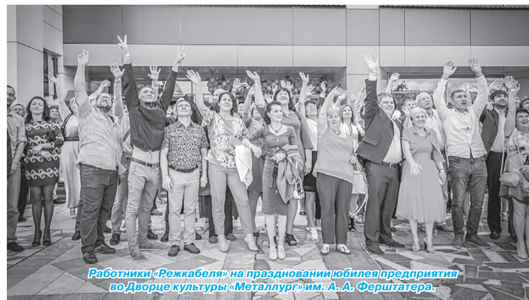
Работники «Режкабеля» на праздновании юбилея предприятия во Дворце культуры «Металлург» им. А. А. Ферштатера.

Специалисты «Режкабеля» стремятся не только обеспечивать высокое качество, надёжность и удобство использования кабелей, но и