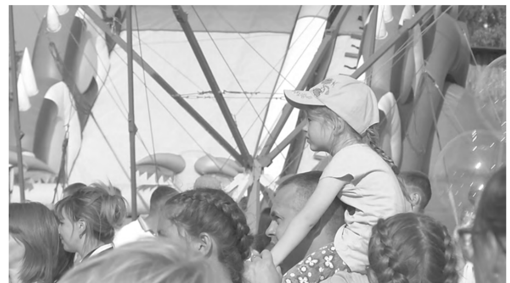
Днём на площади было много маленьких гостей.

Полина САЛАМАТОВА.