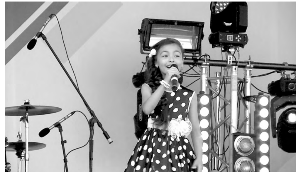
Для них выступали юные артисты.