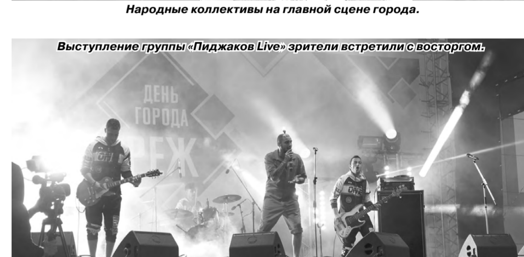
Выступление группы «Пиджаков Live» зрители встретили с восторгом.