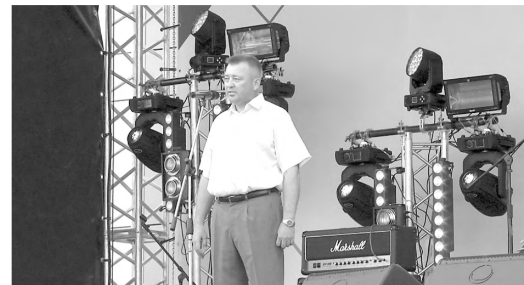
Режевлян с праздником поздравил глава округа Иван Геннадьевич Карташов.