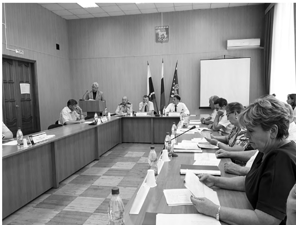
Депутаты внесли изменения и дополнения в бюджет РГО на 2019 год и плановый период 2020 и 2021 годов.