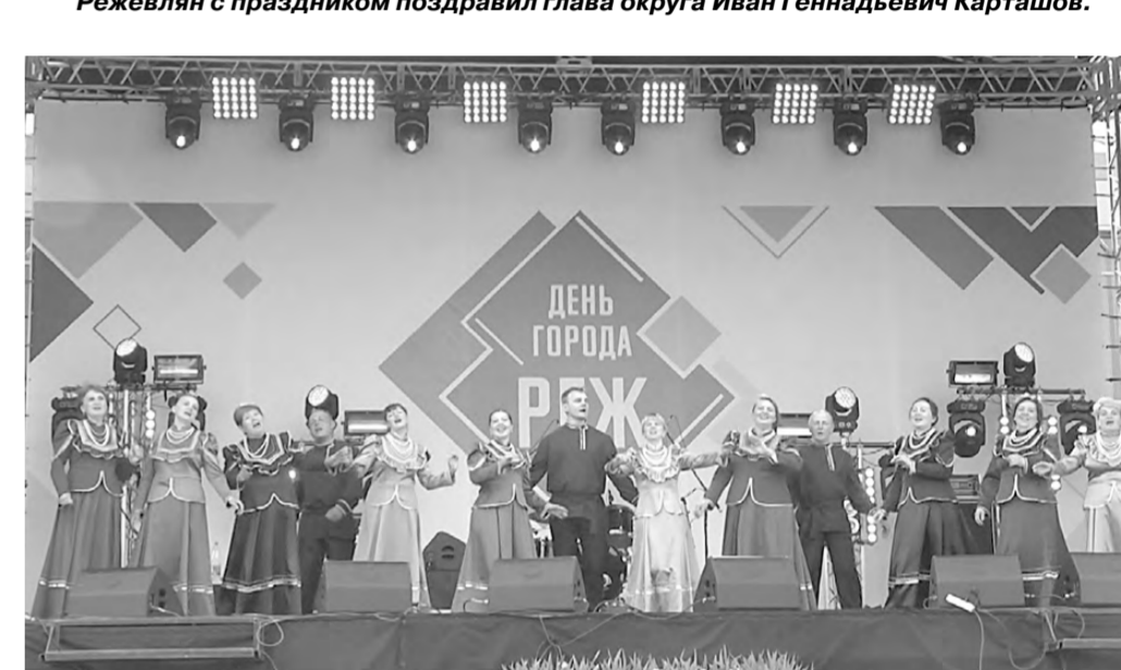
Народные коллективы на главной сцене города.