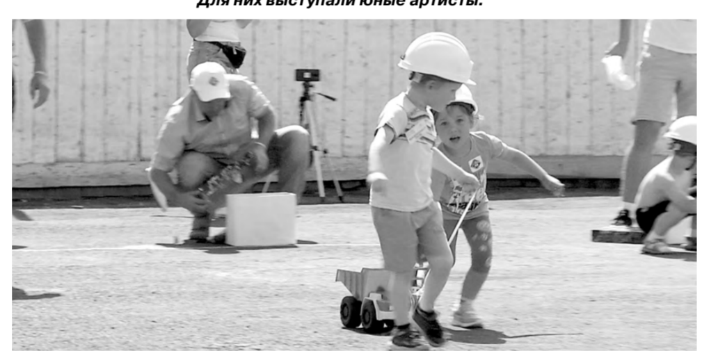
На корте стадиона «Сатурн» прошла детская эстафета «Один день из жизни шахты».