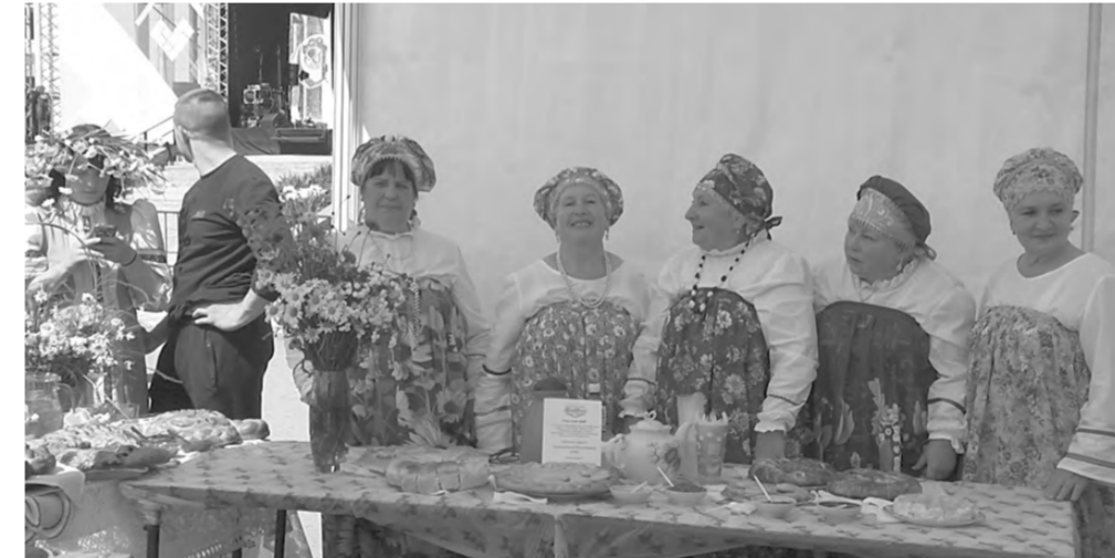
Участники фестиваля «ХлебСоль».