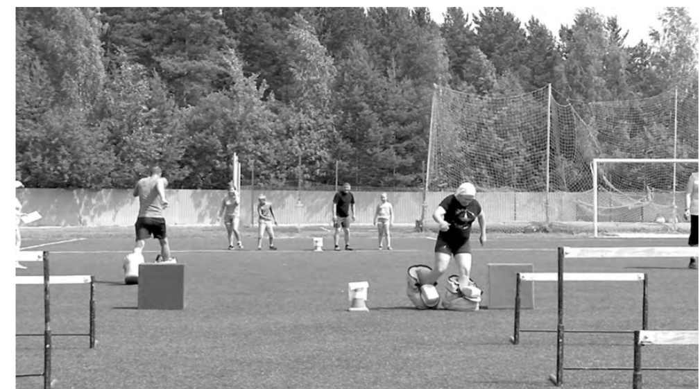
На стадионе «Сатурн» соревновались в локости на семейной эстафете #zasport.