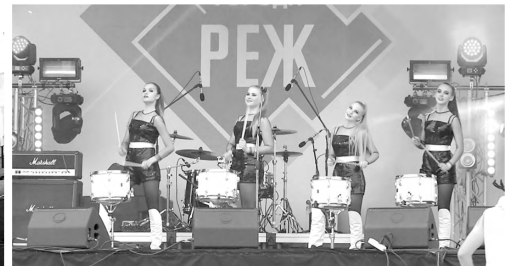
Барабанщицы открыли шоу «МегаMix».