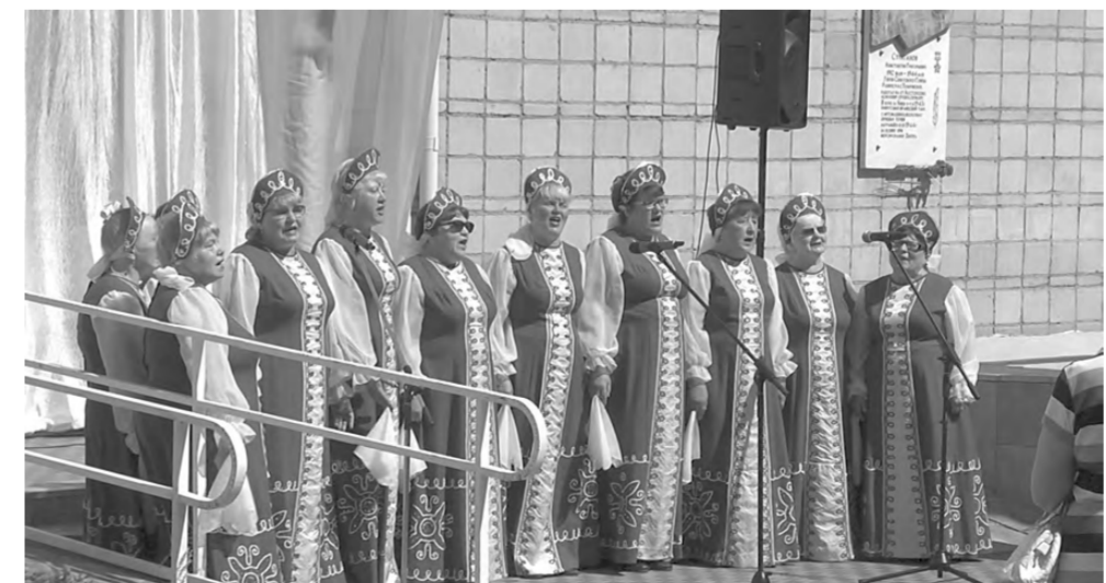
Выступление хоров и ярмарка мастеров у Центральной библиотеки привлекли немало зрителей.