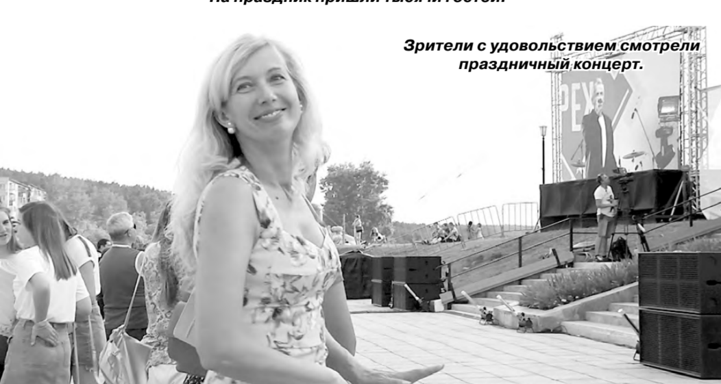
Зрители с удовольствием смотрели праздничный концерт.