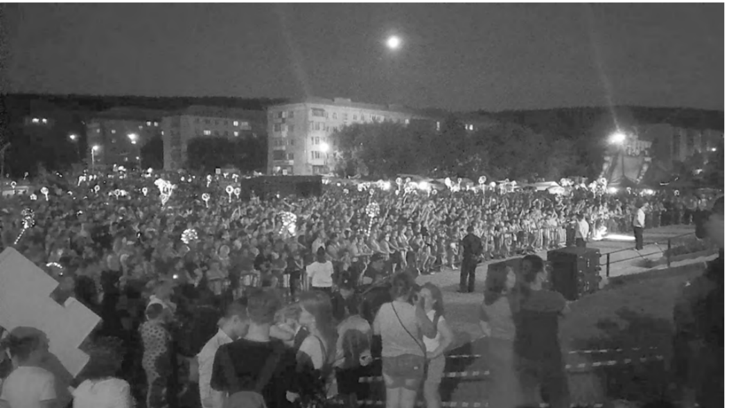
На праздник пришли тысячи гостей.