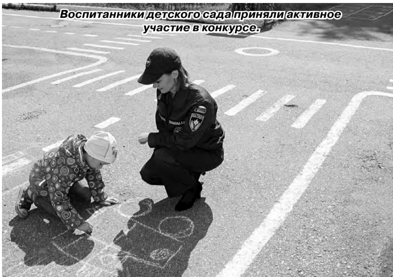
Воспитанники детского сада приняли активное участие в конкурсе.

При подведении итогов учитывалась тематическая направленность, оригинальность работы и новизна подходов к раскрытию темы. Рассмотрев представленные работы, жюри