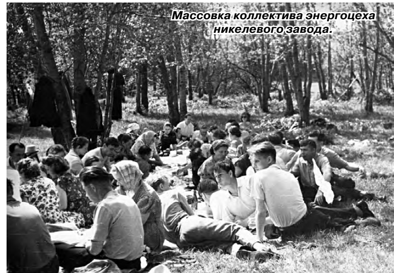
Массовка коллектива энергоцеха никелевого завода.

В 70-х годах на центральном входе установили табличку «Детский парк». На территории парка поставили качели, карусели, установили детские аттракционы. Особенно нравились детские машинки, на которых можно