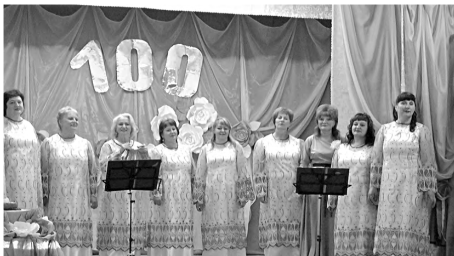
В Черемисском любят и умеют петь.