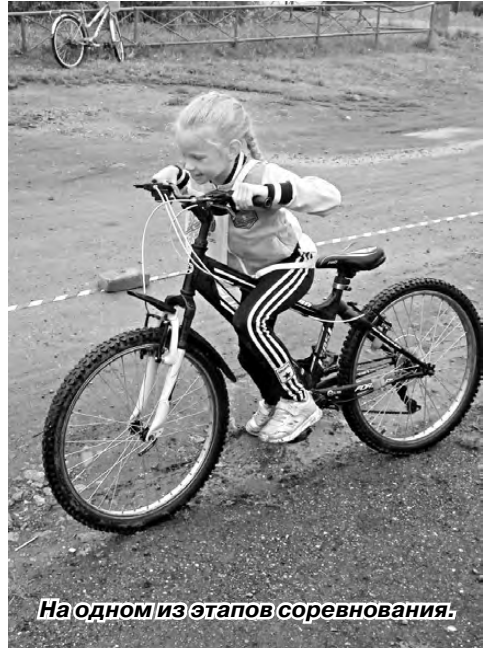
На одном из этапов соревнования.

Всем участникам велогонки была вручена спортивная атрибутика от управления культуры, физической культуры, спорта и молодёжной политики. Победителям