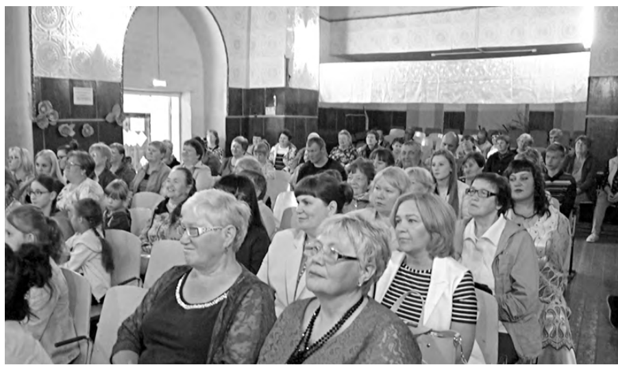
Зрители юбилейного концерта.