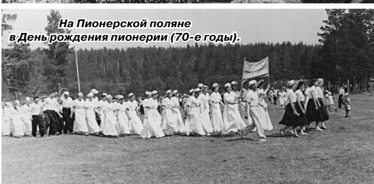
На Пионерской поляне в День рождения пионерии (70-е годы).

бивший Реж. Этот снимок он сделал, забравшись на колокольню Богоявленского храма. Мы видим здесь улицу Ленина, а на переднем плане парк с молодыми посадками. Он размещался между Богоявленским храмом, затем реконструированным под техникум, и зданием школы. Сначала частично это была территория Богоявленского храма. Здесь даже производили захоронения священнослужителей. В советское время территория была огорожена лёгкой изгородью, облагорожена беседкой и цветочными клумбами. Позднее