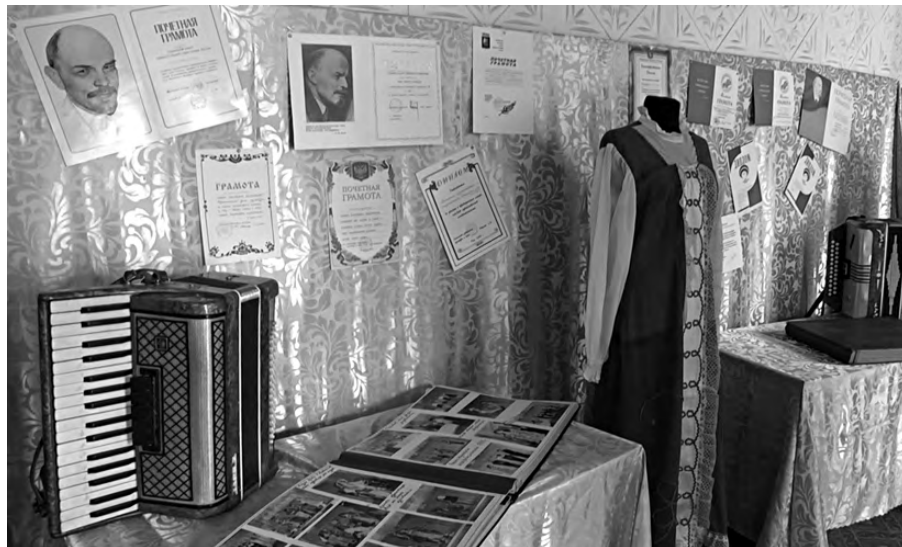
Выставка в фойе Дома культуры.