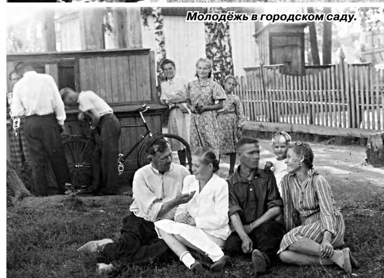
Молодёжь в городском саду.