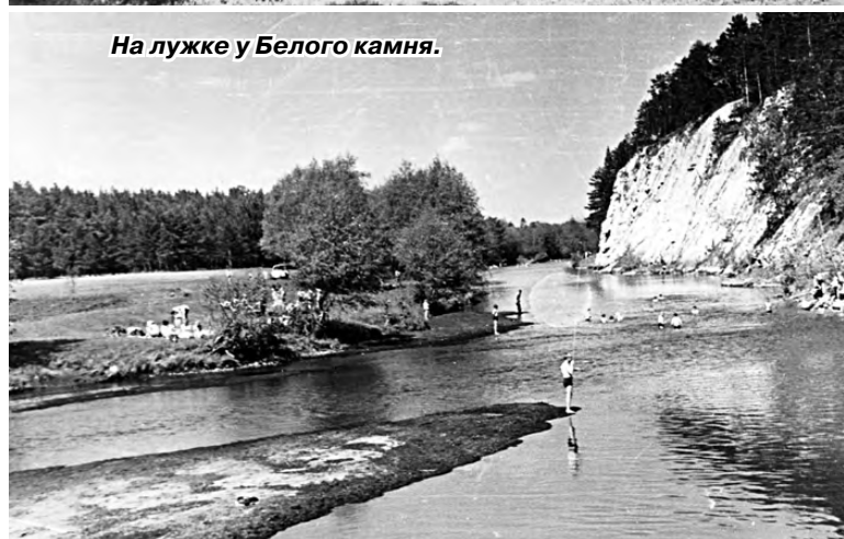
На лужке у Белого камня.