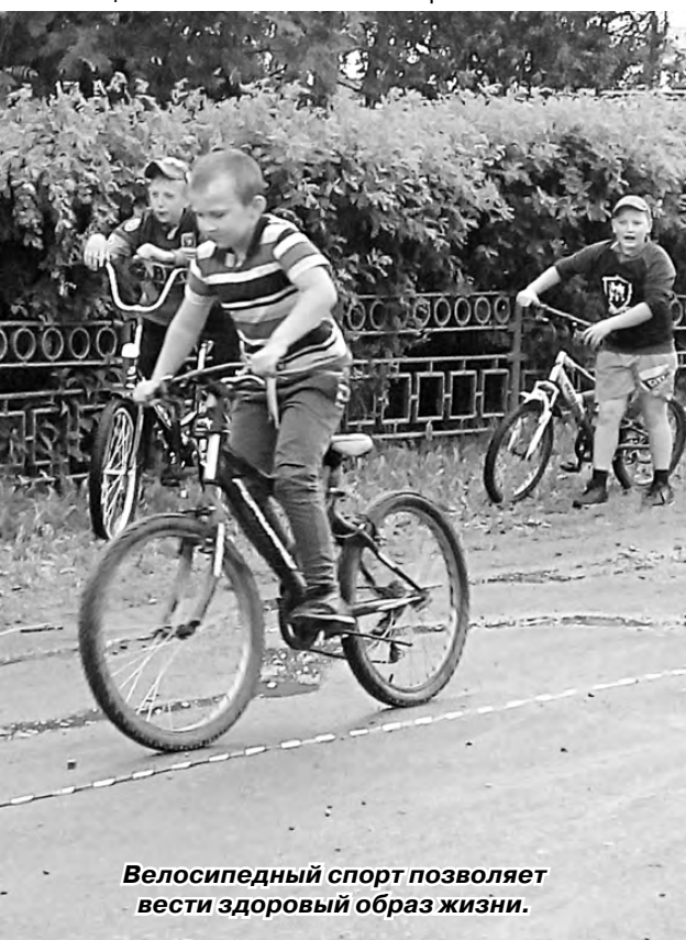
Велосипедный спорт позволяет вести здоровый образ жизни.

Немаловажную роль сыграла поддержка группы болельщиков своих велосипедистов, а малыши-девочки дружно махали цветными ленточками и кричали