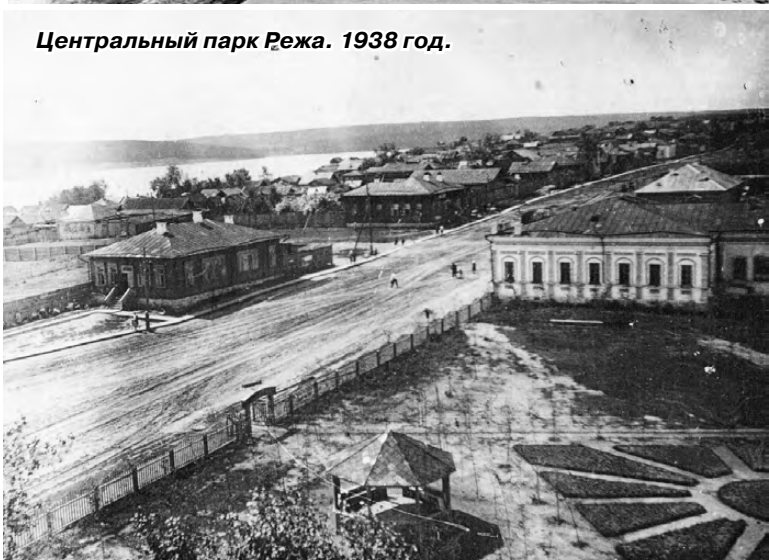
Центральный парк Режа. 1938 год.