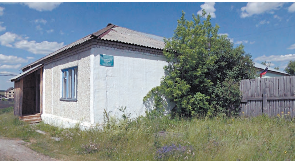
Здание ФАПа в Голендухино.