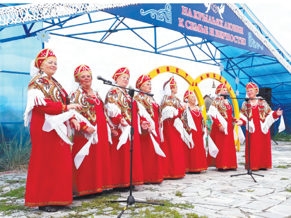
Хоровой коллектив «Спелая вишня» из с. Клевакинского порадовал гостей праздника ярким выступлением.