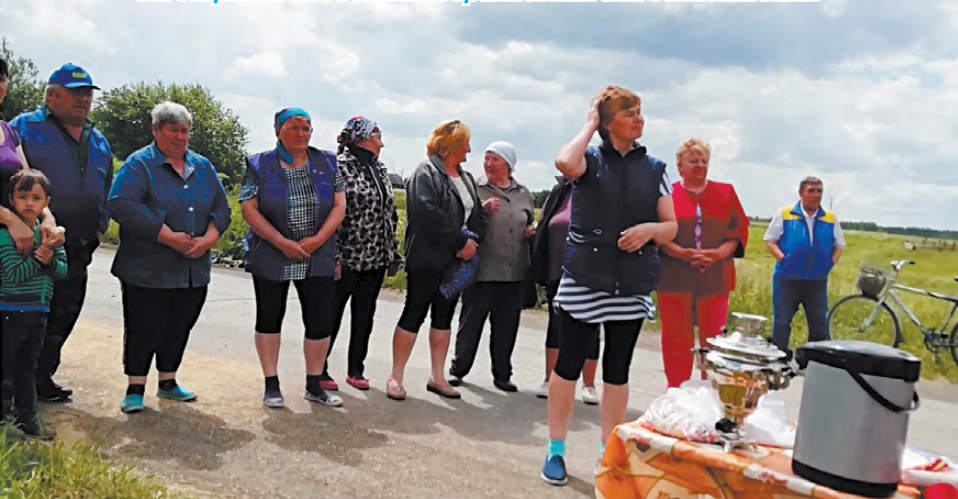
На открытие источника собрались жители села Каменка.

Галина ВАСИЛЬЕВА.