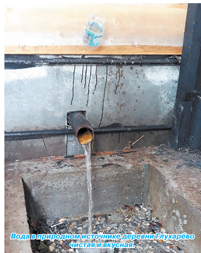
Вода в природном источнике деревни Глухарёво чистая и вкусная.