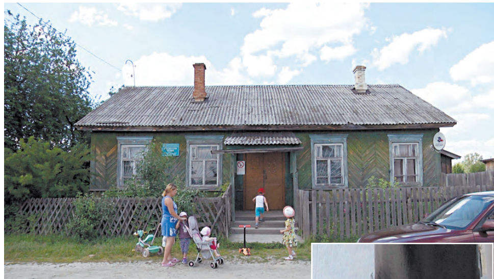
А вот так выглядит сегодня лечебница пос. Костоусово, она соседствует с квартирой.