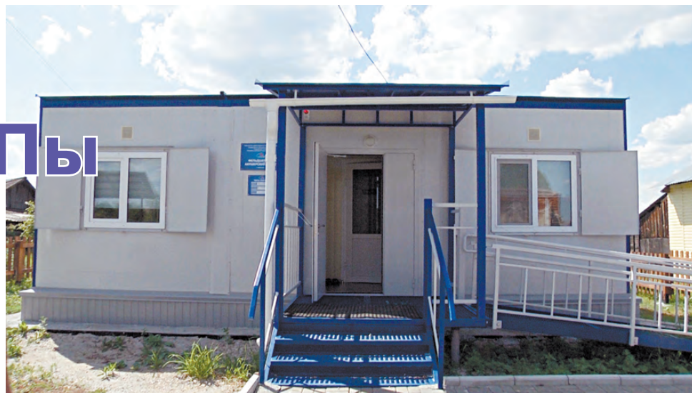
В селе Ленёвском ФАП работает уже почти полгода. Внешне они все выглядят одинаково.

Отдельно хочу сказать про фельдшерский пункт в пос. Костоусово, он, можно сказать, уникальный. Его к нам привезли с выставки ЭКСПО, это показательный образец. Нам повезло, что мы одними из первых получили свой модуль. Чтобы как можно быстрее получить конечный результат, а именно полноценно работающий современный ФАП, мы раньше других подготовили территорию для его размещения и всю соответствующую документацию и сегодня уже оборудуем