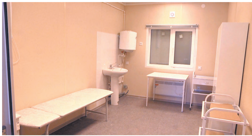
Так будет выглядеть процедурный кабинет.