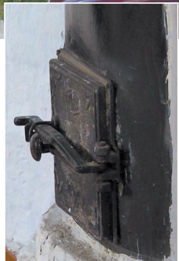
Отопление здесь печное.