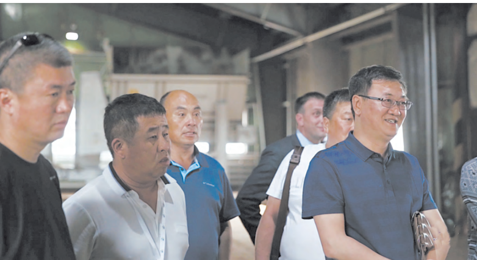
В прошлом году делегация из Китая побывала на предприятии, после чего было принято решение о сотрудничестве.