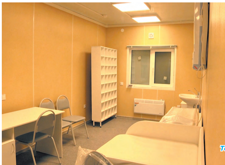
Тем временем в новом ФАПе уже появилась мебель.