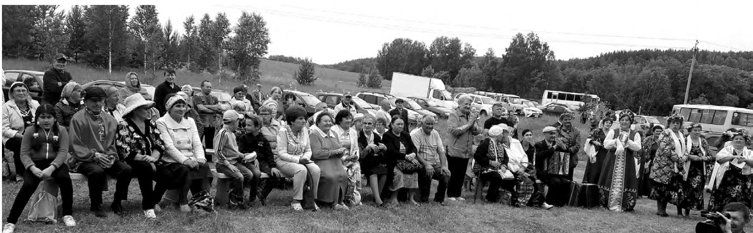
Гости мероприятия пели знакомые песни, которые исполнялись под аккомпанемент гармошки и баяна.