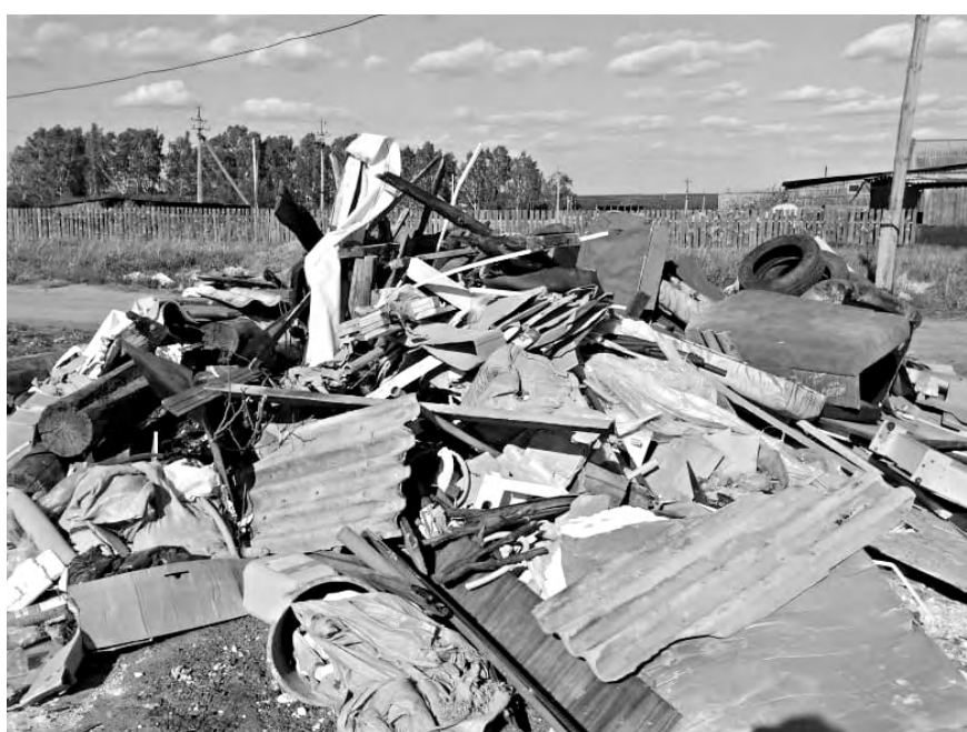
Строительный мусор и другой хлам постоянно складироват на контейнерной площадке в районе улиц Молодёжная и Титова.

Безусловно, если предписание не будет выполнено, одного из нарушителей чистоты и порядка к административной ответственности всё же привлекут за нарушение правил благоустройства территории. Насчёт второго авто, из которого производилась выгрузка крупногабаритных отходов, информации ни от полиции, ни от администрации нет.