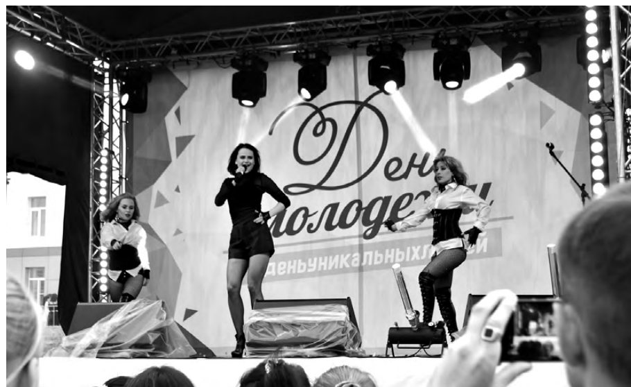
Гости праздника – вокальная группа «EXPROMT».