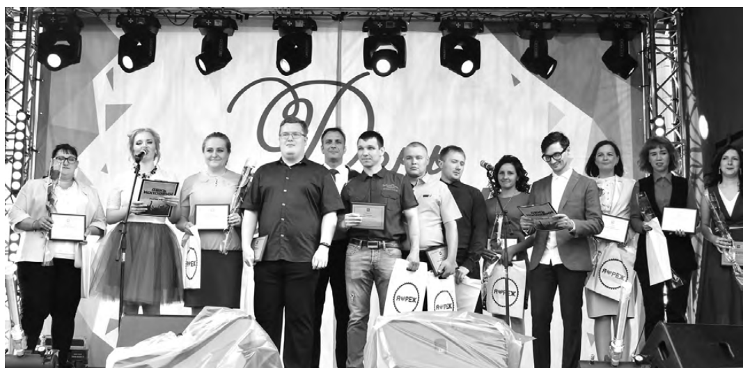
Лауреаты премии «Лучший молодой человек – 2019».