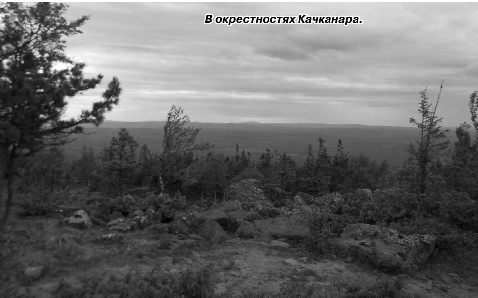
В окрестностях Качканара.