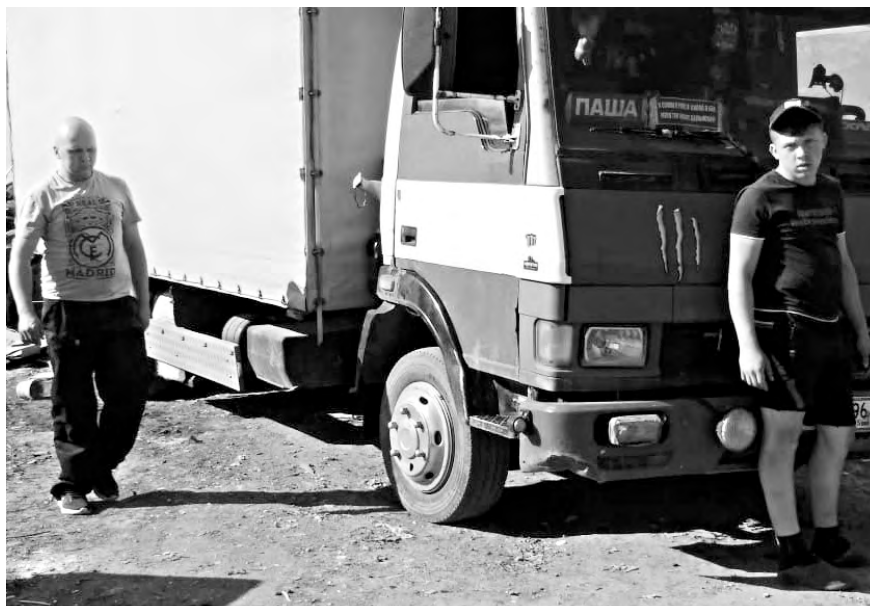
Собственнику этой машины выдали предписание на устранение нарушений правил благоустройства.

Р. С. Обидно, что людей, готовых бороться за чистоту и порядок в городе, гоняют по инстанциям. Тем временем территории (в частности, возле контейнерной площадки в районе улиц Молодёжная и Титова) превращаются в мини-полигоны по сбору и хранению твёрдых коммунальных отходов. Конечно, время от времени их чистят сотрудники МУП «Чистый город». Но порядок на месте свалок царит недолго: несознательные граждане снова везут сюда мусор. Так почему бы не взять за постоянную практику рейды по выявлению таких нарушений? Глядишь, и реформа бы пошла скорее и эффективнее.