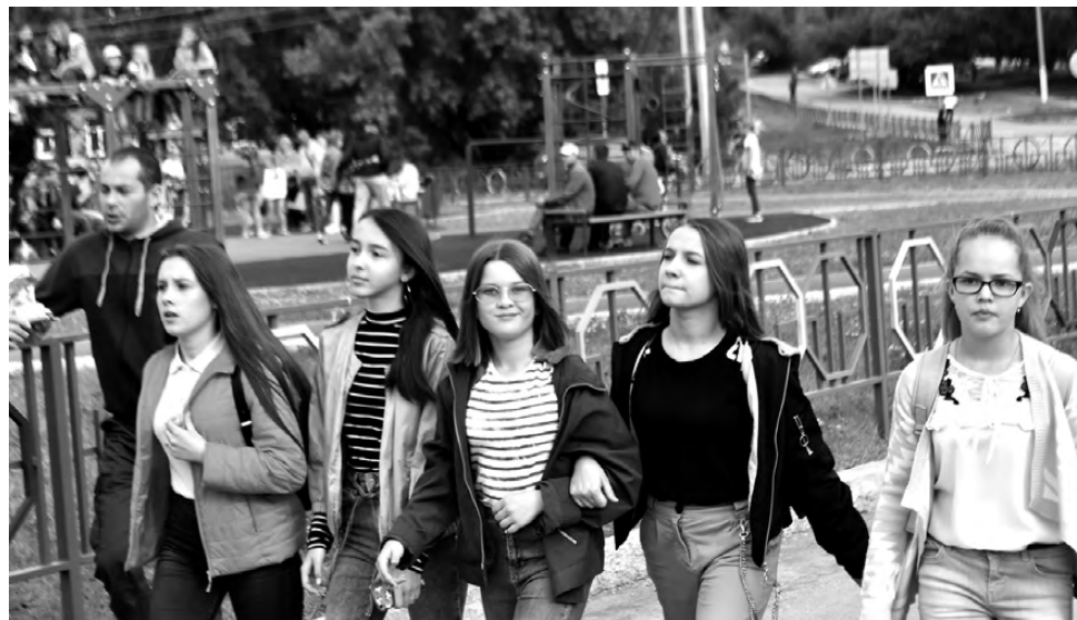
Молодёжь – наше будущее.