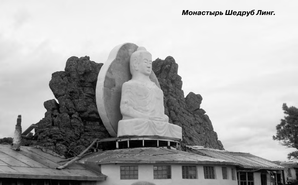
Монастырь Шедруб Линг.