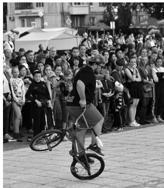
Флэтленд – исполнение акробатических трюков на специальных велосипедах.