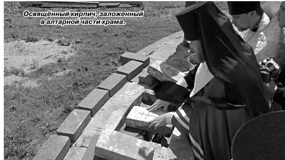
Освящённый кирпич, заложенный в алтарной части храма.