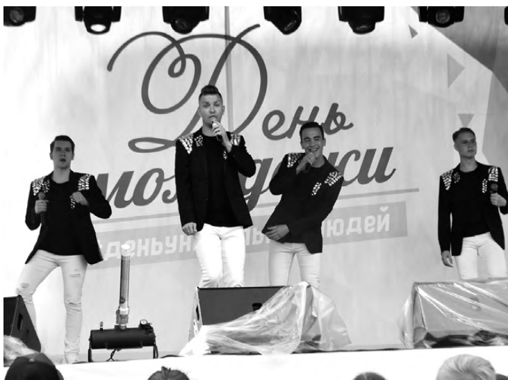
Мужской вокальный коллектив «Sample» радовал зрителей популярными песнями.