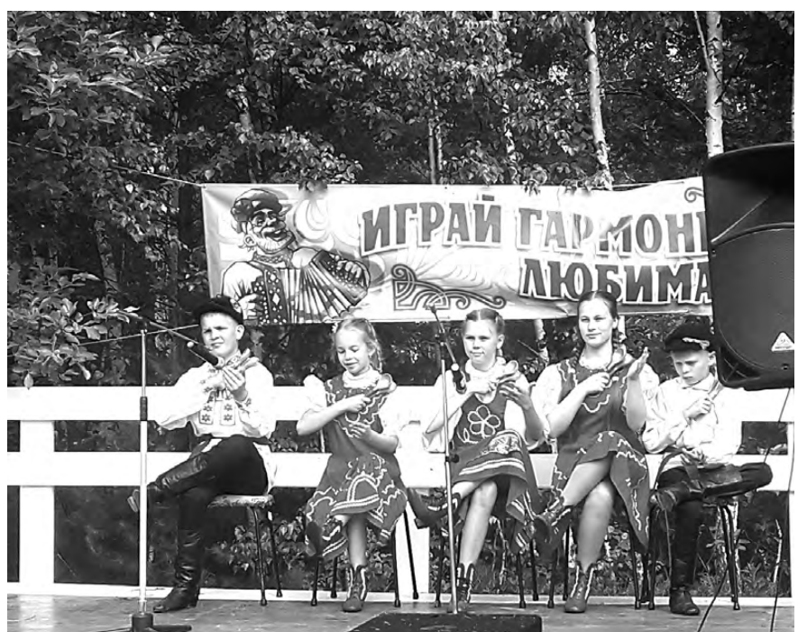
Детский ансамбль «Ложечники» (с. Фирсово).