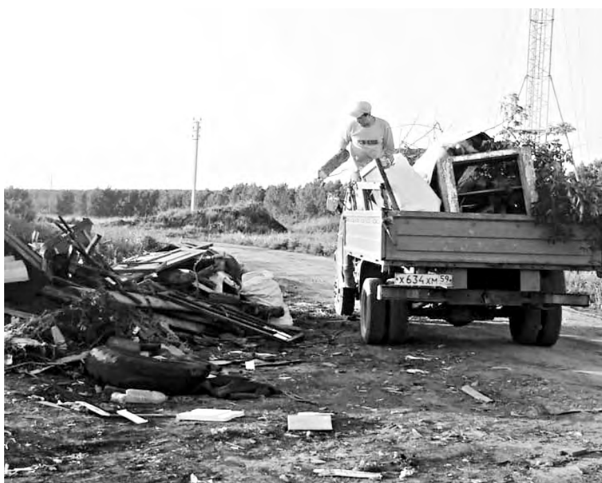
Водитель этого автомобиля пока остался безнаказанным.