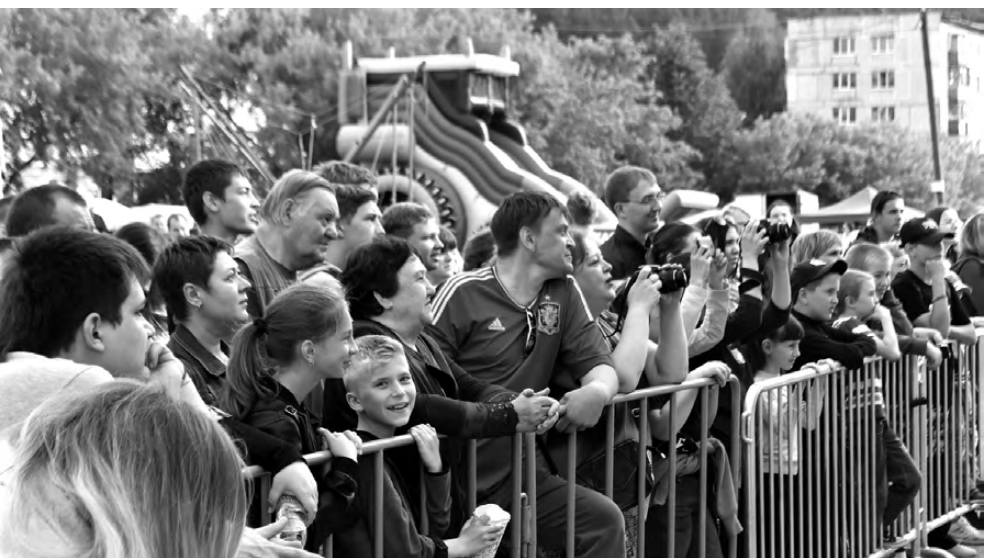
Гости праздничного мероприятия получили заряд положительных эмоций.