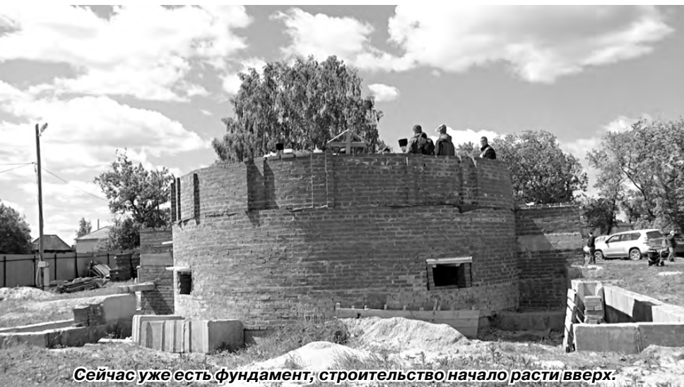
Сейчас уже есть фундамент, строительство начало расти вверх.