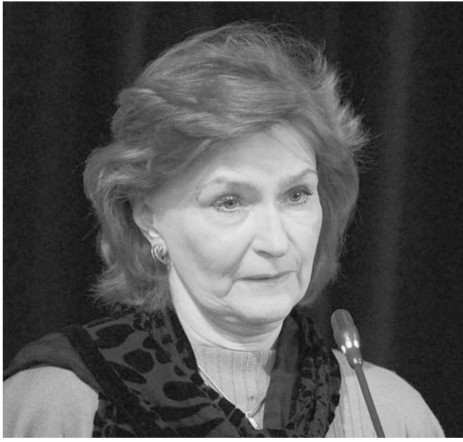
Н. А. Нарочницкая, российский политический деятель, историк и политолог. Доктор исторических наук. Специалист по США, Германии и общим проблемам и тенденциям международных отношений.

Рассматривая причины Второй мировой войны, мы должны помнить не только о реваншистских настроениях в Германии после «Версальского унижения» относительно Западной Европы, но и захватнической политике Германии. Цель этой политики была определена Гитлером в его книге «Моя борьба»: «Если мы сегодня говорим о новых землях и территориях в Европе, мы обращаем свой взор в первую очередь к России, а также и соседним с ней и зависимым от неё странам... Это громадное государство на Востоке созрело для гибели... Мы избраны судьбой стать свидетелями ка-