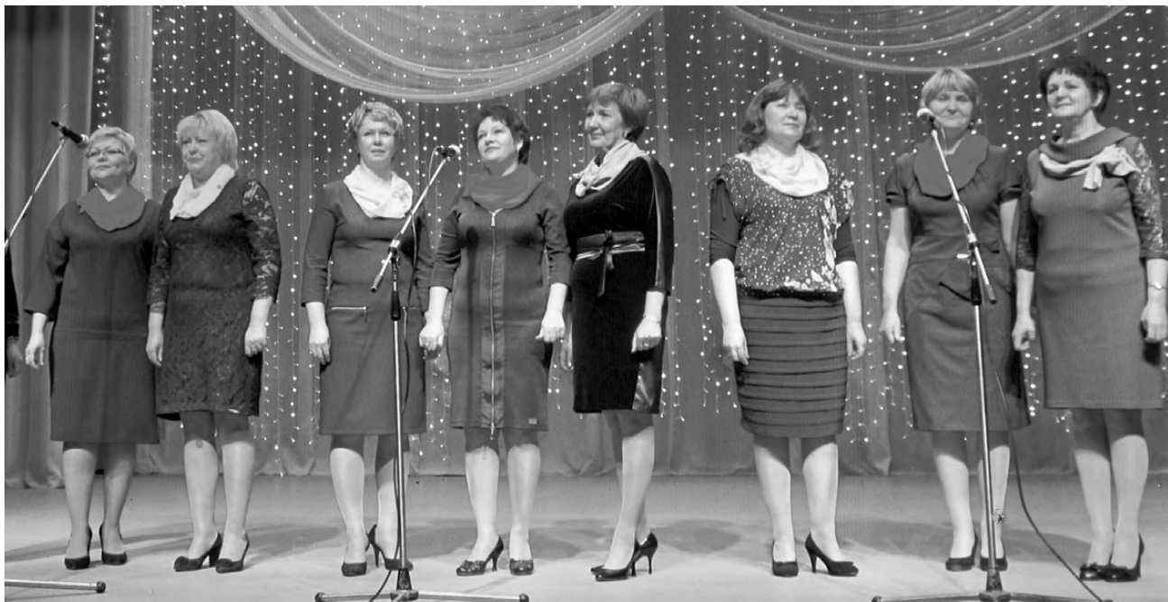
Директора нового поколения.

Помню случай: одного из учеников пятой школы не хо-