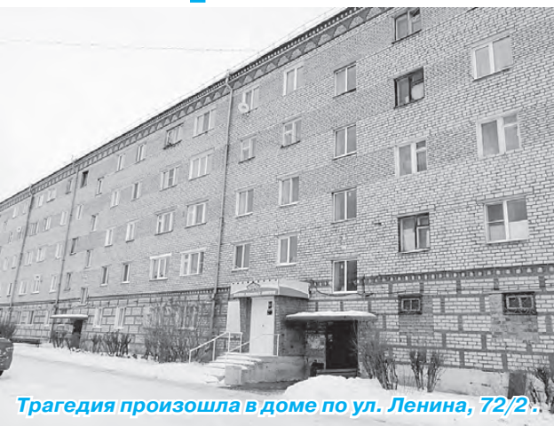
Трагедия произошла в доме по ул. Ленина, 72/2.

15 января в 13.34 на пульт Режевской 223 пожарно-спасательной части поступил тревожный звонок. Жильцы дома по ул. Ленина, 72/2 сообщили о том, что из одного жилого помещения валит дым.