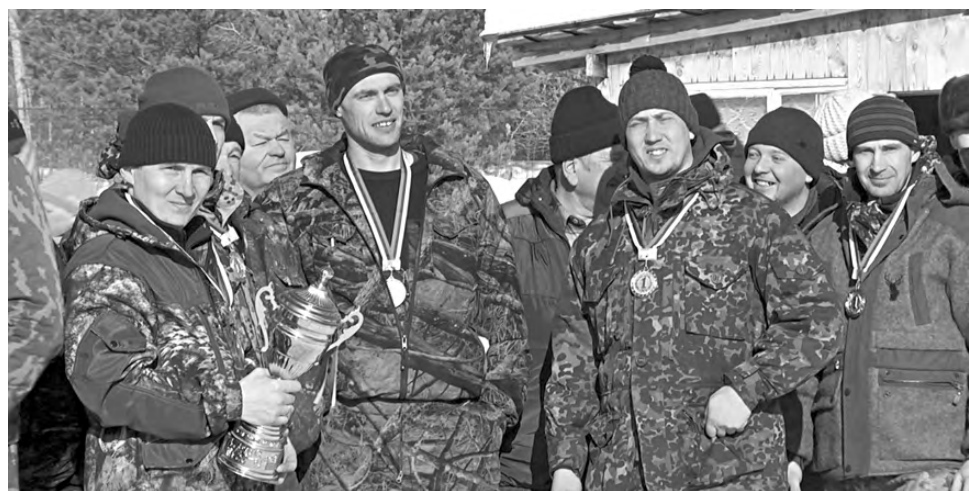
Победители охотничьего многоборья – команда «Обход №6».

№6», с чем мы их и поздравляем. Также традиционно команде, занявшей первое место, предоставляется право зажжения праздничного костра в честь окончания соревнований.