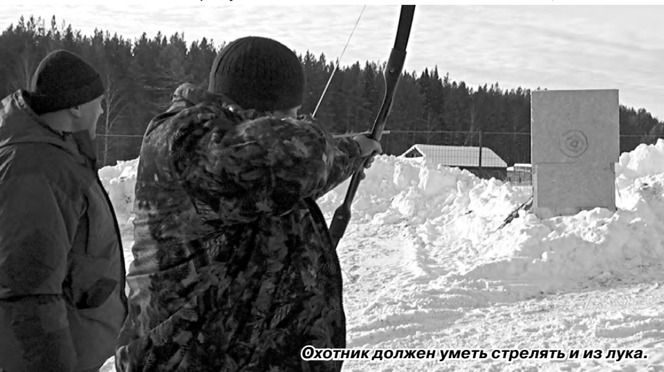
Охотник должен уметь стрелять и из лука.