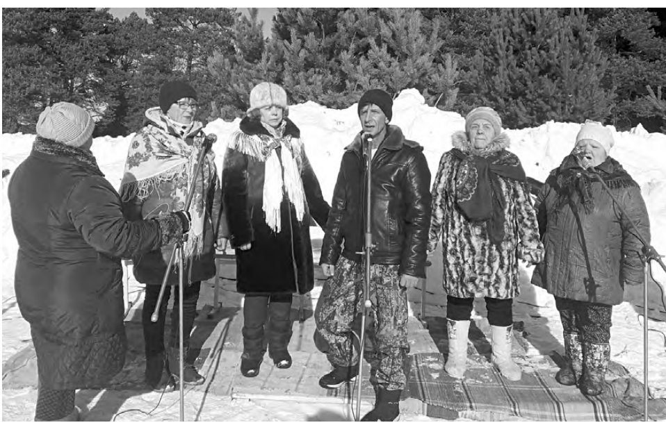
Праздничный концерт подарили гостям мероприятия творческие коллективы Фирсовского клуба.