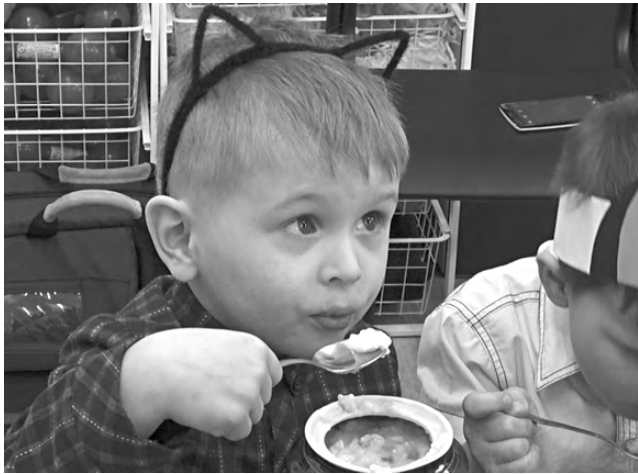
Каждый попробовал праздничную кашу.

Каша – традиционное русское блюдо, и на празднике воспитанники «Золотой рыбки» узнали, из чего её готовят, участвовали в конкурсе, кто быстрее и правильнее подберёт ингредиенты для каши.