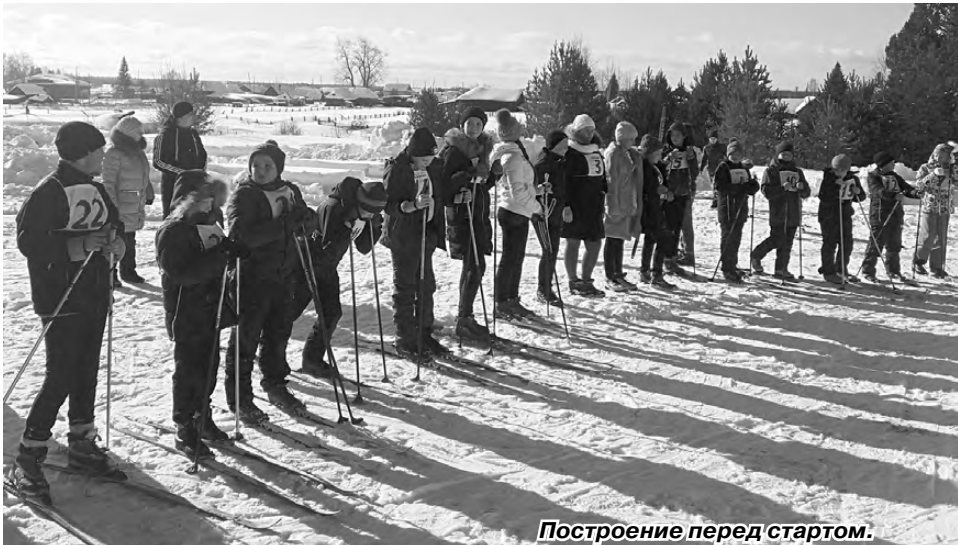
Построение перед стартом.

Старт соревнованиям дан. Пять возрастных категорий включаются в лыжную гонку. Но, наверное, гонка – это сказано слишком смело. Потому что для многих участников это соревнование просто дополнительный стимул прокатиться на лыжах в хороший зимний день. Для этого даже из