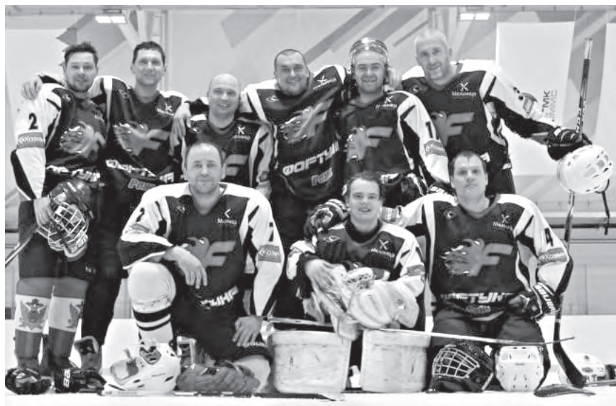
«Фортуна» на выездном матче в г. Кировграде.

«Фортуна» выступает в рамках ещё одного турнира – первенства РГО. В нём также принимают участие команды «Сатурн» (юношеская сборная) и сборная с. Клевакинского. Последние участники уже играли между собой, счёт матча – 7:3 в пользу «Сатурна». К сожалению, «Фортуна» клевакинцы тоже проиграли. Они