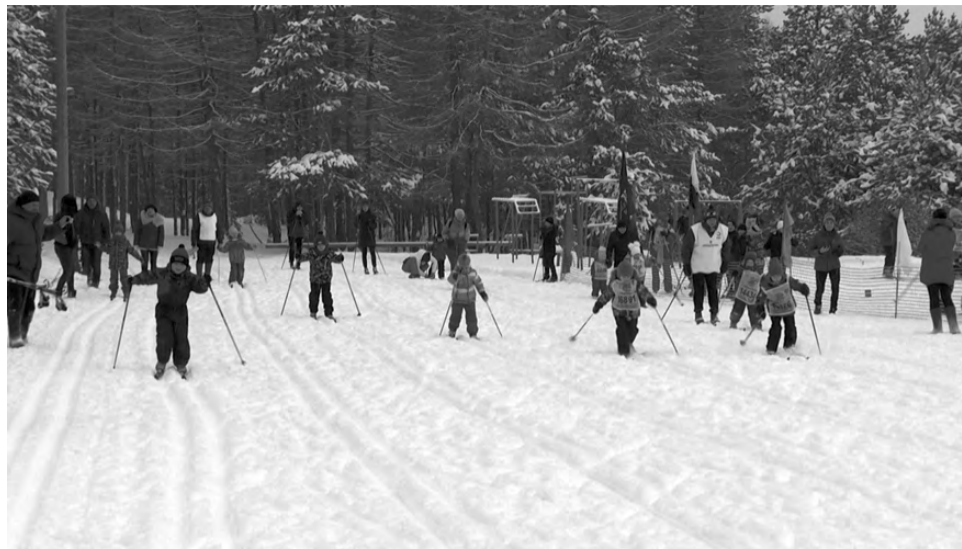
На старте – детсадовцы.

Ну и завершал спортивный праздник «Лыжня России» массовый старт всех любителей лыжного спорта. На старт вышли работники и служащие режевских предприятий и организаций. А именно: сотрудники управления образования, центральной районной больницы, управления городским хозяйством, «Сафьяновской меди», военнослужащие войсковой