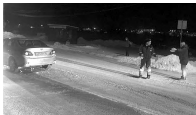
Женщина, управляющая «Короллой», объясняет сотруднику полиции обстоятельства ДТП.

Также напоминаем, что невыполнение водителем