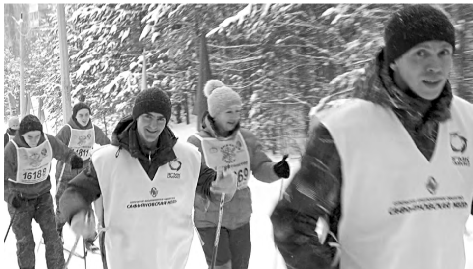
На лыжне – сотрудники режевских предприятий, учреждений и организаций.

части посёлка Первомайский и другие. продолжительность которой равна году проведения «Лыжня России» в метровом эквиваленте, то есть 2019 метров. Кому-то также предстояло преодолеть трассу,