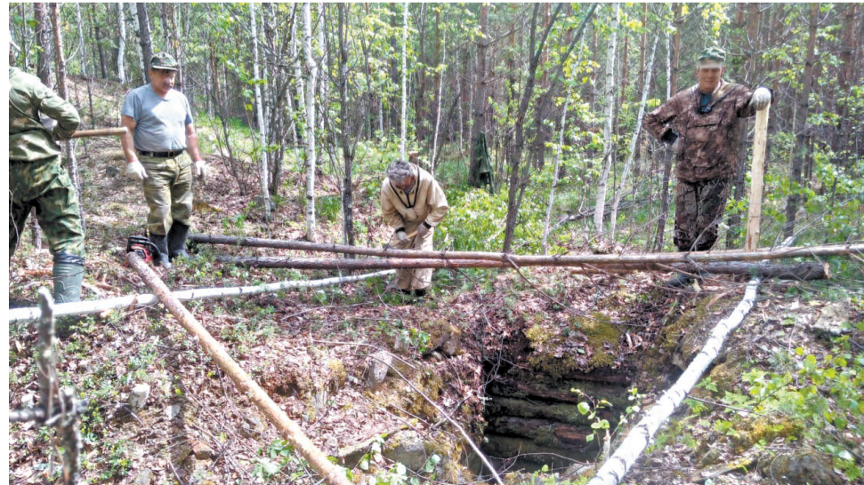
Работа по укреплению копей.

Беседовала Елена ГОРОХОВА.