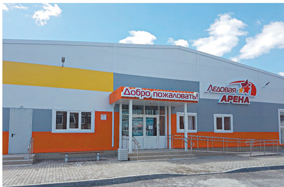
Ледовая арена построена и передана городу.

три года были приостановлены или свёрнуты как минимум семь крупных проектов. Вот этого бы не хотелось, здесь должен быть непредвзятый, объективный взгляд, подкреплённый экспертизами и заключениями специалистов, а не псевдоэкологов и популистов.