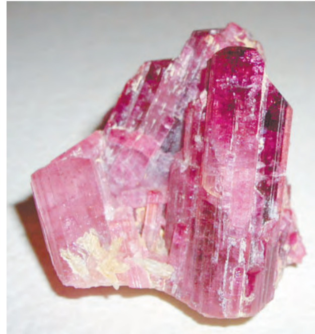
Сросток кристаллов турмалина.

К ак известно, Свердловская область - не самый экологически чистый регион страны. На сентябрьской коллегии Минприроды Российской Федерации губернатор Свердловской области Евгений Куйвашев выступал с рядом инициатив по улучшению экологической ситуации на Урале. Глава региона подчеркнул, что для Свердловской области вопросы улучшения экологической обстановки были и остаются приоритетными. Сегодня реализация нацпроекта «Экология» идет в рамках семи региональных проектов, на реализацию которых в 2019