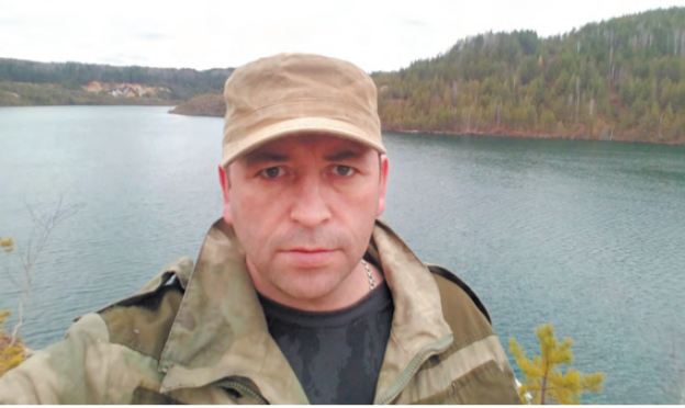
А. Сергушин. Липовский геологический парк. Северный карьер.

- Артём Витальевич, в функциях заказников сохранение и восстановление природных комплексов, какие мероприятия проводятся у нас для их реализации?