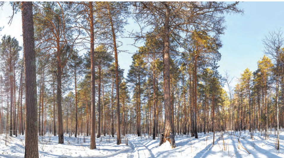
Шайтанский участок природно-минералогического заказника «Режевской».

- Липовский карьер — красивейшее место с исключительным цветом воды, это излюбленное место для фотосессий, пикников. Расскажите подробнее о том, что на сегодняшний день сделано на этом объекте?