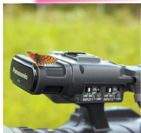
Съёмки приостановились на мгновение.