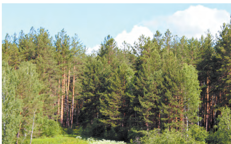
Красненькое - одно из любимых мест отдыха режевлян.

В Режевском районе несколько крупных водоёмов, которые сегодня популярны среди населения. На протяжении последних лет для сохранения местной фауны неоднократно проводилось зарыбление. В Свердловской области ловля рыбы сетями запрещена, однако есть недобросовестные люди, которые вопреки закону занимаются откровенным браконьерством. Мы стали участниками одного из регулярных рейдов в акватории Режевского пруда для пресечения подобных действий.