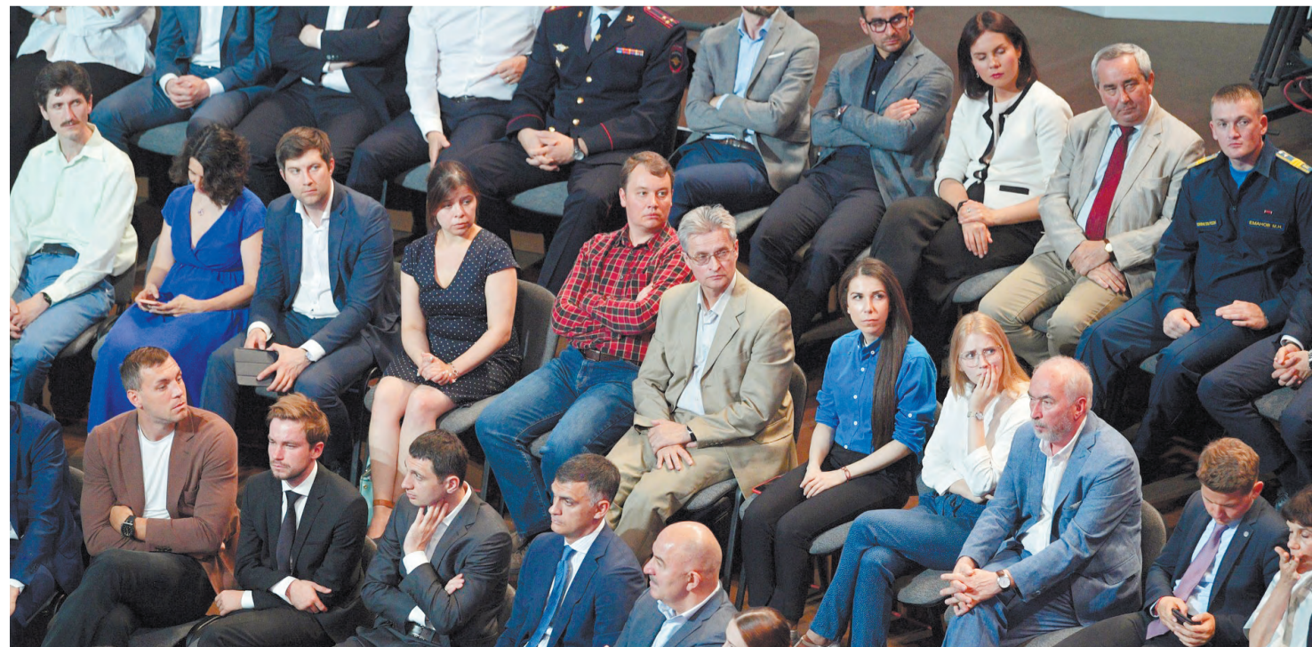
Участники прямой линии с Владимиром Путиным.