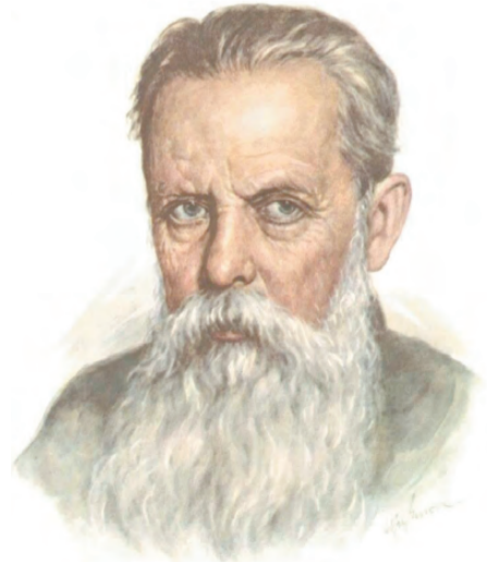
П. П. Бажов.

Как-то легко и без нажима вводит Павел Петрович читателя в самую толщу сути сказа, отсеивая всё лишнее, ненужное. И с удивительным чувством меры заканчивает сказ, оставляя у читателя впечатление целостности произведения.