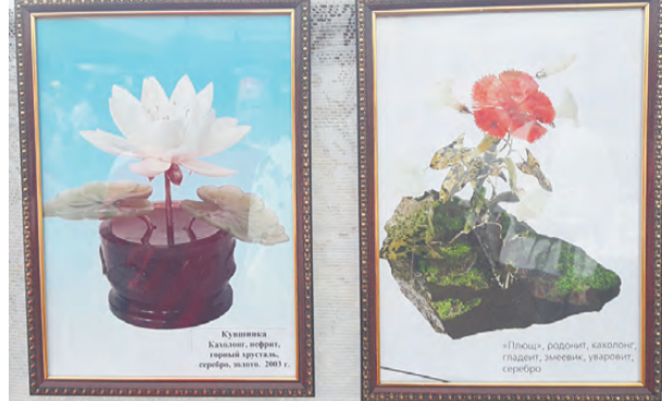
Каменные цветы режевских мастеров.

Надежда нации – это праздник, в котором участвуют таланты разных народов земли уральской. И все они собраны в «малахитовой шкатулке» Хозяйки Медной горы.