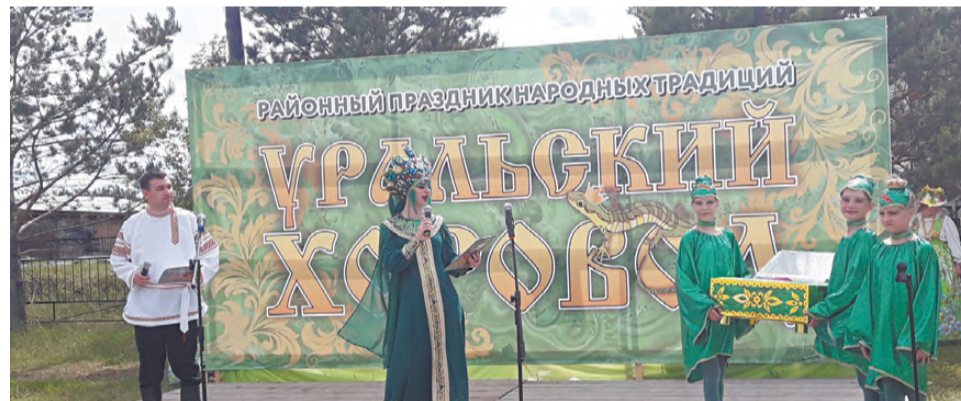
Районный праздник народных традиций в этом году был приурочен к 140-летию П. П. Бажова и назывался «Сокровища малахитовой шкатулки».