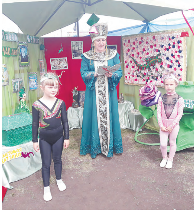
Хозяйка Медной горы со своими помощницами-ящерками.

Подготовила Галина ПОПОВА.