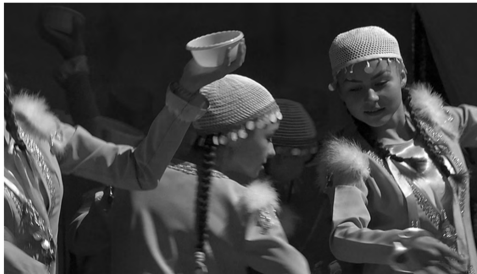
На сцене исполняли народные танцы.