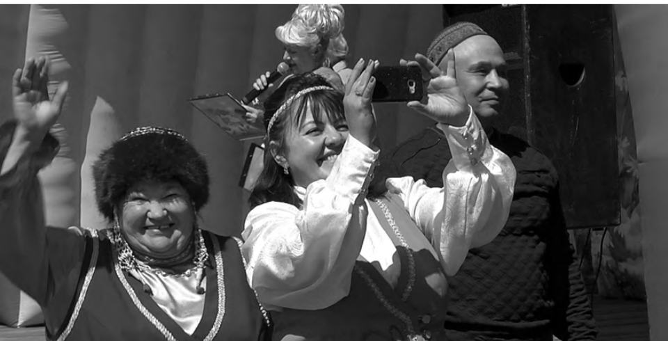
Участники праздника окунулись в позитивную атмосферу.