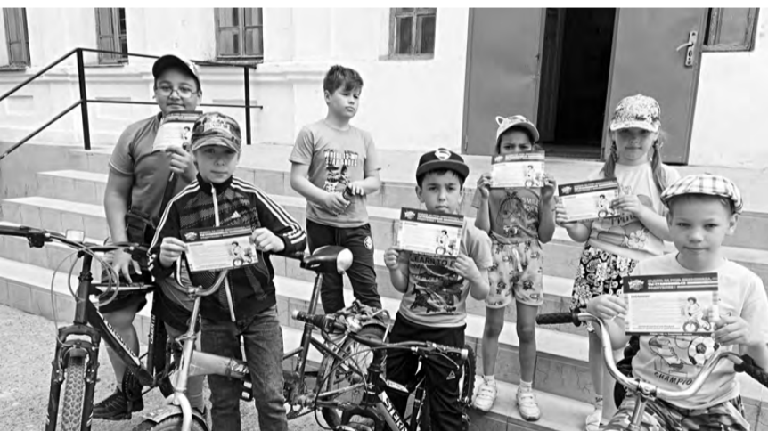
Ребятам вручили памятки.

Представители общественно-го совета при ОМВД России по Режевскому району совместно с Госавтоинспекцией напомнили юным участникам дорожного движения основные правила для велосипедистов.