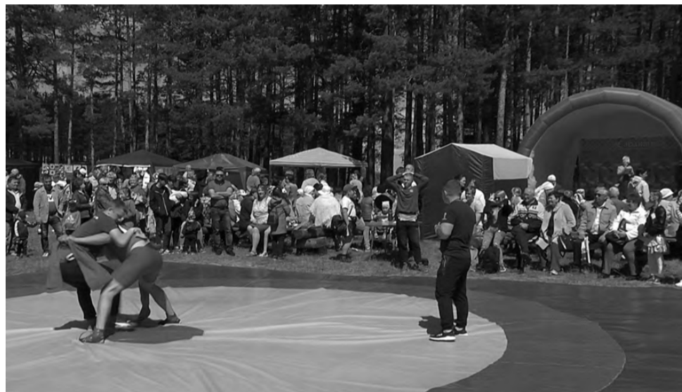
В центре внимания – борьба куреш.