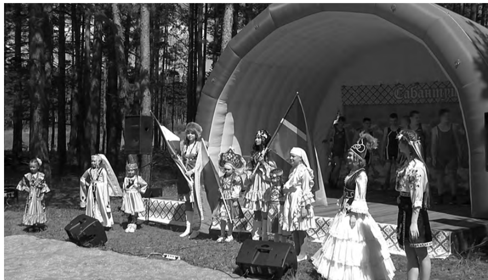
Дефиле в национальных костюмах – как символ единения народов на Сабантуе.