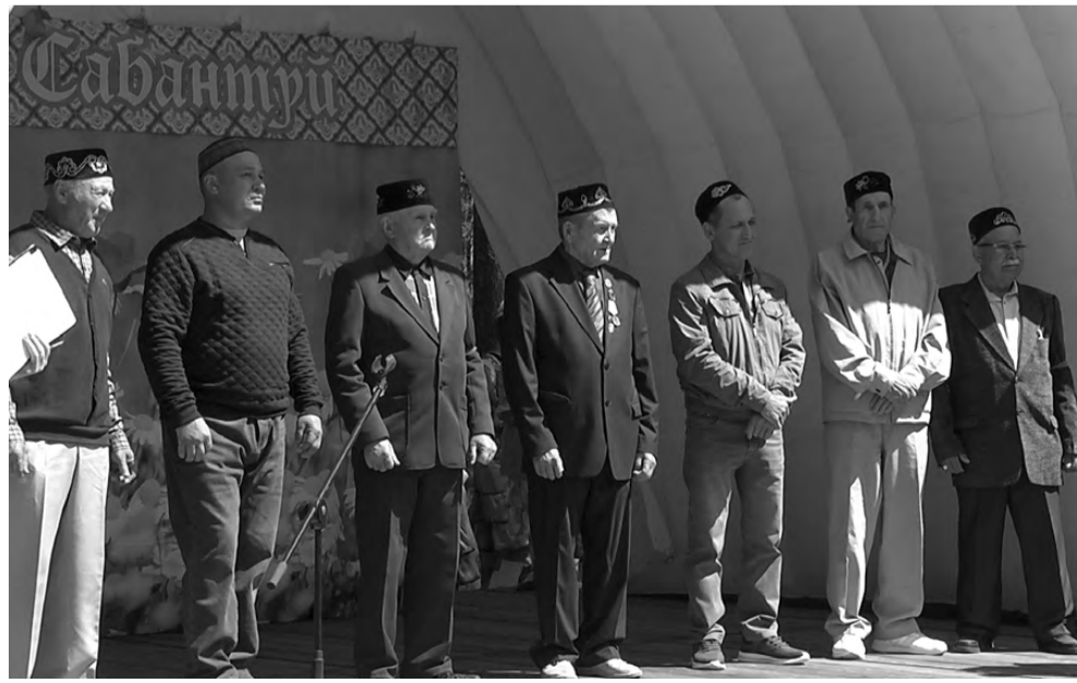
Традиционное чествование старейшин.