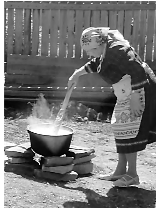
На Гербер всегда готовят обрядовую кашу.