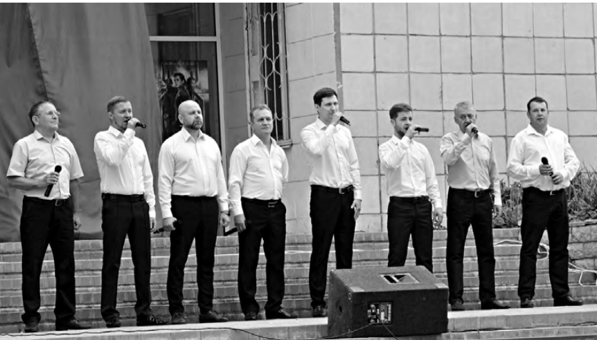
Концерт в Кировграде.