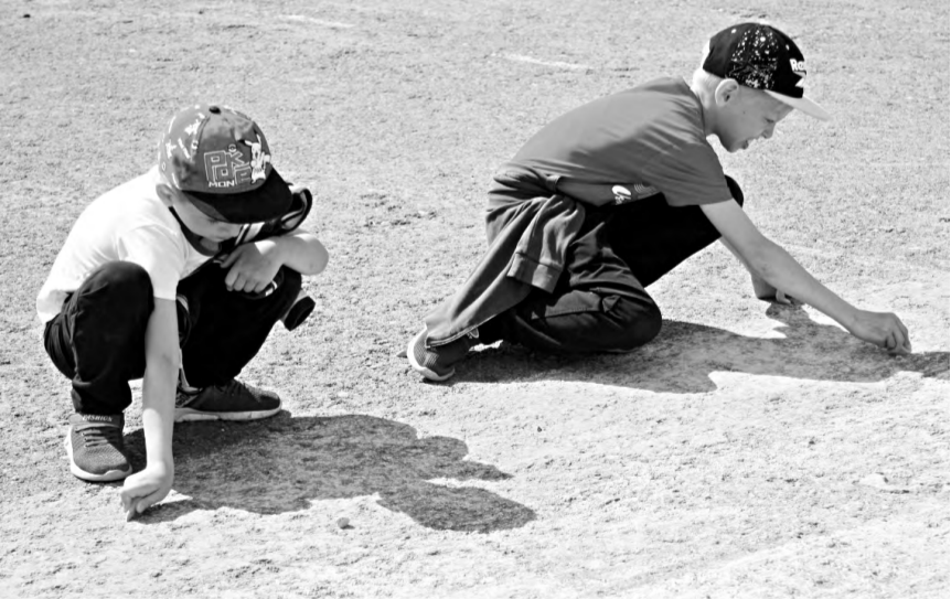
В Карпинске дети рисовали на асфальте государственную символику.

Подготовила Галина ПОПОВА.