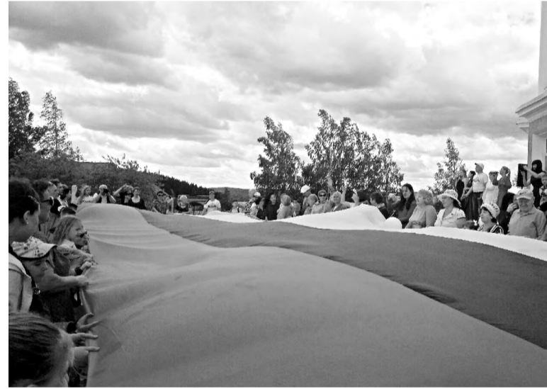
На празднике в Нижней Туре.