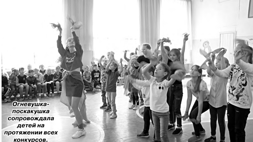
Огневушка-поскакушка сопровождала детей на протяжении всех конкурсов.