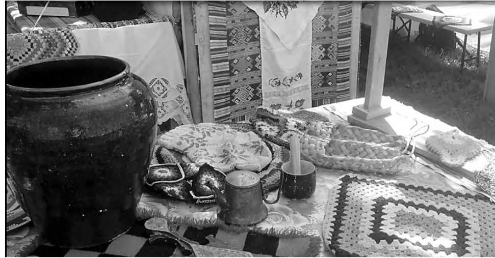
На подворьях были представлены элементы удмуртского быта.

Отличительная черта удмуртов – гостеприимство, оно у них в крови. Раньше, если в дом к одной семье приезжали гости, то их были готовы принять у себя и все родственники, живущие в этой деревне. На режевском празднике Гербер были рады всем гостям, царила открытая, добрая атмосфера, а народные коллективы создали весёлое настроение, выступая