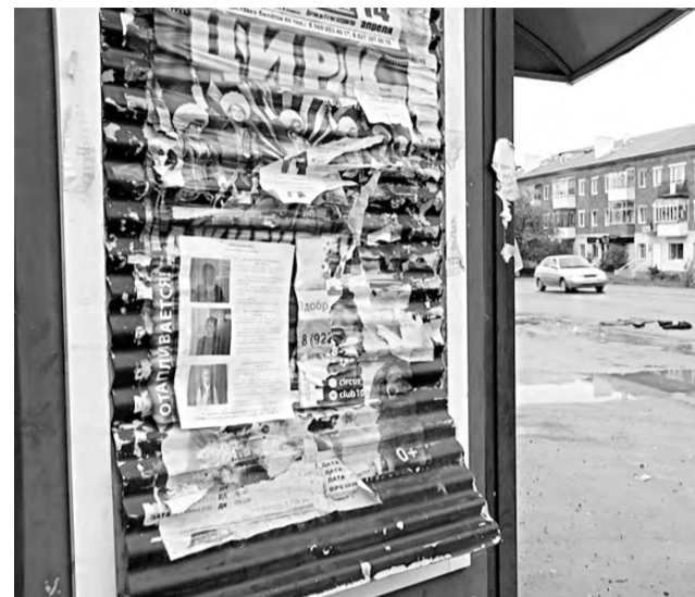
Ориентировки разместили по всему городу.