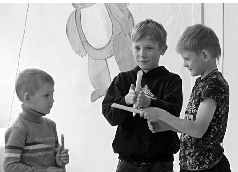
Ребятишки учились добывать огонь...

ОНД и ПР Режевского ГО и 223 ПСЧ.