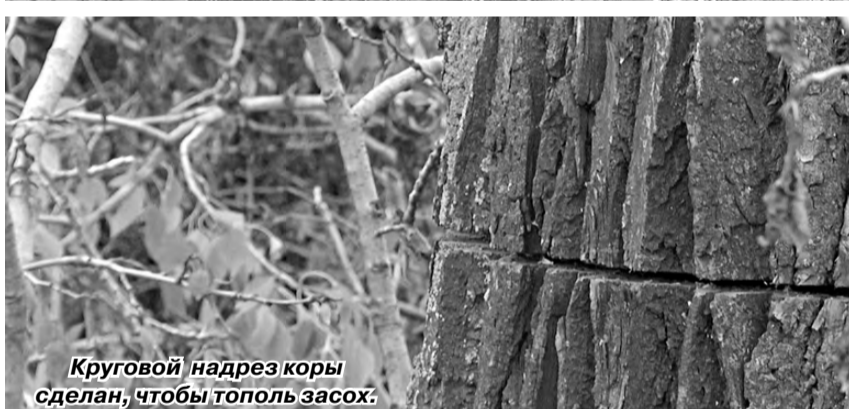
Круговой надрез коры сделан, чтобы тополь засох.