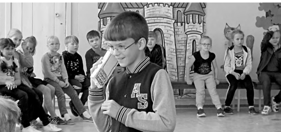
Всем надо знать, как вызвать пожарных в случае возникновения огненной беды.