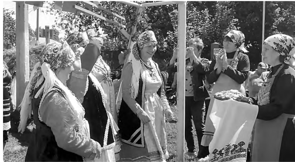
Удмуртская традиция – встречать гостей хлебом и маслом.

на сцене с удмуртскими танцами и песнями.