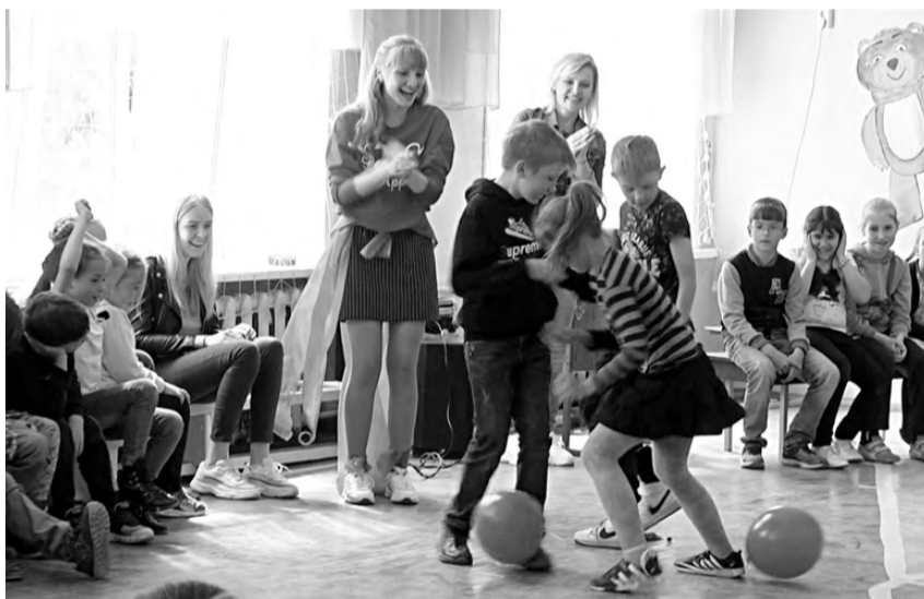
...и тушить пожар.