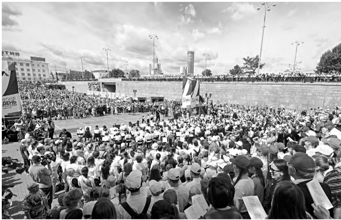
В Екатеринбурге праздничные мероприятия собрали множество гостей.

В День России в муниципалитетах Свердловской области прошло 360 праздничных мероприятий, участие в которых приняли 95,5 тысячи человек.