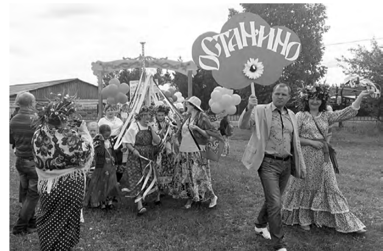
Районный праздник «Уральский хоровод» в Режевском городском округе традиционно проходит в День России.