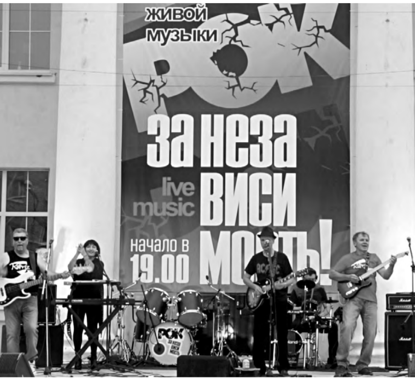
12 июня в Реже прошёл праздничный рок-концерт.