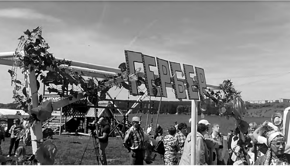
Все гости проходили через символические ворота и, следуя традиции, звонили в колокольчики.

Когда все зёрна посеяны и остаётся только ждать всходов - можно вздохнуть спокойно. Это - время праздновать удмуртский национальный праздник Гербер. В этом году он впервые прошёл в Реже. Гербер - весёлый праздник, призванный объединить все народы в согласии и дружбе. В этот день в наш город приехали гости из самых разных уголков Свердловской, а также Тюменской, Челябинской областей и из республики Удмуртия!