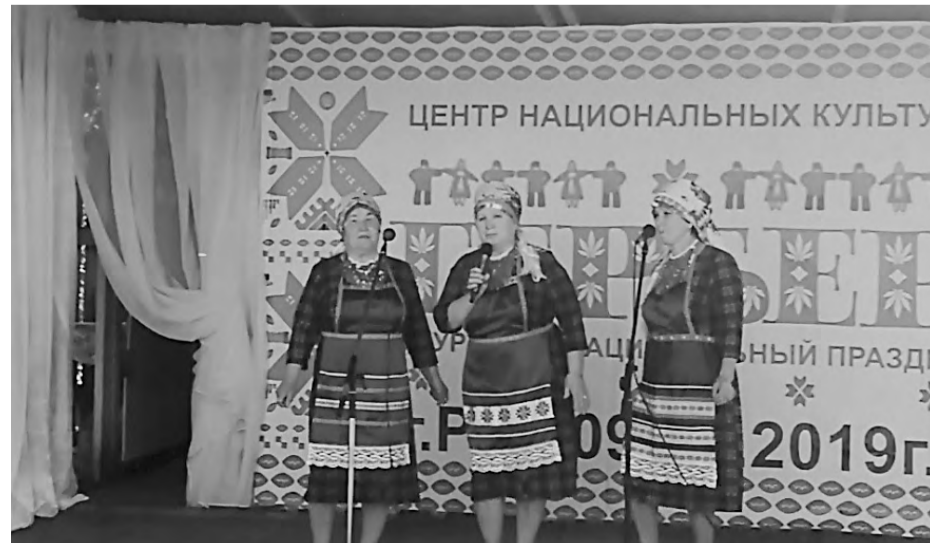
Весь день на сцене выступали народные коллективы.

Подготовила Полина САЛАМАТОВА.