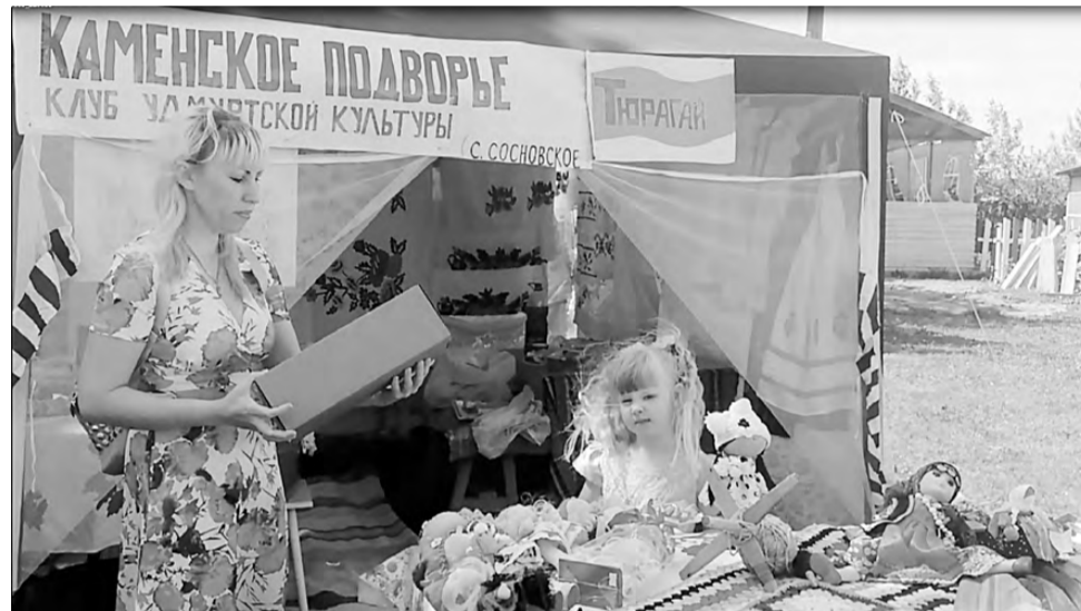
На праздник приехали гости из нескольких областей.