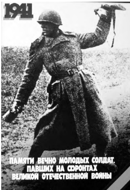
Плакаты художника В. Лузина. 1984 г. Бумага, гуашь, фото. Собственность национального музея им. К. Герда, г. Ижевск.