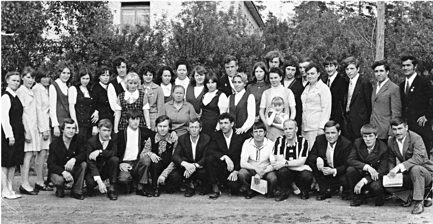
ШРМ №2, выпуск 1975 г.