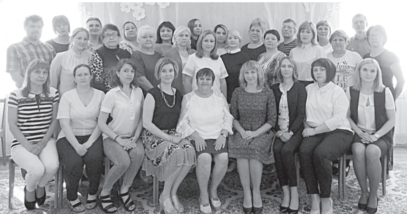
В минувшем году работники социальной сферы отметили 100 лет со дня образования в России этого важного государственного направления деятельности. В каждом периоде нашей жизни случаются значимые события, и за год после 100-летия в социально-реабилитационном центре для несовершеннолетних Режевского района они также произошли. (Продолжение на странице 2.)