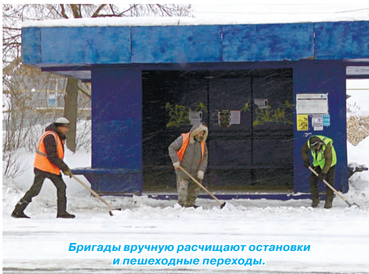
Бригады вручную расчищают остановки и пешеходные переходы.