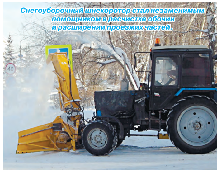
Снегоуборочный шнекоротор стал незаменимым помощником в расчистке обочин и расширении проезжих частей.