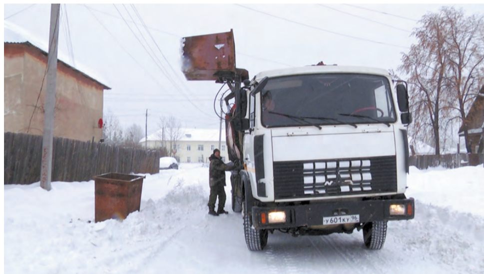
Мусоросборочная техника работает без выходных. С больших контейнерных площадок мусор вывозят 2-3 раза в день.

- В 2018 году мы своими силами восстановили гараж, переданный нам во владение. Он расположен рядом с котельной микрорайона Гавань. Много лет помещение простояло заброшенным, там не было ни освещения, ни отопления, а