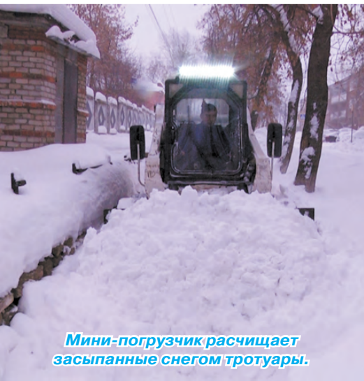
Мини-погрузчик расчищает засыпанные снегом тротуары.