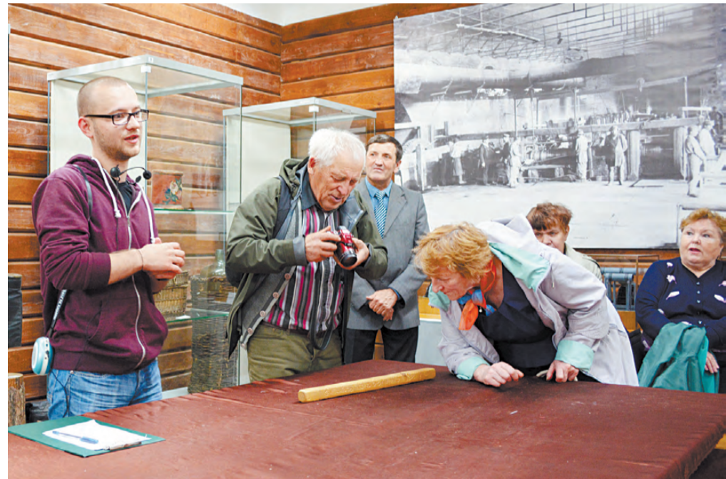
В музее краеведы с интересом осматривают один из экспонатов - древний календарь на деревянном бруске.

В итоге обсуждения краеведы решили составить список домов, которые надо со-