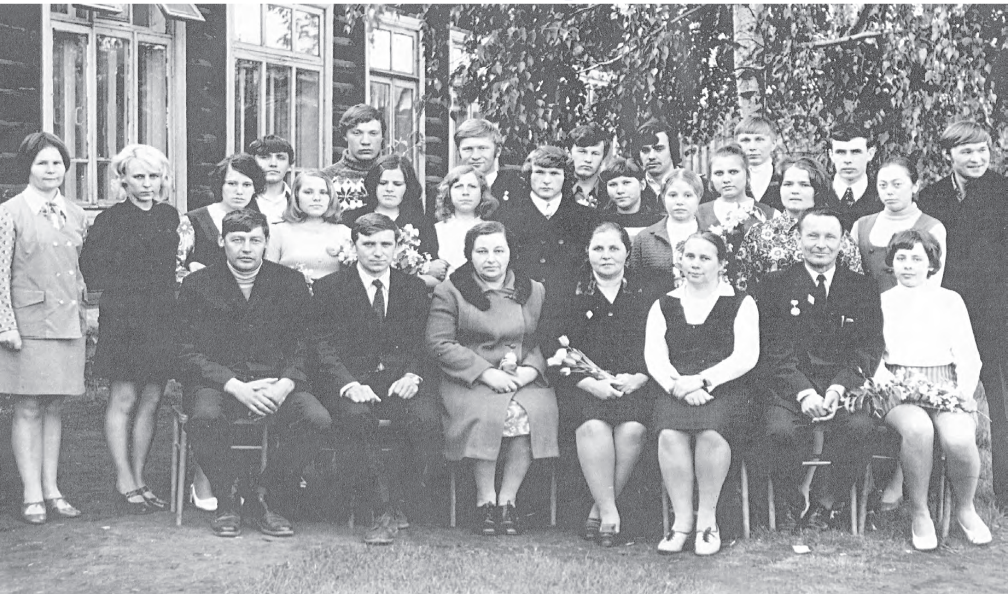
ШРМ №2. Выпуск 1975 года.