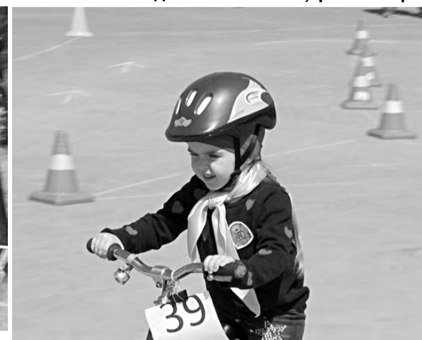
Одна из младших участниц соревнований.