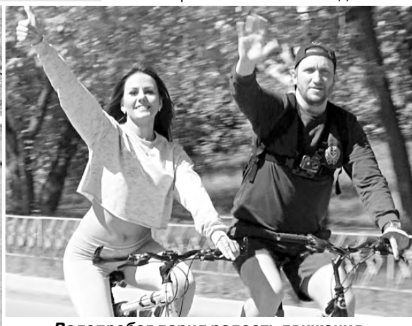
Велопробег дарил радость движения, позитивные эмоции.