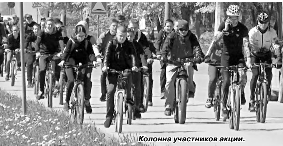
Колонна участников акции.