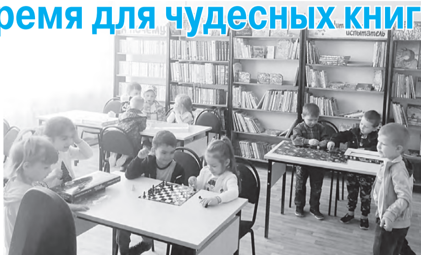
Детям из «Золотого петушка» очень понравилась экскурсия в библиотеку.