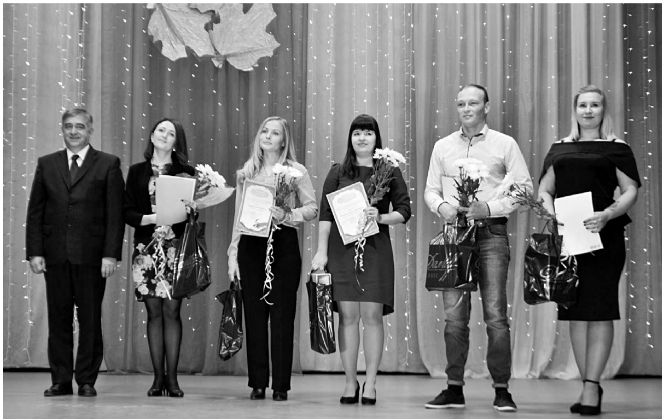
Участники муниципального конкурса «Профессия учитель – мой выбор».

В 16 школах Режевского городского округа 5245 учени-