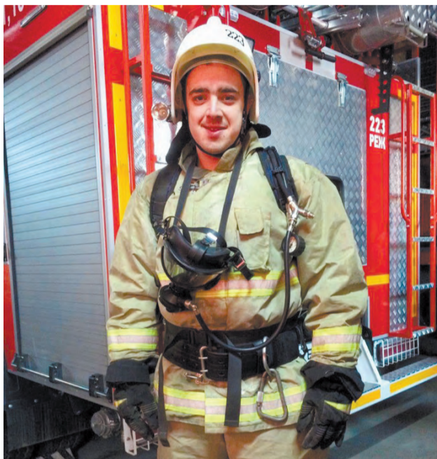
Спасатель готов к работе.