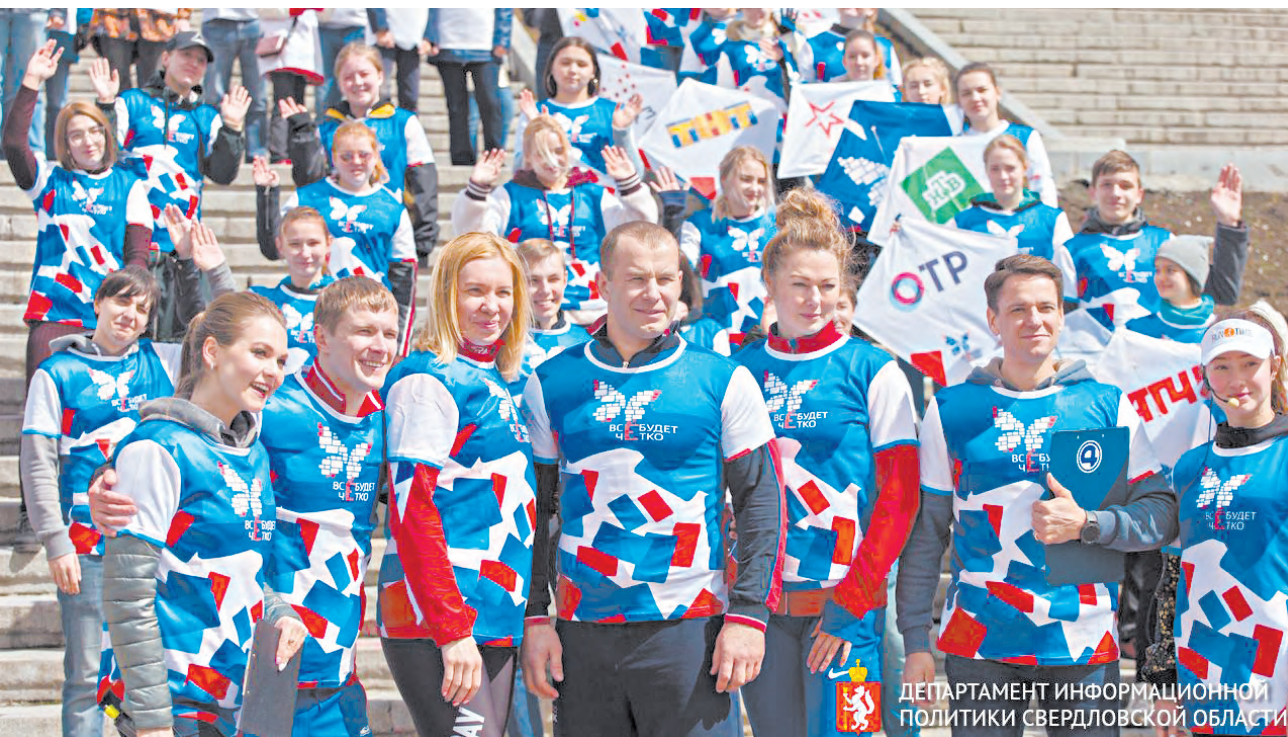
ДЕПАРТАМЕНТ ИНФОРМАЦИОННОЙ ПОЛИТИКИ СВЕРДЛОВСКОЙ ОБЛАСТИ