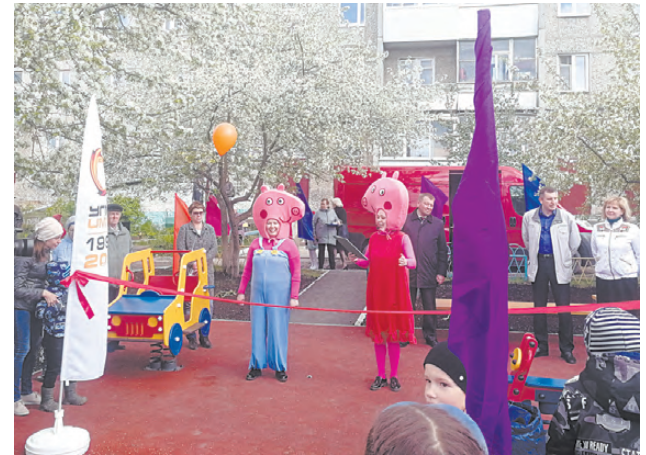
Торжественное открытие провели сотрудники ДК «Металлург».