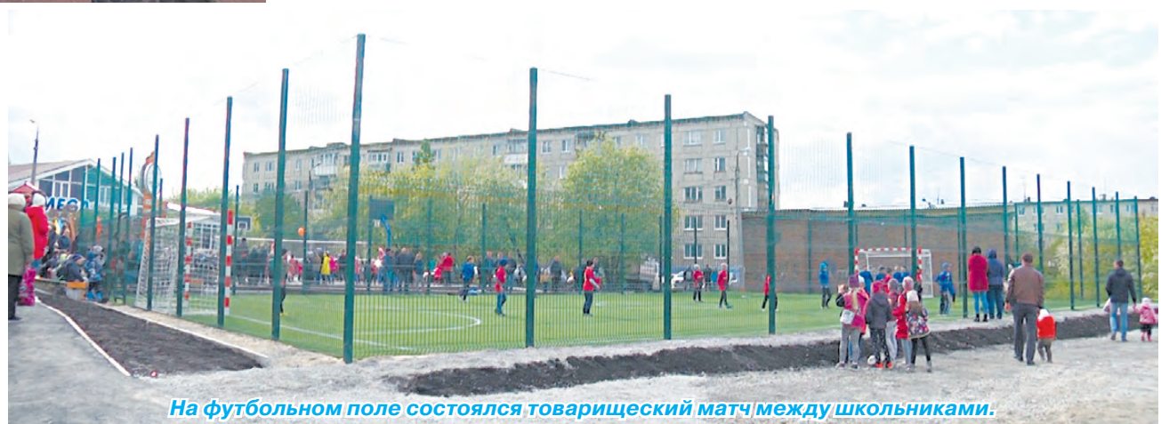
На футбольном поле состоялся товарищеский матч между школьниками.