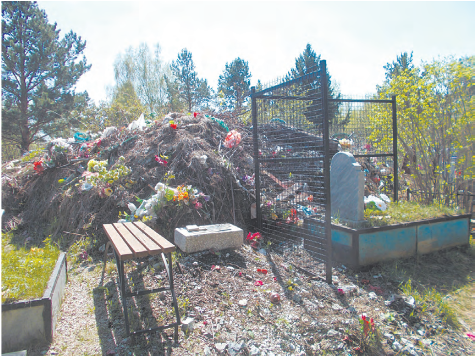
Последнее спасение от мусорной кучи.

торым работают члены Режевского историко-родословного общества, является проект «Некрополь «Орлова гора».