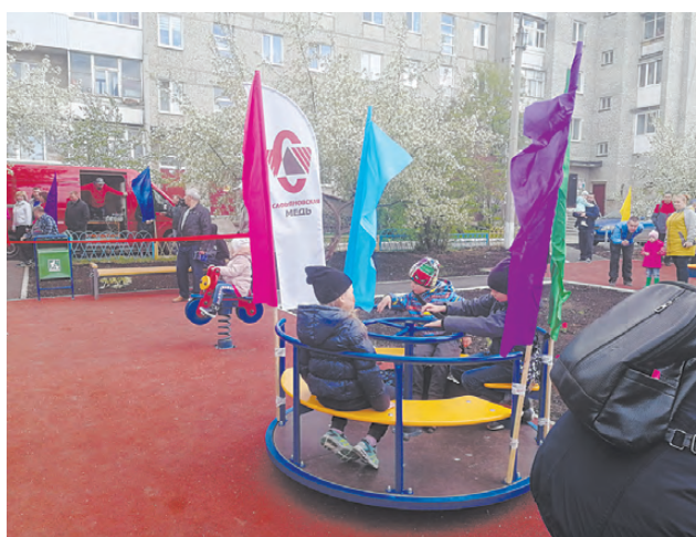
На карусель приходили все новые ребята.