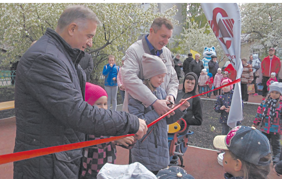
Торжественный момент – разрезание красной ленточки.