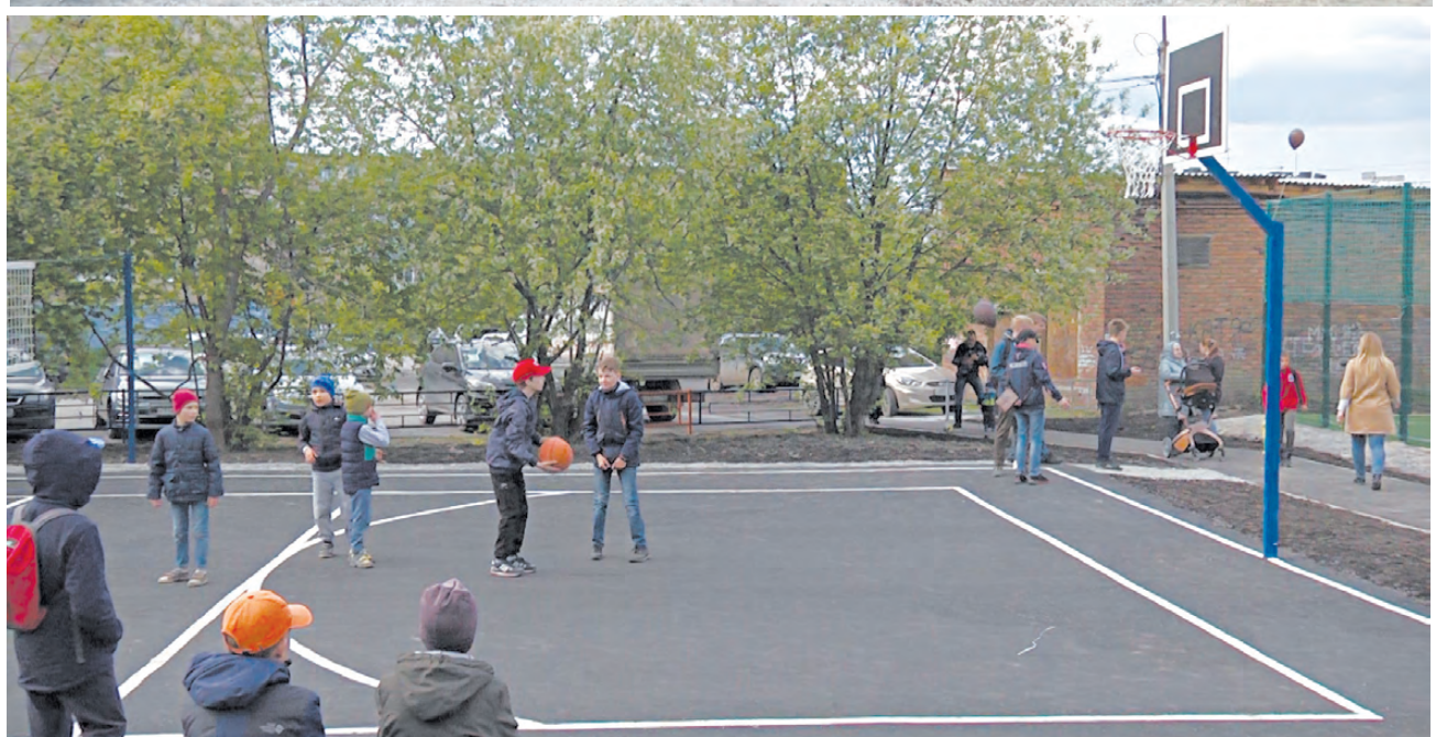
Подростки играли в волейбол и баскетбол на специальной площадке.