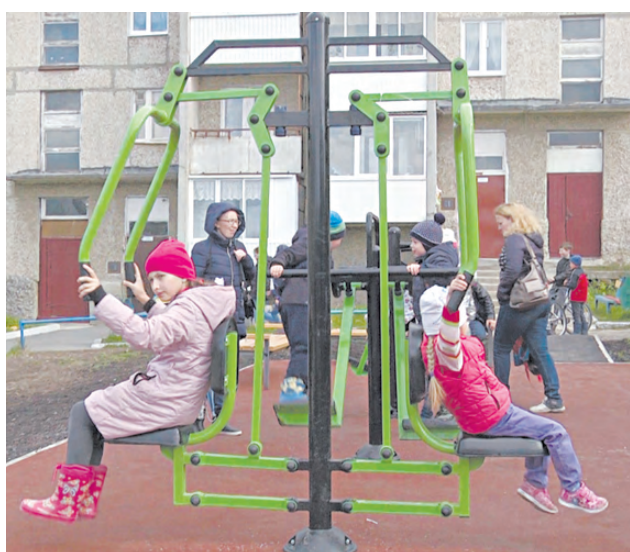
Ребята постарше осваивали тренажёры.