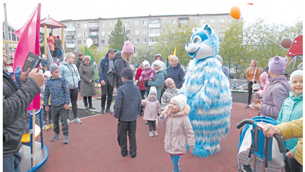
На открытии площадки было много малышей и их родителей.