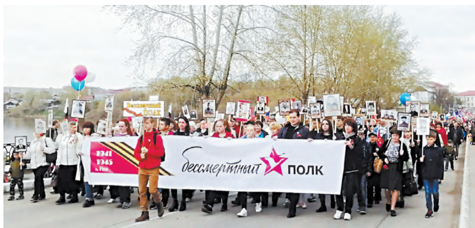
Колонна «Бессмертного полка» объединяет всё больше режевлян.

Губернатор Свердловской области Евгений Куйвашев возложил цветы к Вечному огню на Широко-реченском военно-мемориальном комплексе и принял участие в торжественно-траурной церемонии «Память», с которой в уральской столице по традиции начинается каждое 9 мая.