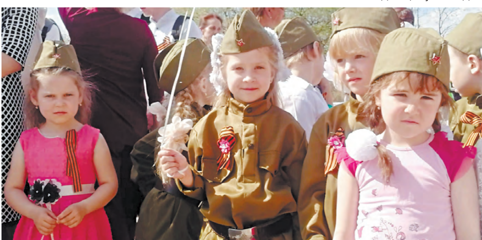
Юные участники митинга в микрорайоне Быстринском.

Полина САЛАМАТОВА, Галина ПОПОВА.