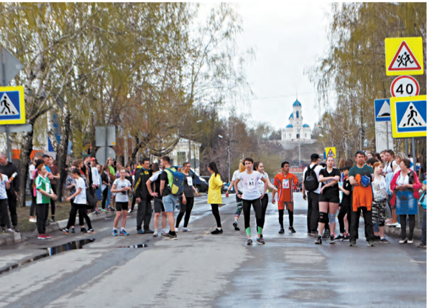
Участники соревнований на этапе в ожидании эстафетной палочки.