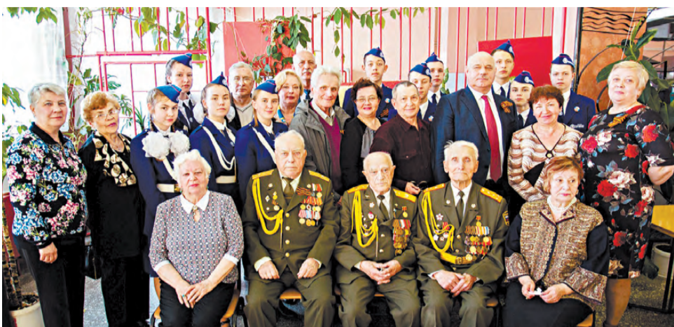
Поисковый отряд «Рысь» на встрече с ветеранами в г. Екатеринбурге.