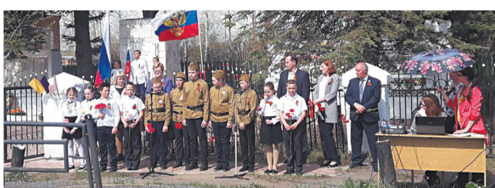
На торжественном митинге в с. Липовское.

Торжественные мероприятия в нашем городе продолжались 8 мая. В этот день состоялся митинг в микрорайоне Быстринском. Жители собрались у стелы «Они