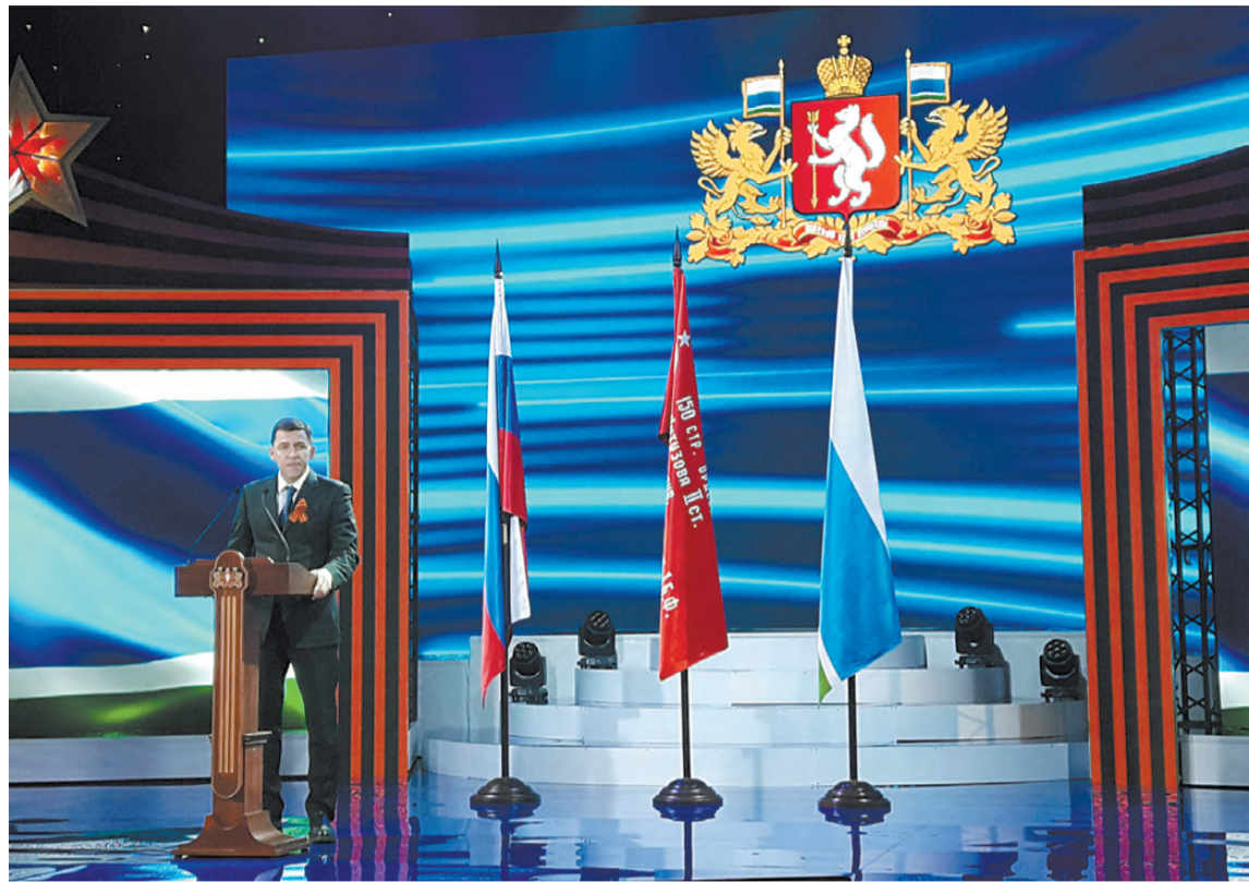
С праздником Великой Победы гостей торжественного собрания поздравил губернатор Свердловской области Евгений Владимирович Куйвашев.