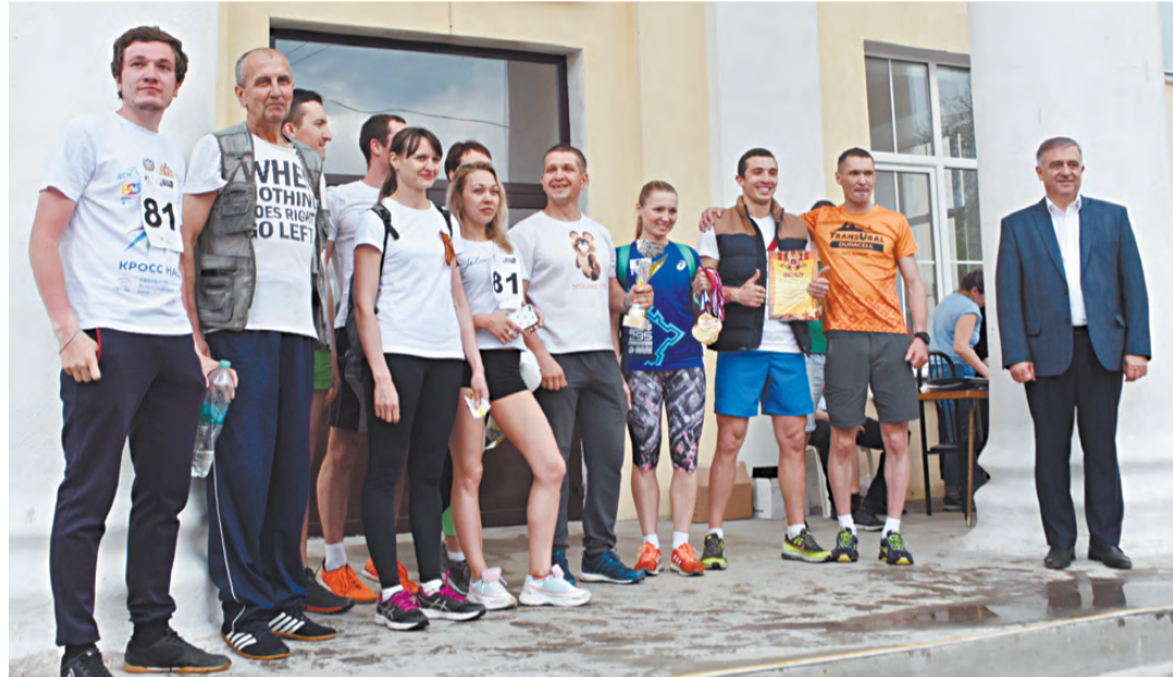
Команда «Учителя физкультуры» стала победительницей в шестой группе командного (эстафетного) зачёта.

В муниципальных Свердловской области с начала мая было запланировано и проведено большое количество мероприятий. Традиционно значительная их часть проходила в Екатеринбурге, Первоуральске, Верхней Пышме, Нижнем Тагиле, а также в Артях и Байкалово. Помимо торжественных церемоний, митингов и массовых гуляний в муниципальных прошли театрализованные представления, фейерверки, литературные марафоны, дни открытых дверей в музеях, вело-, авто- и мотопробеги, легкоатлетические эстафеты и шахматные турниры, создание аллей Победы и многие другие мероприятия, в которых принял участие практически каждый житель нашего региона.