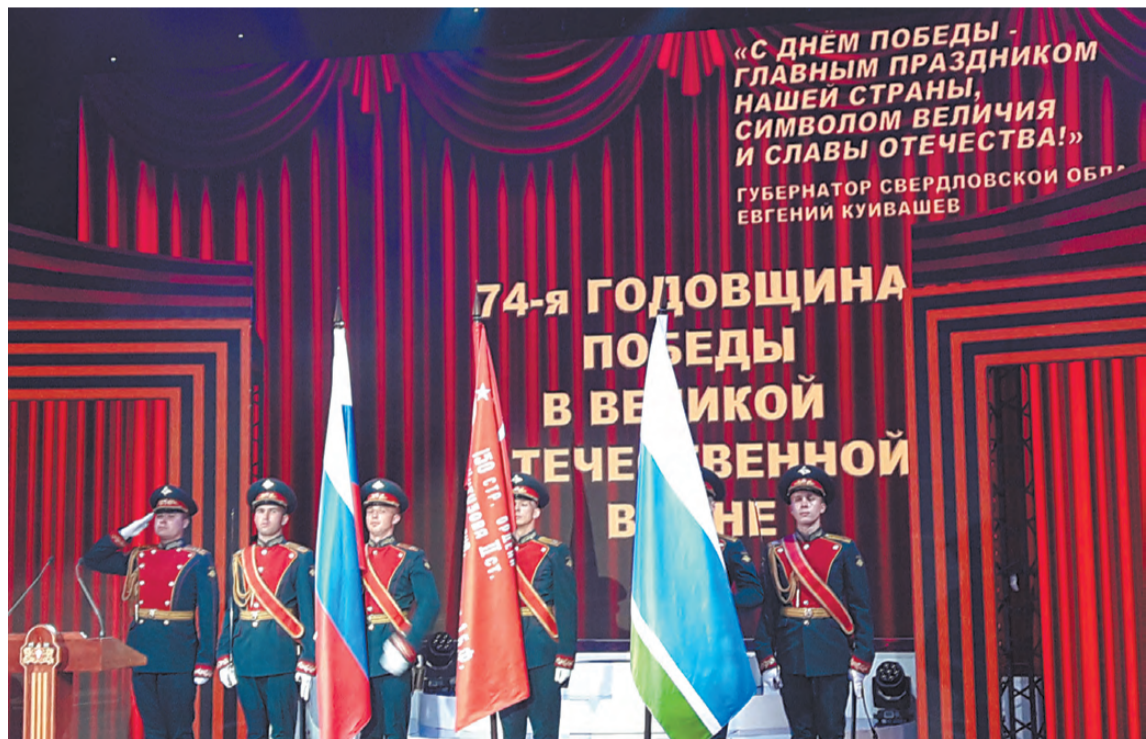
На сцене – флаги Российской Федерации, Свердловской области и Знамя Победы.