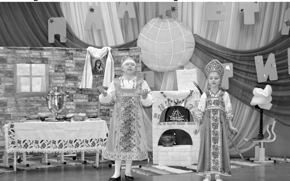
Победители фестиваля проектов – ученики 3-го класса школы №2 – показали мини-спектакль «Масленица. К тёще на блины!».