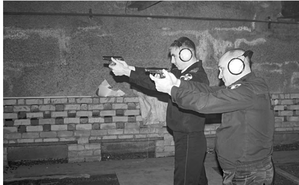
Боевая и физическая подготовка сотрудников – это важно.

В обязанности групп задержания входит не только готовность незамедлитель-