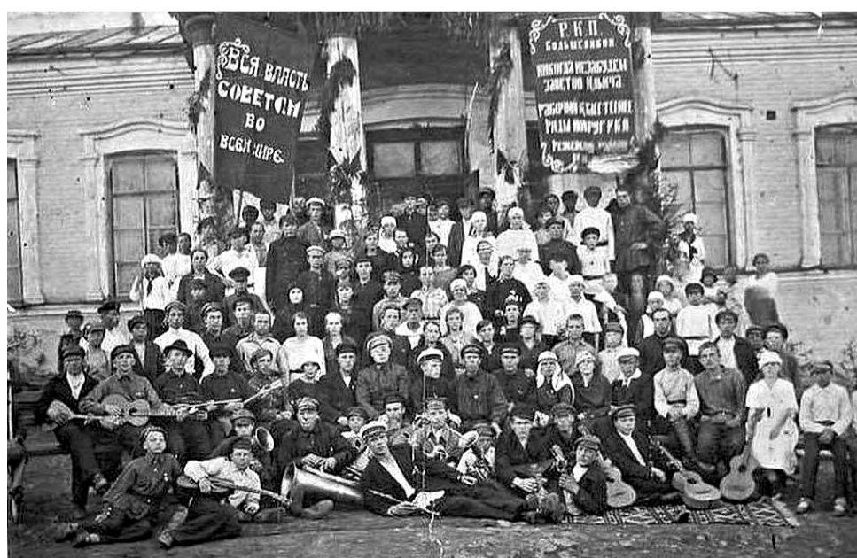
Самодельные артисты в Реже у главного входа в бывшее заводоуправление (в те годы первый в истории Режа клуб, ныне улица Советская), фото 1920-х годов.

Следующее собрание состоялось 6 сентября. Комсомольцы обсудили вопрос о секциях. Решили начать работу культурно-просветительской секции, в которую к тому времени уже записались более 60 человек. Позднее, как видно из протоколов собраний, была создана также политическая секция, а культурно-просветительская разбита на подсекции: школьная, театральная, художественная,