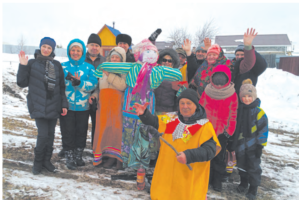
Дружные жители деревни Соколово ждут скорого наступления весны.