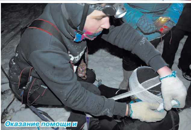
Оказание помощи и транспортировка пострадавшего.