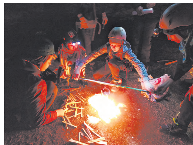
Разведение костра и добыча питьевой воды.