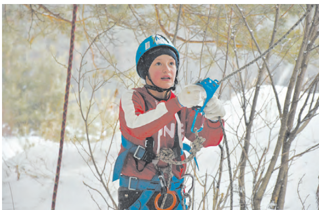
Подъём при помощи снаряжения.

Утро второго дня ознаменовало начало индивидуальных соревнований. Здесь юные туристы преодолевали короткую дистанцию длиной 450 метров. Это была эстафета, которая включала в себя четыре этапа: параллельные перила, подъём «ёлочкой» на лыжах, упражнение «маятник» и спуски на лыжах на тормозном устройстве.