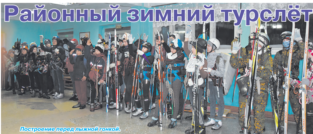
Построение перед лыжной гонкой.

метра. На всём её протяжении ребятам встречались препятствия, всего трасса была разделена на пять этапов. Участники справлялись с навесной переправой, выполняли упражнения «спуск» и «подъём» с помощью специального туристического оборудования. В максимально приближенных к реальности условиях юные туристы преодолевали препятствие «тонкий лёд». Коллегия жюри оценивала именно командную работу, слаженность и грамотность действий, от которых зависело количество итоговых баллов.