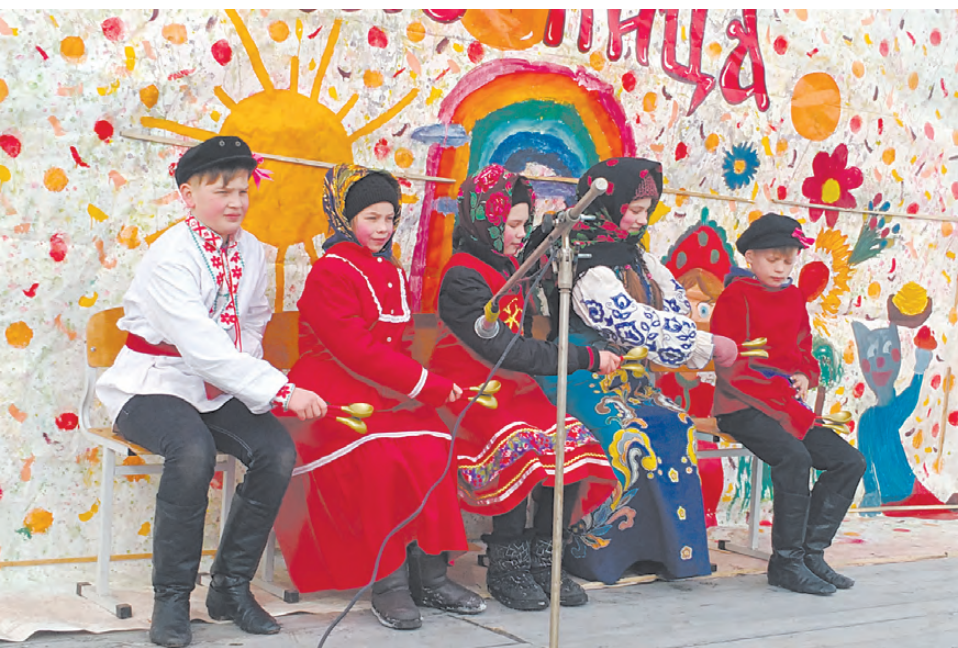
В селе Фирсово Масленицу отметили песнями да весёлыми играми.