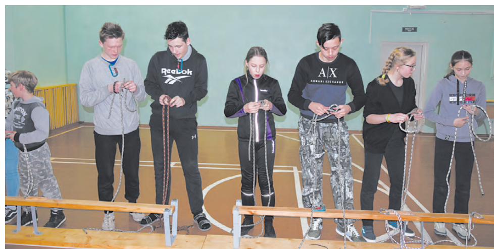
Вязание узлов – дело непростое.

В младшей возрастной группе на дистанции второго класса лучший результат показала команда «Вега-2», второй стала «Вега-3», на третьем месте ребята из «Арго-2». По итогам конкурсной программы лучшей стала команда «Арго-2» - они победили в вязании узлов, викторине «Знатоки Урала» и поисково-спасательных работах. На втором месте в этом блоке первенства РГО – команда «Вега-2».