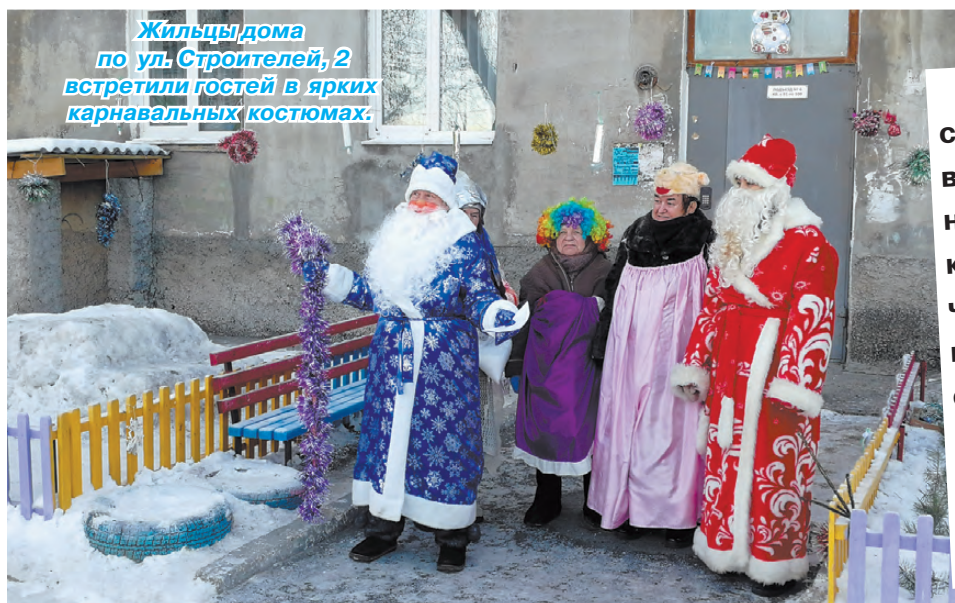
Жильцы дома по ул. Строителей, 2 встретили гостей в ярких карнавальных костюмах.