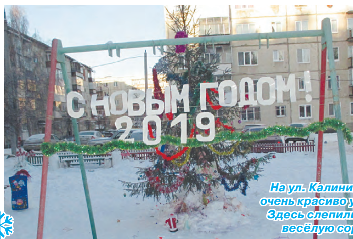
На ул. Калинина, 8/4 также очень красиво украсили двор. Здесь слепили осьминога и весёлую сороконожку.