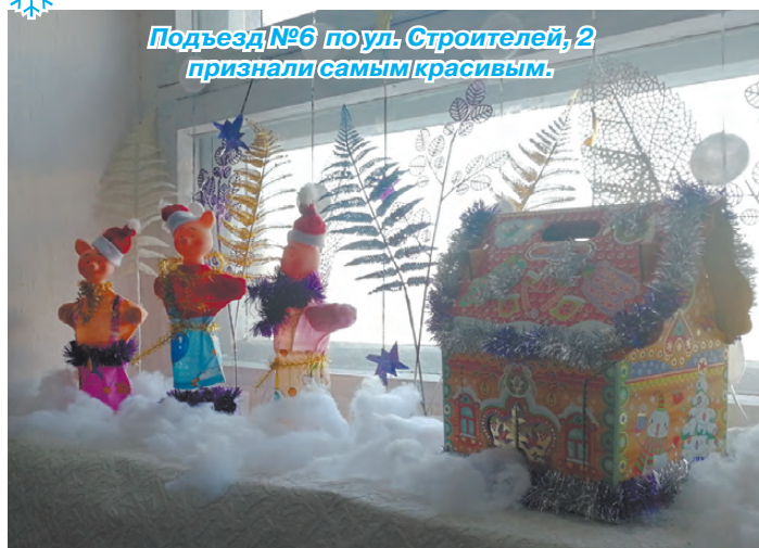
Подъезд №6 по ул. Строителей, 2 признали самым красивым.